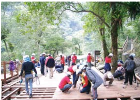
志工們齊力打造無障礙平台

走出戶外享受大自然的洗禮，是現代人不可或缺也最嚮往的休閒活動，不僅能放鬆心情，也有助於增進身心健康。然而，對行動不便的身心障礙朋友來說，走出戶外卻是件困難重重的事，有形與無形的限制與障礙充斥在生活空間中，當然更別說是想要進一步的親近大自然了。同為社會中的一分子，身心障礙者也應該擁有公平的機會參與享受戶外休息和體驗