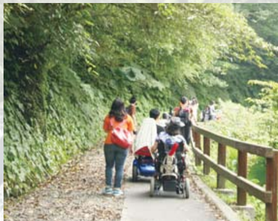
平穩的路面讓輪椅使用者舒適得享受內洞國家森林遊樂區的芬多精