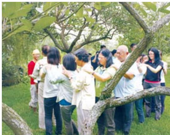
學著用另一種方式來欣賞森林之美

人類不斷的用邏輯、分析、分類、專業……等等分割的方式，在切割著一切。凡事都要有個目的和好處，無所事事變成沒有意義、浪費時間。而經年累月不斷循環、生生不息的大自然，就成了沒有意義、浪費時間的代表作。照著這邏輯，砍掉森林、炸開石頭、翻開土地、與海爭地……等等，好像也就不難理解了。