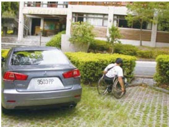
7.停車位：未劃設或下車區鋪面不利通行。