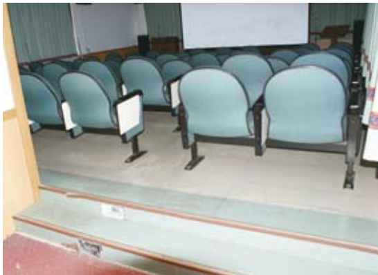
5.視聽室：門檻以及普遍缺乏輪椅席區。