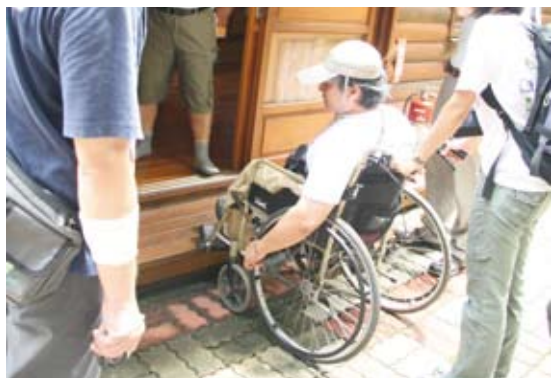
3.出入口：階梯對行動不便者形成入住阻礙。