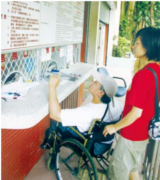
6.售票口或櫃檯：櫃檯過高難以親近。