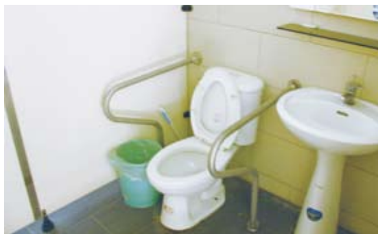
1.廁所：迴轉空間不足，開門方式造成無法自主進出；扶手裝置過高或錯置，鏡面過高不符需求。

森林遊樂區進行檢覈工作，一方面採用「建築物無障礙設施設計規範」的項目與標準檢覈屬於硬體設施設備的部分，例如：遊客中心、售票亭或自然教育中心的出入口、斜坡、無障礙廁所、停車場……等等項目，而另一方面針對戶外範圍則採取使用者的觀點進行實地檢覈，提供發現與建議，例如：園區地圖資訊、指標、解說牌的高度角度、休憩平台的動線、鋪面……等等。在進行18處國家森林遊樂區勘查的實例