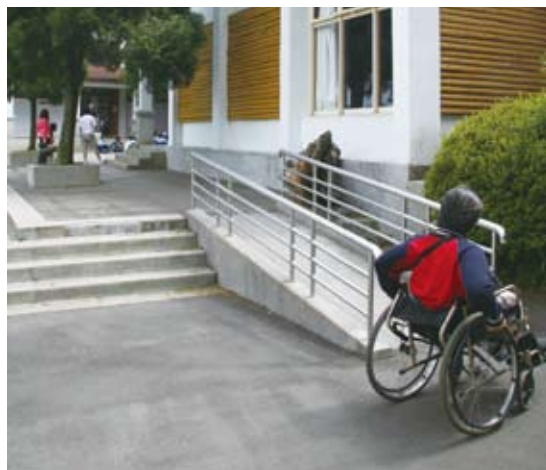
2.坡道：斜坡比例不足1:12導致過陡，扶手直徑過粗或未設置防護緣造成使用障礙。