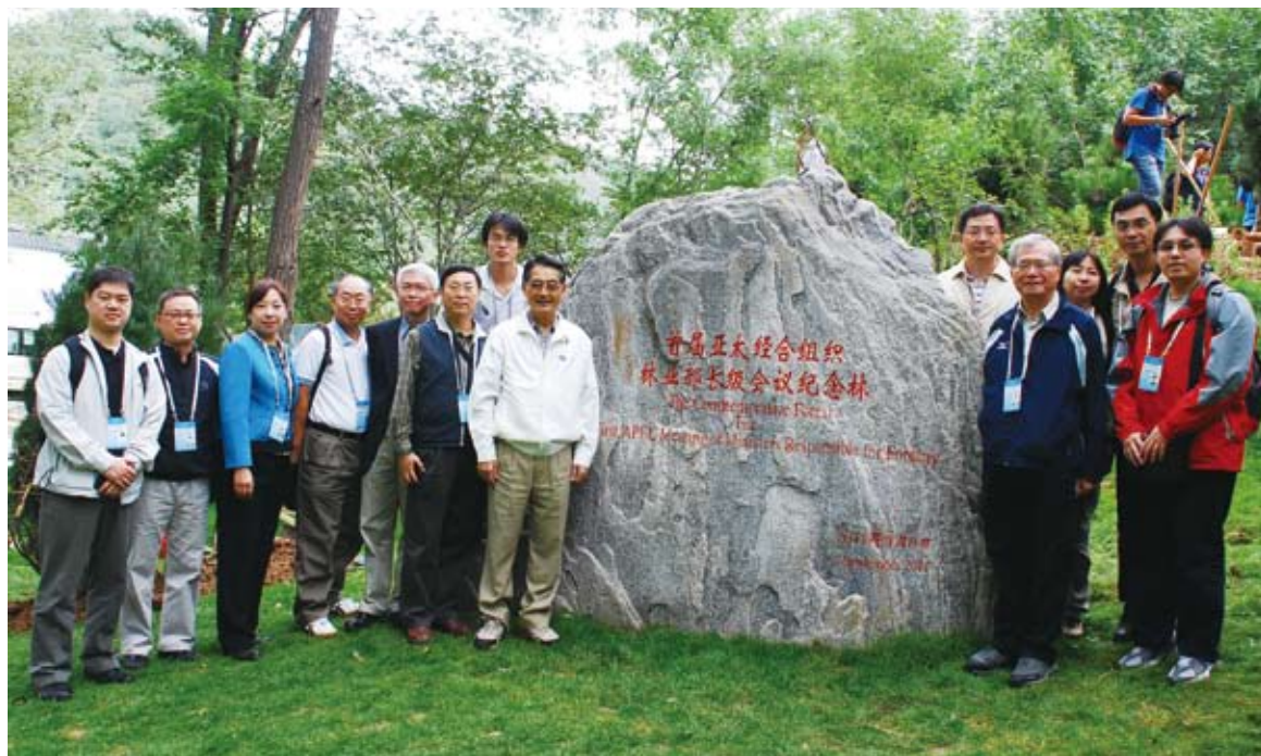
陳主委率中華台北代表團成員於北京市八達嶺植樹區合影