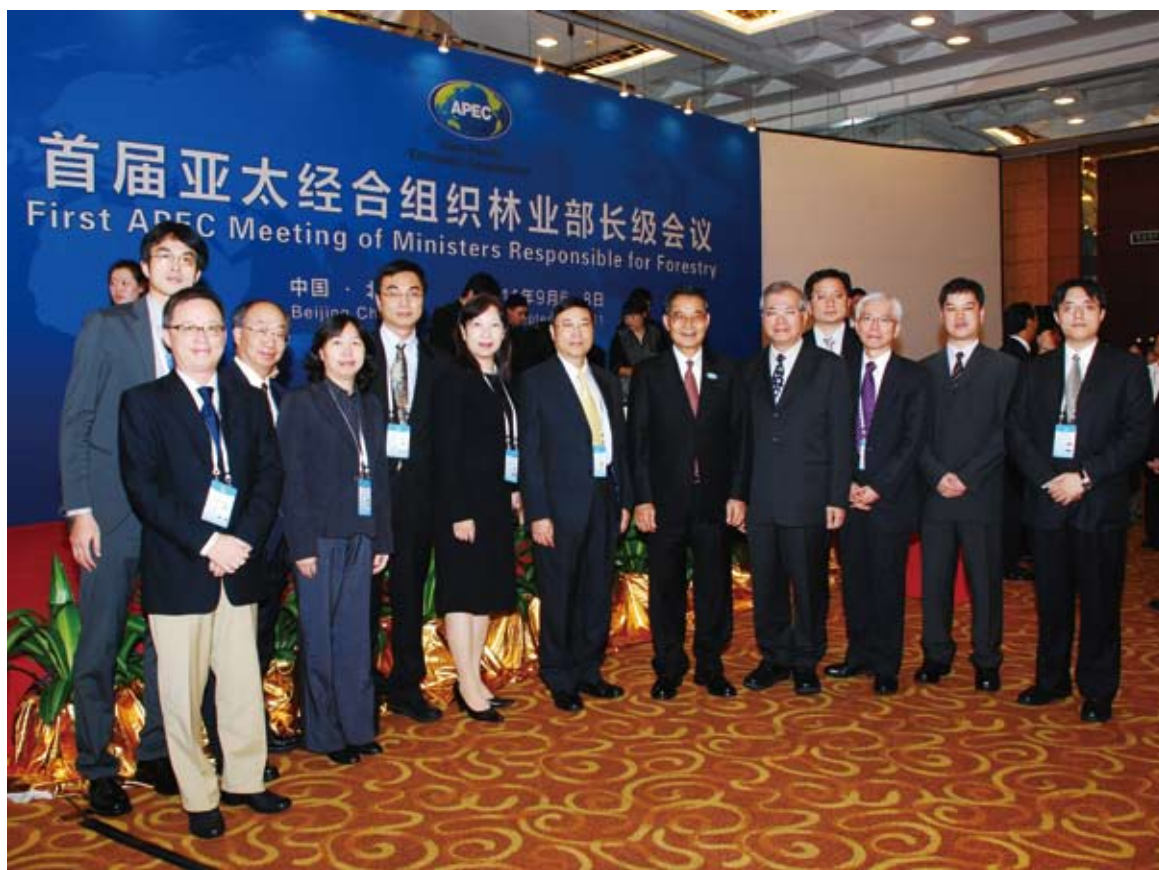
陳主委率國際處、林務局及林業試驗所代表參加大陸北京市舉辦「首屆APEC林業部長會議」

4. 我國自2008年起至2011年7月止，累計造林面積約1.6萬公頃，森林覆蓋率接近60%，雖然與亞太各國相較面積增加較小，但有鑒於我國土地面積狹小與人口密度相當高，有這樣的成