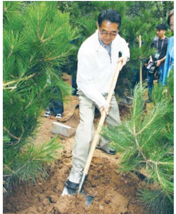
陳主委與各國經濟體代表共同前往北京市八達嶺地區植樹活動中，陳主委親手種植油松

(五)植樹活動：於9月8日我國陳主委武雄，與美、日等各經濟體代表共同前往北京市八達嶺地區進行植樹活動，以實際的行動呼應本次部長會議所揭櫫的綠色成長主題。