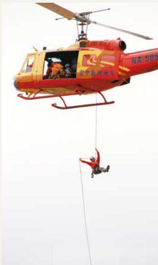
台東林管處國家森林救火隊成員參加直升機繩索垂降訓練，「沒在怕的啦！」

林務局台東林區管理處為提升救火效能，100年8月18至19日邀請內政部空中勤務總隊第三大隊第三隊及內政部消防署特種搜救隊台東分隊等救災單位，共同辦理「森林火災陸空聯合防救演練」教育訓練課程，本次訓練課程是台東處第一次辦理直升機繩索垂降作業，參訓人員動作迅速、過程逼真，訓練順利圓滿結束，對於日後森林救火行動應有助益。(台東林區管理處 張勝傑)