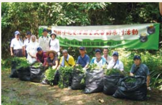
結合政府與民間力量，身體力行，共同宣示剷除「綠癌」小花蔓澤蘭。