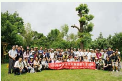
森林溪流魚類調查教育訓練班全體學員合影。(高雄醫學大學邱郁文教授提供)

為完整建立國有林班內溪流魚類長期監測調查資料，進而訂出具體可行性的保護措施，林務局77起即辦理森林溪流淡水魚類棲息地資源監測計畫。為持續強化現場人員森林溪流生物調查技能，100年9月1至2日在高雄醫學大學辦理「2011年森林溪流魚類調查教育訓練班」，邀請專家學者就溪流甲殼類、溪流魚類、底棲動物調查與鑑定等方法進行課程訓練，計有80名調查成員參與訓練。(林務局 陳至瑩)