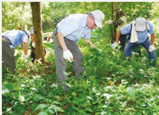
林務局代理局長李桃生與民眾一起除蔓。

的重要性，達到全民共同參與小花蔓澤蘭防治的目的，攜手維護台灣生態。本日參與民眾達4千餘人，剷除小花蔓澤蘭數量超過12,000公斤以上，成果相當豐碩。(編輯部)