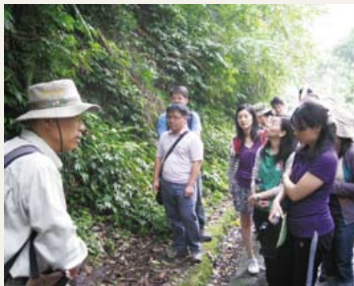
新進同仁至內洞國家森林遊樂區參訪，專心聆聽志工解說。(攝影／林務局 鄭國隆)

滿1年之新進同仁，講授林業法律的基本原理、二元對立下的森林經營、公務服務倫理、行政程序法及管理的真諦等6項基礎課程，共計82位新進同仁參加。另為使新進同仁瞭解國家森林遊樂區經營管理概況及實際顧客服務操作，分別至烏來內洞森林遊樂區進行參訪活動，參加的新進同仁們除了瞭解森林遊樂區經營概況及志工服務，並享受暫放鬆身心、親近自然之樂趣。(林務局 鄭國隆)