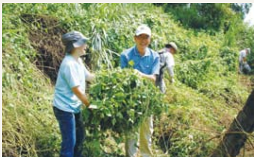
民眾熱情參與新竹處辦理的除蔓活動，有效抑制危害。