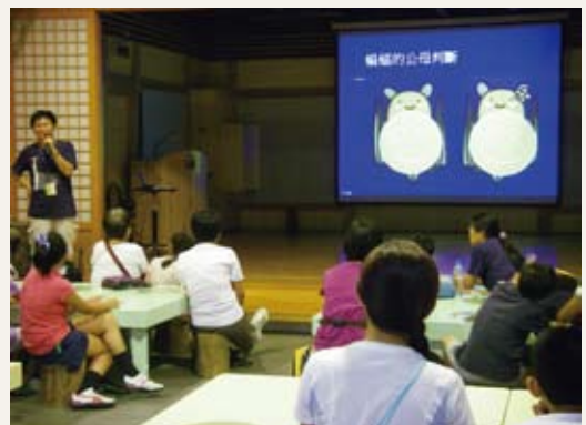
仔細聆聽，等會兒出去外面找蝙蝠囉。

羅東林業文化園區是許多生物活動的天堂，當太陽下山，園區主角換上另一批神秘的生物，此時便是蝙蝠出沒的時候，仔細一看，昏黃的路燈下，蝙蝠們正羅曼蒂克的享用燭光晚餐。講師專業有趣的介紹讓大家認識這些溫和可愛的小生物，一改我們對於蝙蝠的傳統印象。(羅東林區管理處 楊暄慧)