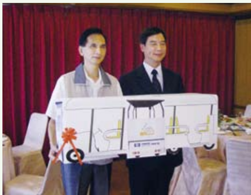
杏輝醫藥集團捐贈電動車儀式。