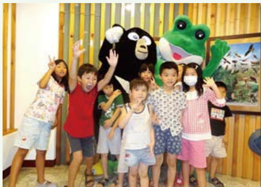
參加活動的小朋友與「黑嚕嚕」與「綠麻糬」合影。

林務局羅東林區管理處員山生態教育館100年8月27日舉辦第2梯次「黑嚕嚕的夜間森林探險」活動，運用劇場式解說，在館內帶領大小孩子們，一起用視、聽、觸、嗅覺來感受夜晚森林中的風吹草動和生物活動，打破大眾對生態教育館只有靜態展示的既定印象。一個小時的活動，讓參與的大小朋友彷彿走入森林劇場，體驗一場聲音、光影、觸覺、嗅覺的驚奇體驗。(羅東林區管理處 陳美貞)