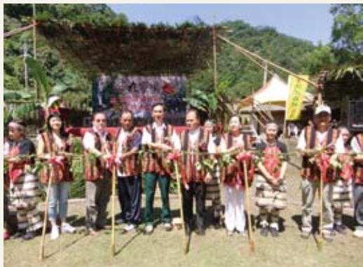
九寮溪啟用剪彩儀式。

九寮溪自然步道全線平緩，輕鬆好走。步道林蔭茂密、溪水潺潺，觸目所及盡是鬱鬱蒼木，漫步其中非常舒服。因路基多為河階台地，長滿了許多的地被植物，短短1.8公里路程，卻展現了多樣的生命力。步道終點