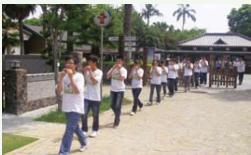
噶瑪蘭陶韻社以美妙的陶笛音樂，帶領進入森動館。

林務局為鼓勵民眾走入山林，體驗步道自然之美，提倡自然創作的風氣，舉辦一系列步道藝文比賽，自100年9月3日起至10月31日，於羅東林區管理處林業文化園區森動