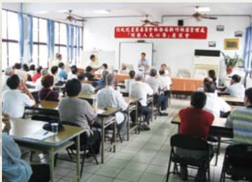
林務局楊副局長及新竹處張處長為民眾解答。(攝影／新竹林區管理處 黃子典)

林務局新竹林區管理處100年8月27日在竹東工作站，由林務局副局長楊宏志率員聽取新竹縣林農鄉親對於林業經營相關事務之意見或應興應革之各項建言。與會林農鄉親反應熱烈，對林業經營技術、木材產銷政策、租地造林地管理等提出多項建言。楊副局長及與會人員除為民眾解答外，並將民眾建議攜回意見妥處。(新竹林區管理處 黃子典)