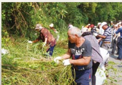
台東的社區民眾同心協力拔除小花蔓澤蘭，並用塑膠袋包起來，不讓它有落地生根的機會。