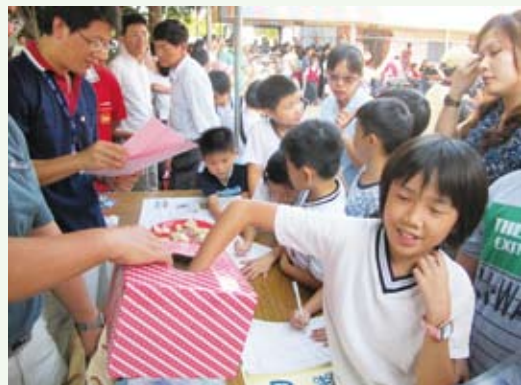
民眾踴躍參與活動。

100年9月18日林務局南投林區管理處為敦親睦鄰，協助登瀛書院舉辦「建院164週年秋祭暨頒發第二屆登瀛詩獎慶典」及宣導執行生態保育業務之成果，特以「生態久久、保育一百」為主題，進行攤位展示、有獎徵答及DIY拓印教學活動，宣導該處歷年來執行九九峰自然保留區、雲林湖本八色鳥野生動物重要棲息環境等各類自然保育成果，藉由認識執行各類保育業務的成果，進而讓民眾更加珍惜愛護生物資源。當日活動約有500餘民眾參加，活動備受肯定，參與民眾也深感獲益非淺。(南投林區管理處 蔡碧麗)