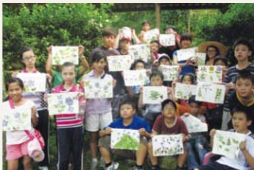
火炎山生態營隊參與學員展示製作的植物捶染成品。(攝影／新竹林區管理處 余建勳)

林務局新竹林區管理處特別於暑假結束前的100年8月22日在火炎山自然保留區舉辦火炎山生態營隊，由管理處解說員帶領當地小朋友與社區民眾實地深入人煙罕至的火炎山區，探索深藏山中百萬年地質秘密，瞭解當地特殊而豐富的地質景觀及生態資源，更安排了植物捶染及樹枝蟲製作，活動生動有趣。(新竹林區管理處 余建勳)