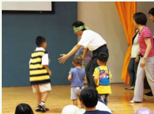
楊副局長與小朋友一同遊戲合影。(攝影／林務局 謝智雄)

配合「行政院及地方各級機關規劃辦理親子活動實施計畫」，100年8月4日林務局副局長楊宏志親自開場，揭開100年度「大手牽小手－員工親子快樂營暨第二、三季慶生會」序幕，並邀請小朋友與壽星代表一起切蛋糕。下午前往「台北自來水園區」參觀，了解自來水發展歷史及體驗各項親水設施，讓平日忙碌於工作的同仁放鬆心情，提昇親職職能，增進親子感情；本次活動計有120餘人參加，平安盡興而歸，活動圓滿成功。(林務局 謝智雄)