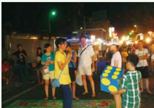
在台東觀光夜市辦「夏日野台電影院」，看完電影玩起「生態大富翁」，大小朋友猜拳、擲骰子毫不手軟。(攝影／台東林區管理處 周香宏)

為了讓台東地區的民眾可以觀賞更多精彩的生態紀錄影片，林務局台東林區管理處特別於100年8月12日在正氣路觀光夜市辦理「夏日野台電影院」，現場播放「飛鼠樂園—頂笨仔聚落飛鼠保育全紀錄」生態影片外，更設攤邀請民眾一起參與互動遊戲與兒童偶劇「愛在他鄉」，介紹外來入侵物種在台灣造成危害的情形，及一般民眾可以做的防治措施。同時也安排動物腳印書籤DIY，以及好玩的「生態大富翁」，大人、小孩爭相擲骰子、跳格子，參與的民眾都玩的不亦樂乎！(台東林區管理處 林素夷)