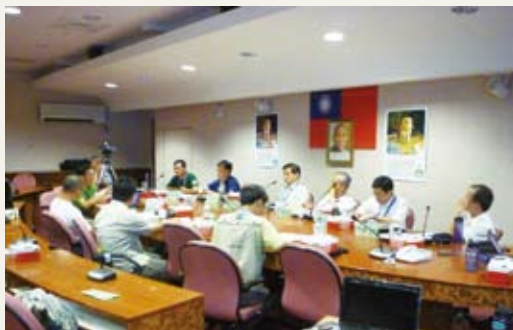
草鴞保育論壇會後小組進行討論。(攝影／林務局 劉泰成)

為了讓大眾一起關心傳說中的猴面鷹—草鴞，林務局補助高雄市野鳥學會在100年9月30日舉辦「2011草鴞保育論壇」，邀請專家針對族群現況、面臨的危機、保育歷程、救傷與圈養殖等課題進行分享，最終目的是完成「草鴞保育行動綱領」，並提出未來及後續的具體保育措施。(林務局 陳至瑩)