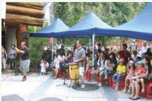
原住民歌聲迴繞於烏來林業生活館。

林務局新竹林區管理處100年9月10日在烏來林業生活館舉辦「敲敲打打、仲夏森林狂想」活動，由烏來一號樂團以多種樂器演奏原住民歌聲，讓歌聲迴繞於山林之間，使遊客體會烏來林業生活館呈現給大眾在地文化的自然人文氛圍；同時請烏來一號介紹各種打擊樂器，並邀請遊客與烏來一號樂團共同演奏，中間還穿插摸彩活動，讓遊客有個難忘的烏來林業生活館敲打體驗之旅。(新竹林區管理處 陳岫女)