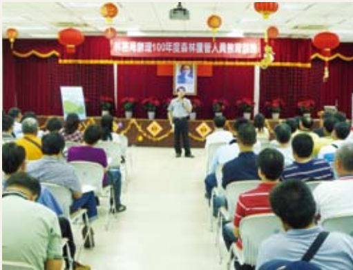
林務局在屏東林區管理處辦理護管人員教育訓練情形。(攝影／林務局 吳景揚)

為加強護管人員本質學能及溝通態度，林務局100年8月11日至9月5日，假各林管處辦理「100年度森林護管人員教育訓練」，課程內容著重於溝通協調技巧以及巡護所須之專業技能，使護管人員在執行巡護任務時，能避免引起民眾誤會或造成社會觀感不佳，總計參訓護管人員約700人。(林務局 吳景揚)