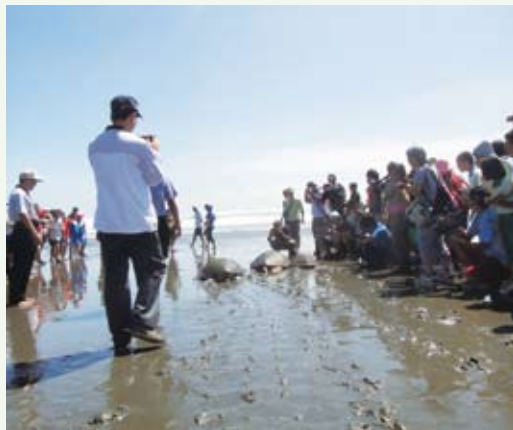
海龜聞到海水的氣味，奮力爬向大海，回到久違的家。(攝影／台東林區管理處 林勁吾)

家。本次野放活動，邀請當地民眾、學生參與，希望提醒民眾保育棲地環境的重要性。(台東林區管理處 林素夷)