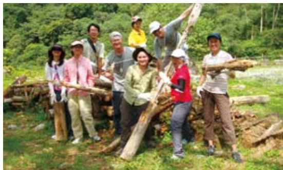
圖6 特別企劃—協助民間企業規劃回饋山林活動