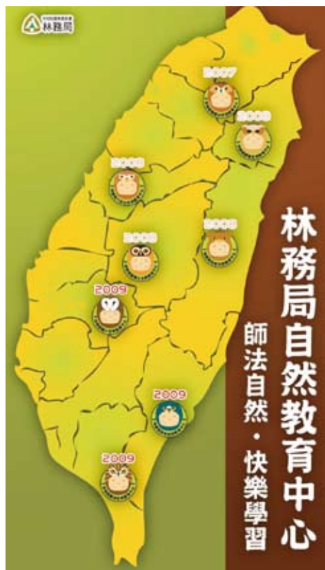
圖2 林務局自然教育中心分布圖