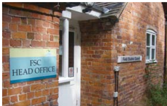
圖8 英國田野學習協會總部

英國田野學習協會是一個環境教育民間機構，致力於幫助人們了解自然並從自然中心獲得啟發，每年有許多學生透過FSC規劃的野外