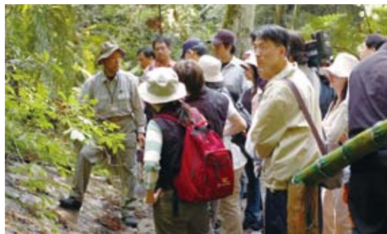
圖7 環境解說—由國家森林志工帶領民眾認識海相沉積等地質景觀

3.課程方案優化發展與成效評量：林務局自然教育中心的發展，希望提供學校及一般大眾專業的環境教育課程，為使國人對森林環境及森林經營有整體性認識，刻積極發展「森林環境教育課程模組」，納入森林環境題材(如森林生態與功能、森林經營與技術、森