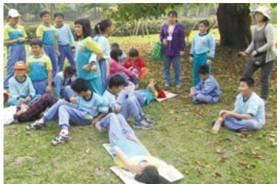
圖3 戶外教學—配合九年一貫課綱發展之方案，圖為學生扮演樹的不同構造，組成一棵大樹。