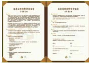
圖10-2 合作備忘錄(中文)