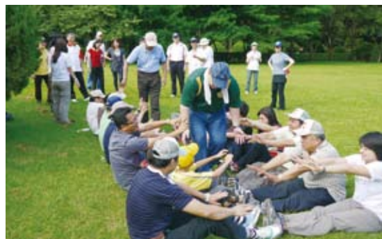
圖5 專業研習－無痕山林研習營讓學員體驗植物的感覺

中心人員需具備森林經營及自然保育、環境教育，與現場教學、行政管理、場域經營或營造等專業能力，未來需依據各類別人員應具備之專業知能規劃課程，建立完整之專業發展課程架構及訓練制度，持續培養與提升中心人員專業知能。目前，中心經營管理人員多由林務局工作同仁擔任，惟林務局工作同仁職務並非永不異動，相關經營管理業務經驗需逐時彙整紀錄，建置經營管理知識庫及管理資訊系統，俾有效傳承經驗。至中心現場教學人力部分，為期自然教育中心課程發展得有效結合學校正規教學課程，相關專業人力之培養與網羅，除積極網羅具現場教學之專業人力或與專業團體合作，負責中心課程方案規劃、執行、評估與資料蒐集等工作外，亦應研議從制度面來調整教學人力之進用；此外並配合培育環境教育現場教學專業人才，招募喜愛自然、關心環境議題之大專院校畢業生，提供環境溝通、環境解說、環境教育、生態保育、森林生態與經營、環境永續等再學習機會，輔以中心課程發展與執行、經營管理等實務訓