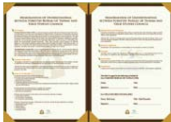
圖10-3 合作備忘錄(英文)

調查課程規劃、課程方案評鑑等方向，以提升林務局自然教育中心現場教學品質、現場管理人員之營運與應變能力、環教教師課程發展與教學技巧之能力。