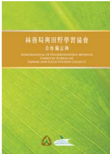
圖10-1 合作備忘錄封面