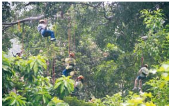
圖4 主題活動—邀請民眾一同體驗爬樹的樂趣

人類依賴自然界來滿足基本需求，包括空氣、水、食物、能源及棲息地；而研究指出，與自然環境、生物及生態系接觸，對於人類身心健康的發展也相當重要，特別是有助於形成健康的自我概念。根據心理學家觀察，不論成年人還是孩童在生態環境中發展身心，均有助於他們認識自己與非人類世界的關係，並從中受益。身處地球環境劇烈變動的時代，人類社會也隨之變動；全球化、人口發展及氣候變遷三大發展趨勢，共同且相互交疊著產生作用，帶給世界極大的改變，造成人類社會如人口、靈魂、時間、能源、權力、土地、水的環境短