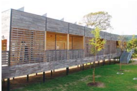
圖10 馬格探索中心外觀，設計概念為綠建築減少對環境的衝擊。