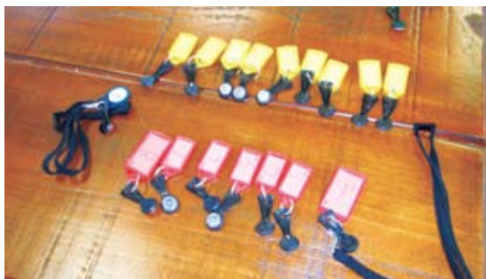
圖4 住宿區的通道均設有電子門鎖，只有擁有該區房間電子鑰匙的房客才能打開，此設計可區隔同一晚來自不同團體的房客。