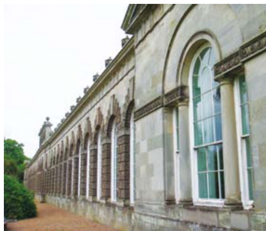
圖12 18世紀遺留下來的美麗橘園，可供歷史學家與文化學家進行研究及調查。