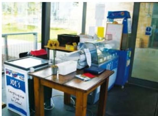
圖2 中心的咖啡館是目前FSC18個中心唯一提供對外餐飲服務的據點，提供簡餐、冰淇淋及飲料等，部分食材來自公平交易產品。