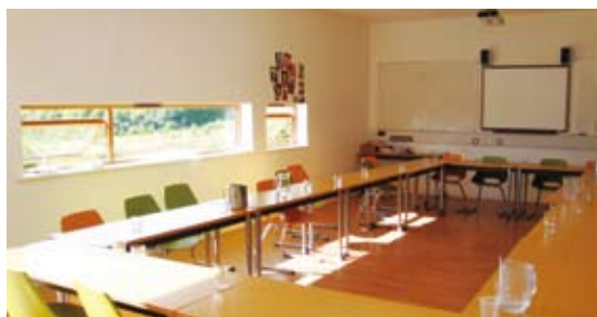
圖7 馬格探索中心教室共有4間，教室桌子與椅子都採用可移動式的方式，增加課程使用與小組討論的彈性。