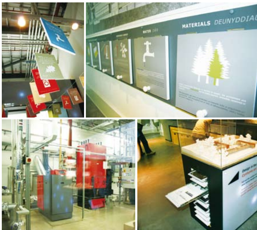
圖13 馬格探索中心低碳足跡建築物內，也設計室內的展示，來傳達低碳節能的訊息給觀眾。