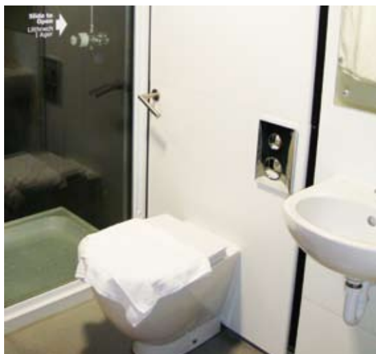
圖6 馬格探索中心在衛浴設備方面，考量孩童與年長者的使用，將洗手台與馬桶高度作適度的調整。