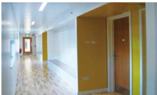
圖5 馬格探索中心住宿設施有34間房間，共130個床位，分別位於4個住宿區，房間內照明多為感應式設計。

(2)餐飲設施：中心的咖啡館在2009年的暑假才開始營業，目前是FSC轄下唯一提供對外餐飲服務的據點。在此提供簡餐、冰淇淋及飲料等，部分食材來自公平交易產品。