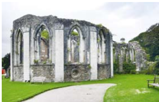
圖11 馬格探索中心位於英國馬格公園內，具有豐富的人文史蹟如12世紀的天主教修道院遺址。

課程服務。在學校的選擇上，以馬格探索中心向外30公里的區域範圍內，總數約100所左右的學校中挑選出38所提供服務。除了這固定的38所學校，客群尚包括其他來自全英國的學校團體。