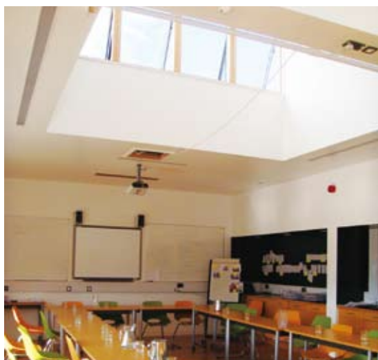
圖8 馬格探索中心教室空間設計以自然採光與通風的方式，增加室內明亮度與舒適性，減少能源的使用。