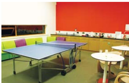
圖9 英國FSC自然中心基本上都設有學生休息室，提供學生空閒時間交流的空間。

地方政府所擁有的是資金與經營模式，FSC有的是環境教育的專業，透過雙方合作聯盟的簽訂，FSC除了繳交廉價的租金予地方政府，地方政府也會提供FSC一年23萬英鎊的課程營運費，藉由FSC的專業提供當地38間學校住宿型