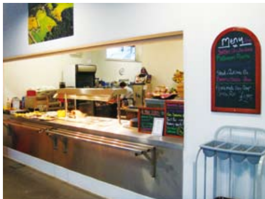
圖1 中心的餐飲服務採用開放半自助的方式領取餐點。