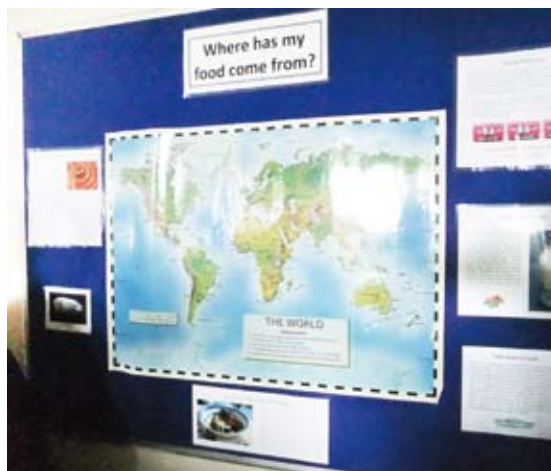
圖5 立於餐廳的食物里程展示