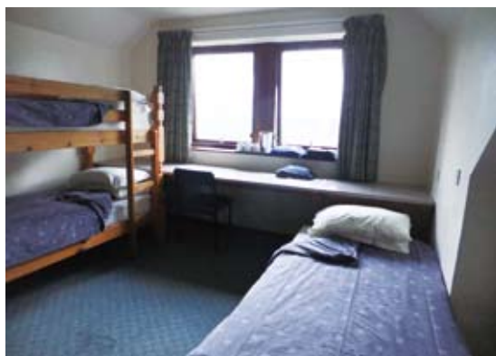
圖6 布倫卡思田野中心的住宿空間