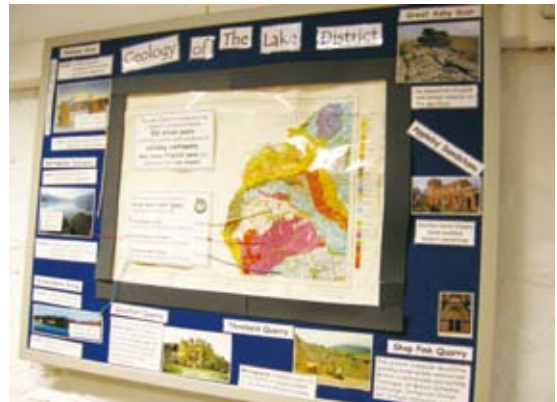
圖10 湖區國家公園的地理資訊展示