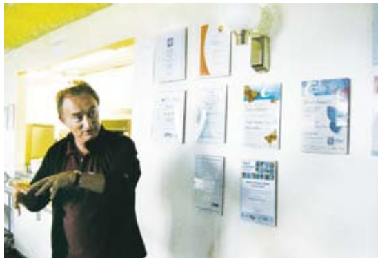
圖8 展示布倫卡思田野中心的得獎紀錄