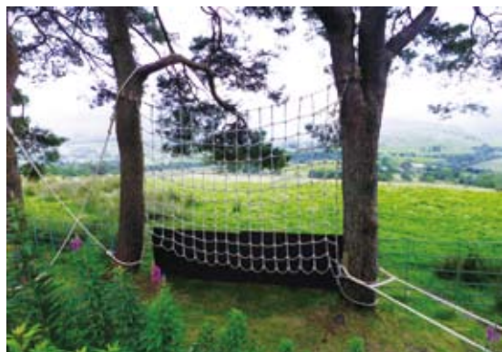
圖15 低空體驗教育設施

維持著良好的互動關係。在當地社區的網頁 ( http://www.threlkeldweb.co.uk )上設置了布倫卡思拉田野中心的連結，並且定期更新該中心的新聞狀況。