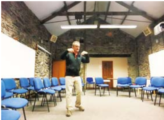
圖11 傳統建物改造而成的教室