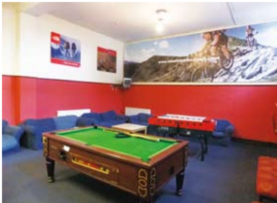
圖9 布倫卡思田野中心的遊戲間