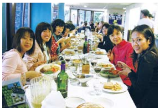
圖16 布倫卡思田野中心的餐廳

言，政府部門及民間團體可相互合作，創造出更多元化環境學習的機會與場所，並開發具特色的科學性以及體驗式的教育課程，提供不同年齡層參與，也可思考中心課程收費的可能性，以為中心永續性的營運。