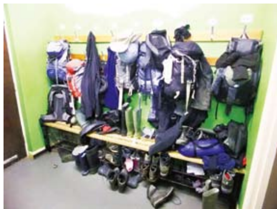
圖7 乾燥間是收納戶外教學衣物的空間