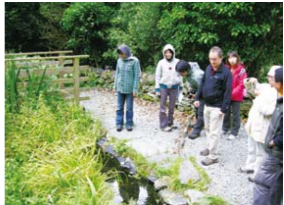
圖12 布倫卡思田野中心的生態池