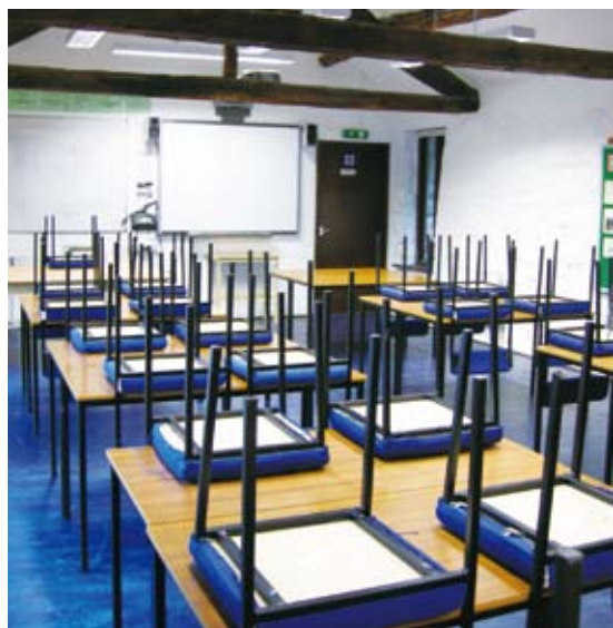
圖13 布倫卡思田野中心的教室