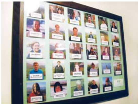
圖2 中心工作人員照片