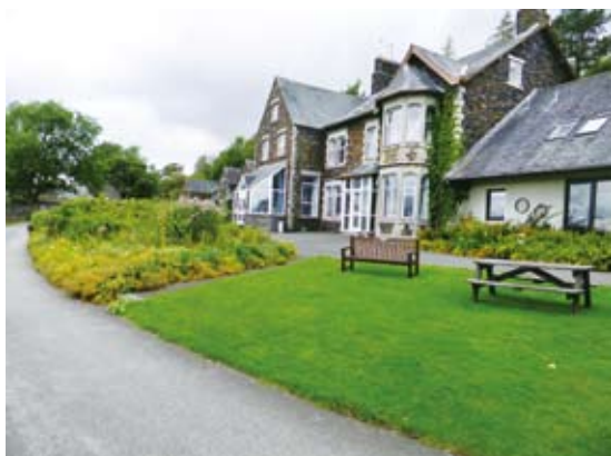
圖1 布倫卡思拉田野中心

布倫卡思拉田野中心共有6間教室、4間視聽教室，尚提供圖書室、學生休息室、教師休息室等空間。中心課桌椅使用銀行廢棄的廢材改裝或購買政府機關不用的椅子，以降低開銷成本，一般約120英鎊才可購買的椅子，可用低價5英鎊買入。其中，教室均提供互動式多媒體白板、無線上網等功能，電腦教室則提供50部筆記型電腦設備。娛樂設施提供籃球、排球和戶外野餐區，休息室以及有執照的吧檯。建物的建材使用在地石頭，以英格蘭的舊牆石砌法