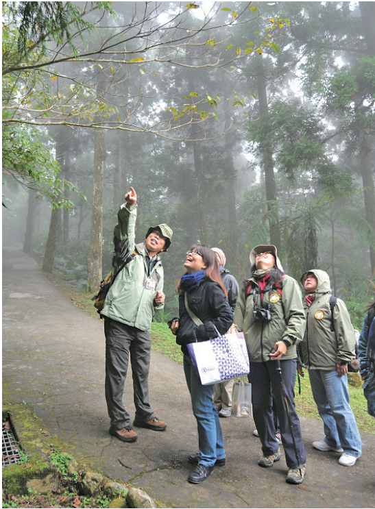
圖1 林務局透過自然教育中心的活動方案，創造自然與人的和諧關係，促成公共參與及夥伴關係。