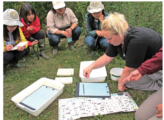
圖3 FSC以科學調查課程傳達友善環境態度，並監測環境變化。

FSC的環境教育課程著重科學調查方案，廣泛運用鄰近的國家公園、保護留區、環境信託地等，除了培養學習者自主學習與科學研究的精神與素養，同時傳達友善環境的態度，且教學者的觀察以及學習者的調查結果，等同於對該環境的監測，再透過與世界各國策略聯盟單位的資訊交換，取得全球各區域的環境變遷累積資料，形成跨域的環境行動網絡(圖3)。