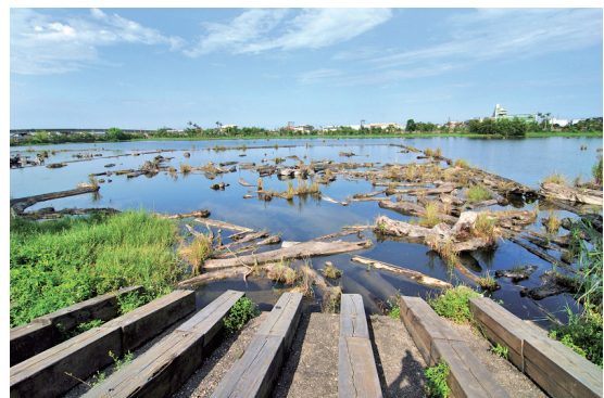
圖2 自然教育中心是台灣森林環境教育資源之整合與提供平台，傳達林業永續經營的目標。

這個平台提供學生到當地居民，乃至社會大眾和決策者等不同實施對象、情境，透過正規、非正規、非正式的學習，以不同操作模