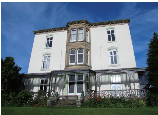
圖4 FSC的硬體需求以購買歷史建築或運用閒置空間為主，促成人文與自然資產的保存。

自然文化資產的保存是英國社會的主流意識，透過政府部門的法規與政策，以及民間、第三部門的實質行動，百年來已經創造出「自然文化資產全民共管」的公民行動。FSC活化、再利用舊建物的原則，以及教學延伸場域的未來管理模式，我們可以借鏡的是，無論是直接的場域經營，或是透過教學方案引發的價值澄清，應是同步思考、不可相互脫鉤的配套措施，並使之成為管理現有及未來自然與人文資源的策略(圖4)。