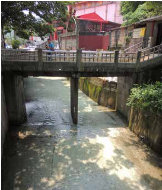
▲圖6、石頭公廟前水道 白色「水泉花」景觀。

目前為水堤渠道，但於日治時期，附近有「高雄溫泉」之歷史紀錄，此地區全年有湧泉流出，該地也出現白色「水泉花」景觀，「水泉花」為含有生活於含硫水域之細菌、真菌及古菌之生物組成，水泉花也具有經濟價值，可利用以製造溫泉粉及肥皂等商品。