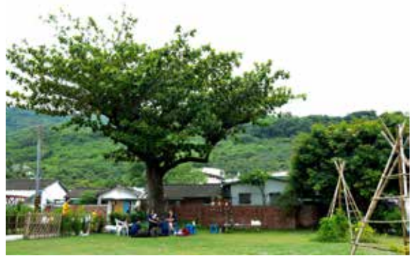
▲圖9、整理及綠美化後之「牛奶館」現況圖