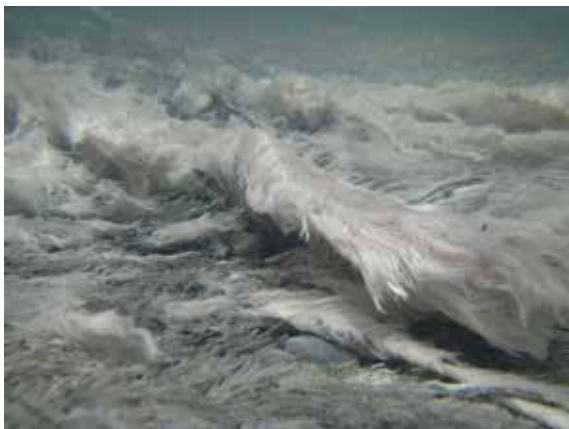
▲圖7、水中拍攝「水泉花」圖