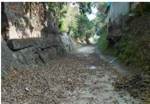
▲圖2、柴山渠道枯水期現況

具有歷史價值的咾咕石渠道，渠道一邊是自強新村日式建築群，另一邊是柴山自然石灰岩石壁，上方樹木形成綠色隧道，雨季有湧泉，乾季有石壁及渠道兩側花木可以欣賞。