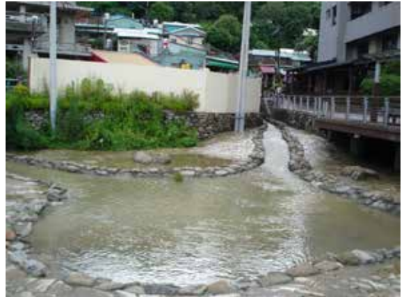
▲圖3、「龍巖冽泉」現況，未來將規劃為減少水泥化且可提供民眾安全戲水之親水空間。

規劃為可治水、教育及親水體驗的湧泉示範區，出水時，水體乾淨清澈，可延續居民記憶及提供民眾觀光休閒與教育場地。