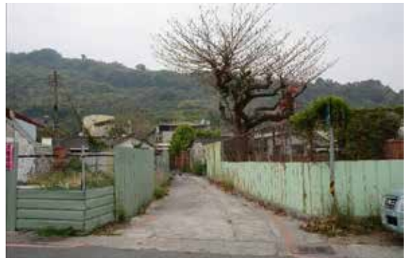
▲圖8、未整理及綠美化之「牛奶館」空地圖。

為日治時期高雄牧場所在地，曾引湧泉水以保鮮乳品，部分廳舍拆除後成為閒置髒亂空地，經柴山會整理及綠美化後，現已成為環境教育場地及休憩景點，未來可規劃風格店鋪、湧泉故事館，及輔助發展地方文創及湧泉相關經濟的產業空間。