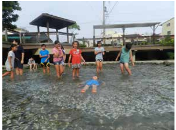
▲圖4、民眾與兒童於龍巖冽泉親水及戲水