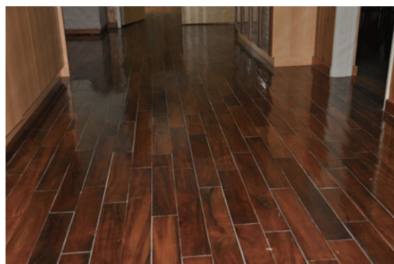
▲相思樹木材加工作成地板，兼具美觀及耐用的特色。