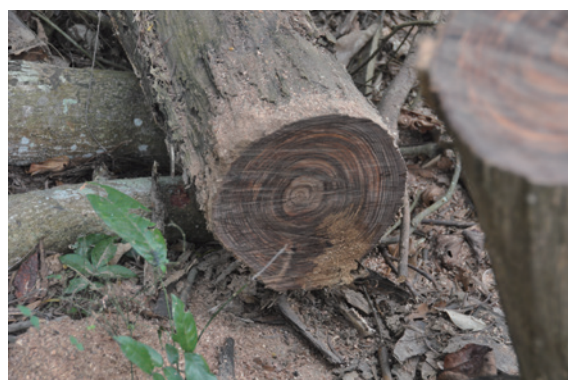
▲相思樹橫斷面色澤深且黑，號稱臺灣黑檀

儘管如此，目前市場用途計有：家具用材、單板用材、地板用材、藝術品、菇蕈用材及生質燃料，是極具潛力的經濟樹種。2013 年以來 30 公分直徑以上原木叫價每公噸 6,000 元，50 公分直徑以上甚至叫價每公噸 10,000 元以上，價格節節上揚。此外，相思樹也有非木材利用的潛力。近年來，臺灣大學森林環境暨資源學系研究團隊證實，相思樹心材抽出物具有極佳的抗氧化活性，心材抽出物之超氧自由基清除能力亦較兒茶素為佳，研究結果亦證實相思樹樹皮、葉子、嫩枝及花等部位抽出物均具有良好的抗氧化能力。於相思樹嫩枝抽出物酸水解確實可切斷糖苷鍵結釋放出配糖基，進而提升抽出物之抗氧化能力及抑制黃嘌呤氧化酶活性。細枝、枝條的二次代謝物及其成分，即可能取代安樂普利諾，應用於預防或治療痛風、尿酸及腎結石等疾病，有開發成保健食品或醫療藥品之潛力。