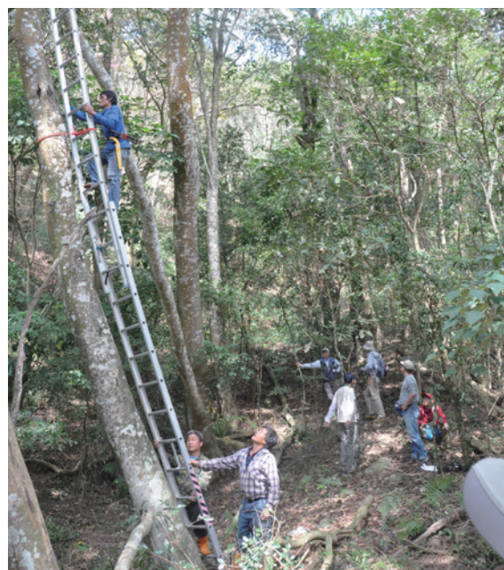
▲相思樹母樹野外採穗作業