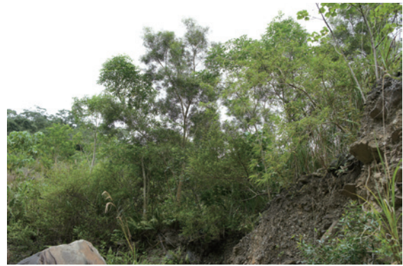
▲相思樹於崩場地復育快速恢復植生覆蓋

用於崩場地復育等需快速恢復植生覆蓋的地區，以相思樹種子進行撒播，初期綠覆蓋效果甚佳。