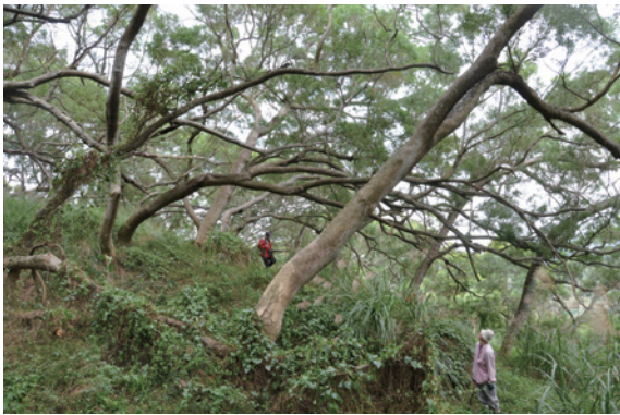
▲相思樹樹幹常呈現彎曲、分岔的形狀

區)，在阿里山公路海拔約 1,000 公尺亦有見 8 月份枝頭掛滿黃花的相思樹，甚為耀眼。果實為扁平長橢圓形莢果，約長 5 至 8 公分，表面平滑，成熟時呈黑褐色，果莢內藏扁圓形直徑 0.3 至 0.5 公分之種子 5 至 8 粒，黑褐色，有光澤，種皮厚。