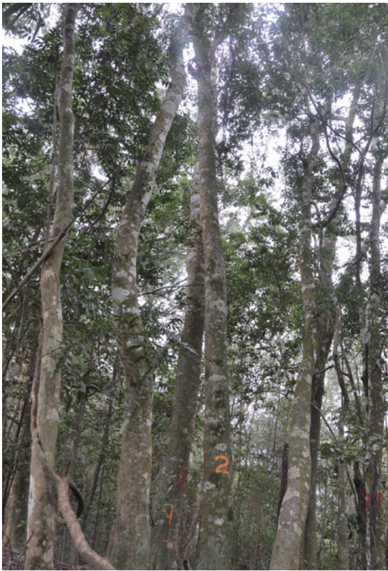
▲優良母樹主幹通直圓滿，側枝分岔高度大於全樹高之二分之一，顛覆一般人對相思樹的印象

目前已標訂形質優良母樹 178 株，主要分布於林務局臺東、屏東、嘉義及新竹林管處之林班地。而野外調查資料顯示，在臺東地區胸高直徑最大達 96.5 公分；在大埔事業區優良母樹生長的林分，海拔可達 1,040 公尺，優良形質母樹枝下高最高者達 15.7 公尺，而樹高最高者可達 30.8 公尺。這些母樹均屬主幹通直圓滿，分岔少，胸徑大，顛覆了一般人對相思樹的印象，也讓我們對此母樹選拔及種子園建立計畫充滿信心。相思樹在臺灣造林歷史久遠，全臺不乏散見之優良形質母樹，這些形質優良母樹，極適合後續育林技術之開發。