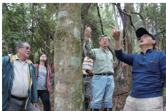
▲研究團隊觀察相思樹母樹生理生態