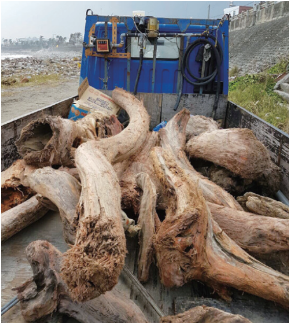
▲查獲之小貨車上皆為珍貴紅檜