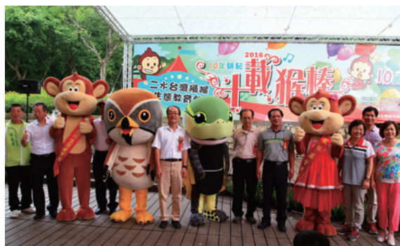
▲二水臺灣獼猴生態教育館10週年慶，現場還邀來中部地區重要的保育動物（食蛇龜、灰面鵟）人偶一起參加這場活動。

南投林區管理處為慶祝「二水臺灣獼猴生態教育館」成立10週年，在8月6日生日慶當天在該館舉行「十載猴棒—保育公益森林園遊會」，同時特別邀請許多企業、國內著名保育團體及弱勢團體一起嘗試以不用電及火方式擺攤，力行保育與公益，現場吸引2,000人次參與。（南投林區管理處 簡盈宜）