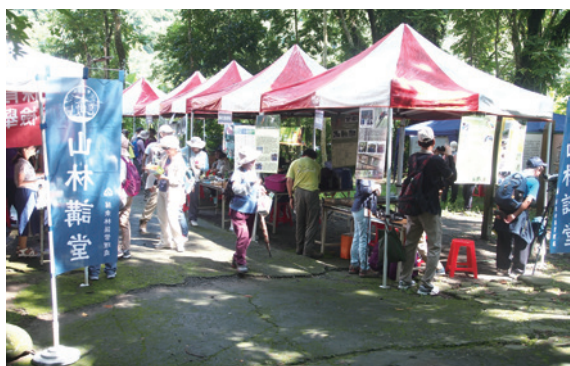
▲民眾熱情參與山林講堂系列活動（攝影／屏東林區管理處 洪國棟）

動，邀請雲林湖本生態合作社陳嘉宏老師分享社區參與保護稀有鳥類八色鳥之經驗，並邀請高雄市政府警察局講授如何運用「警政服務App」，讓大家都能夠成為森林的守護者。（屏東林區管理處 洪國棟）