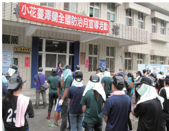
▲宣誓剷除小花蔓澤蘭

除小花蔓澤蘭，合計250餘公斤，捍衛社區及實驗林場周遭的森林不受小花蔓澤蘭的威脅，打造健康的森林。（嘉義林區管理處 趙賢玉）