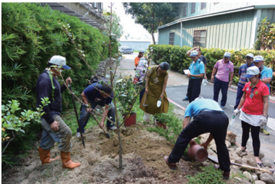
▲南投林管處利用林管處旁空地進行綠美化教學

南投林區管理處 8 月 31 日在林管處三樓禮堂辦理社區綠美化研習。本次課程除南投處同仁宣導「綠美化業務」外，另由七星環境綠化基金會講授「綠美化規劃法則及示範點規畫及操作說明」、「植栽選擇應用與維護管理」、「綠化案例分享」、「示範點實務操作」，並進行實地操作，共有彰雲投等中部縣市社區發展協會幹部及 NGO 組織人員約 60 人參與，研習圓滿順利！（南投林區管理處 簡盈宜）