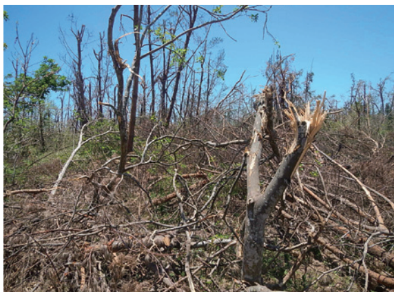
▲風災後，森林公園裡造林木樹枝倒折散布林地。

尼伯特颱風狂掃臺東，深具森林意象的臺東森林公園受災嚴重，據臺東林管處調查，森林公園裡的造林地上，20年生以上木麻黃有80%風折傾倒，負責造林及林木撫育工作的臺東林管處，將於9月10日起，針對受災的60公頃造林地內的殘材進行清理工作，預計在11月以前花費800萬元完成清理工作，並在106年初開始重新造林。（臺東林區管理處 林素夷）