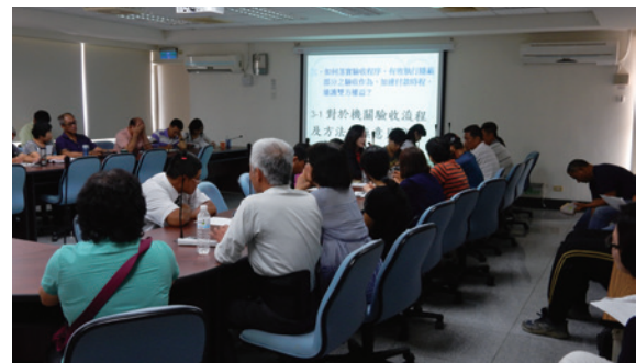
▲「105年度企業誠信－廠商政風座談會」，邀請臺東地檢署檢察官周文如蒞臨演講。

臺東林區管理處為倡導企業誠信，加強與廠商溝通，提升採購效能與品質，於8月3日於該處召開「105年度企業誠信－廠商政風座談會」，邀請臺東地檢署檢察官周文如蒞臨演講，暢談參與政府採購廠商及機關辦理採購業務人員應注意之法律責任，提醒廠商務必謹守誠信原則正派經營，以免觸犯政府採購法及其他相關法律。（臺東林區管理處 吳合興）