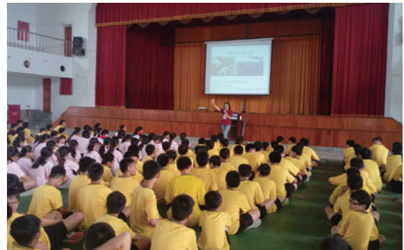
▲森情講座至民雄國中宣導台灣之美及愛林保林觀念

場次以上宣導，由林管處人員引導，透過互動式學習過程讓學生了解森林資源之重要性，向下扎根，培養學生具備愛林、護林、保林觀念。為加深、加廣宣導內涵，105 年度委託社團法人中華民國荒野保護協會擴大試辦，30 日於民雄國中以「森情講座」方式，將愛林觀念再拓展至國、高中，藉由欣賞生態環境之美，認識山林生態多樣性及目前山林面臨的危機，進而啟發學生從自身做起的愛林觀念，從而身體力行。（嘉義林區管理處 陳虹余）