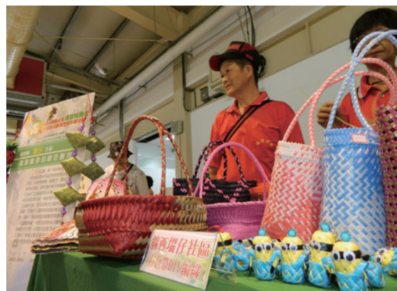
▲線西鄉塭仔社區憑著居民的毅力，將廢棄魚池及豬舍綠美化為公園，分別於 101 及 103 年獲選綠美化模範社區。