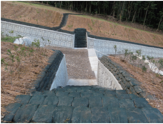
▲南投林區管理處設計橫向供山豬通行之生態廊道