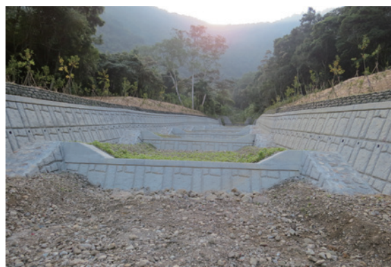
▲南投林區管理處辦理「魚池鄉白石牙野溪整治工程」時，發揮巧思於固床工高差處兩側，設置縱向供蛙類及爬蟲類通行之斜坡。（攝影／南投林區管理處 張凱博）

南投林區管理處為維護自然生態環境及生態系統功能，減少工程整治對生態造成的影響，今年於魚池鄉九族文化村旁野溪辦理工程時，在確保工程效益及安全前提下，設計友善的生態通道，包含橫向供山豬通行之生態廊道及縱向供蛙類及爬蟲類通行之高差通行方塊，生態友善的設施，讓工程對環境的干擾降至最低，也讓該區野生動物於整治後依然可於該區無礙通行，多一份生態考量，讓治山防洪工程與生態保育更為融合。（南投林區管理處 張凱博）