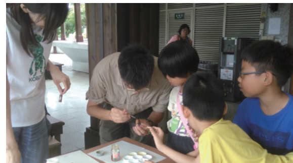
▲自然素材DIY「樟樹小飾品」

池南國家森林遊樂區位於花蓮近郊、坐擁湖光山色，區內處處綠意盎然、鳥語啁啾，近年來更積極增設無障礙通用設施，益加適合老少出遊探訪。花蓮林區管理處特選暑假期間，推出 3 梯次適合親子同行的體驗活動「池南國家森林遊樂區陪您 fun 暑假－森林・繪本・DIY」，邀請童心未泯的大朋友、小朋友一起激發對於森林美學的想像、省思生態保育的重要性。（花蓮林區管理處 陳佳玫）