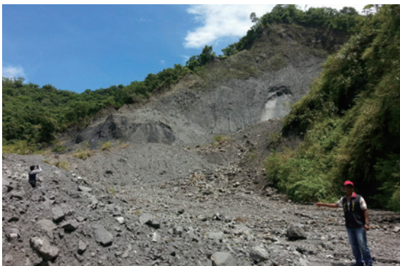
▲臺東處成功站同仁前往馬武窟溪堰塞湖現場會勘

8月1日傍晚，經民眾臉書反應，位於東河鄉泰源地區，毗鄰國有林班地的原住民保留地範圍內，發現一處堰塞湖。8月2日上午，東河鄉公所、臺東林管處及水保局臺東分局均派員前往現場會勘，初步確認在東河鄉泰源村南溪地區五塊厝至七塊厝間的馬武窟溪河段，發現山壁崩落，數萬土方之土石堆積於溪床中，形成堰塞湖，溪水經土石缺口持續流出，堰塞湖面積約1公頃。臺東林管處立即派員以UAV無人載具前往空拍，於空拍完成後提供相關資料，並與東河鄉公所與水保局臺東分局密切聯繫研商處理辦法，且持續嚴密監測。（臺東林區管理處 林素夷）