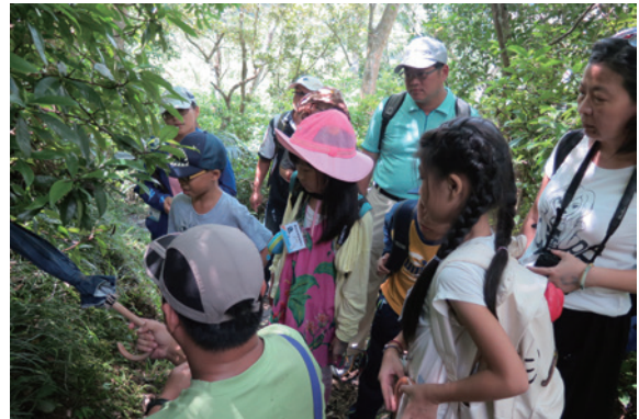
▲參加民眾觀察穿山甲居住的生態環境

屏東林區管理處 24 日在雙流國家森林遊樂區舉辦一場「害羞的鐵甲武士」主題活動，帶領民眾認識充滿神秘色彩的鐵甲武士－穿山甲。世界上的穿山甲共有 8 種，分布在非洲及亞洲的熱帶與亞熱帶地區，非洲 4 種，亞洲有 4 種，在臺灣的穿山甲是臺灣特有亞種也是珍貴稀有野生動物。活動首先由環教教師導讀繪本，讓大家認識穿山甲在原住民裡流傳的故事及介紹穿山甲的生態習性，並教民眾如何用輕黏土創作獨具一格的穿山甲作品，最後帶大家進入雙流森林，一窺穿山甲居住的自然生態。（屏東林區管理處 吳欣瑾）