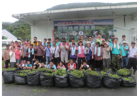
▲小花蔓澤蘭活動圓滿結束

屏東林區管理處 3 日在屏東縣滿州鄉里德社區舉辦小花蔓澤蘭防治宣導活動，在百位的民眾熱情參與及支持，當日移除了 300 公斤的小花蔓澤蘭。活動現場除了有入侵物種習性及防治方法的介紹之外，宣導攤位的互動遊戲更是受到大小朋友歡迎，在遊戲中學習到自然保育及林務工作的相關知識。活動最後更贈送桂花、七里香及羅漢松等樹苗，希望民眾將綠意栽植在居家周圍，建構自然的綠色家園環境，並共同努力防除外來入侵植物，打造無蔓森活淨土。（屏東林區管理處 黃淑清）