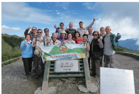
▲東勢林業文化園區解說志工隊戶外研習至石門山攻頂合影

使東勢林業文化園區志工隊專業解說知識涵養充實而滿載而歸，並希望能運用在不同解說導覽的場域之中，成為全方位的解說志工。（東勢林區管理處 劉惠宜）