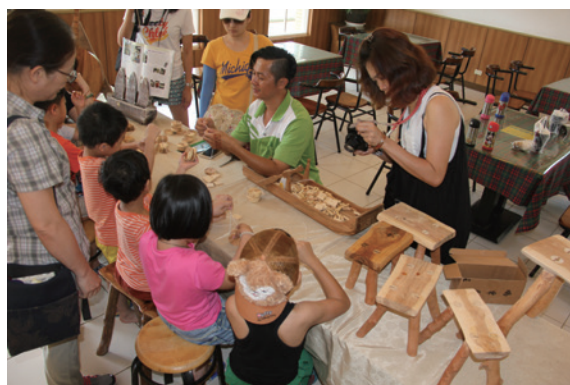
▲自己動手做溜溜球

發與利用，一起打造屬於臺灣的木工村。屏東林區管理處期望透過這此活動，讓大家瞭解在日常生活中，也能輕鬆的為保護森林盡一份力。（屏東林區管理處 林瑾婷）