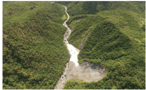
▲臺東處成功站同仁前往馬武窟溪堰塞湖現場會勘