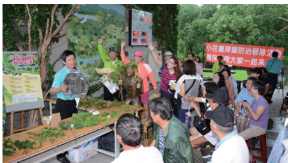
▲林後四林小花蔓澤蘭防治暨收購宣導活動在社區民眾熱情參與下順利完成（攝影／屏東林區管理處 許文鄉）

動手參與小花蔓澤蘭的移除，屏東林管處希望藉由宣導及收購活動，讓民眾能認識外來入侵種的可怕及防治方法，讓大地恢復原有自然之美麗生態。（屏東林區管理處 吳秋燕）