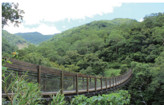
▲從沿山步道上的吊橋可以觀賞樹冠生態

為了提供遊客更好的遊憩環境，雙流國家森林遊樂區瀑布步道後段自即日起至翌（106）年1月28日將開始進行瀑布步道橋樑及設施整修工程，屏東林區管理處考量遊客安全，將封閉該段步道禁止遊客進入，施工期間入園門票一律半票優惠。（屏東林區管理處 吳欣瑾）