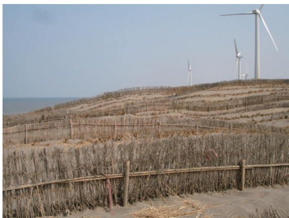
▲照片2、堆砂籬、插植稻草併用。

砂埋、萌蘖性強、生長迅速等特性，達到快速覆蓋且減低地表風速之效果，常用植物有貓鼠刺、蔓荊或馬鞍藤等地被植物（詳如照片 2、3）。