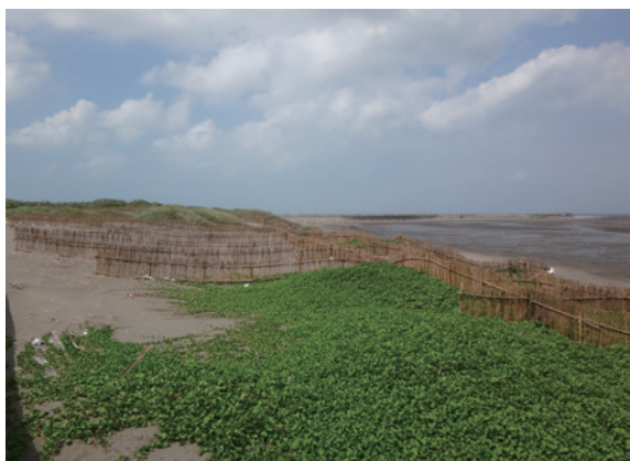
▲照片3、堆砂籬內馬鞍藤自行蔓生