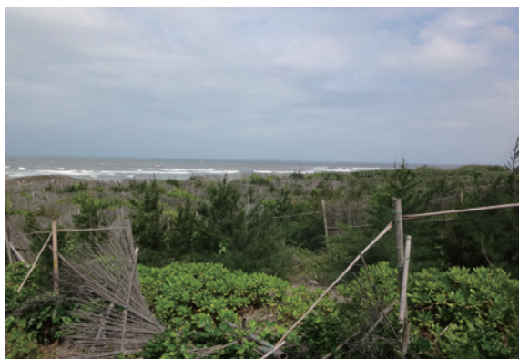
▲照片 5、營造複層林相取代老化木麻黃發揮防風保安功效