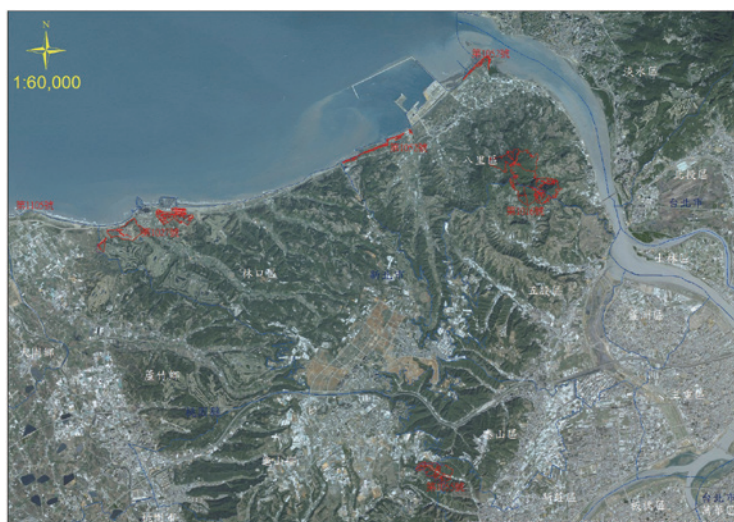
◀圖1、新北市境內區外保安林位置圖