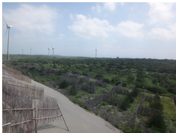
▲照片4、營造複層林相兼顧防風及景觀效益

桐、白千層、臺灣海棗及小葉南洋杉等樹種，以營造複層林相兼顧防風及景觀效益（詳如照片 4）。