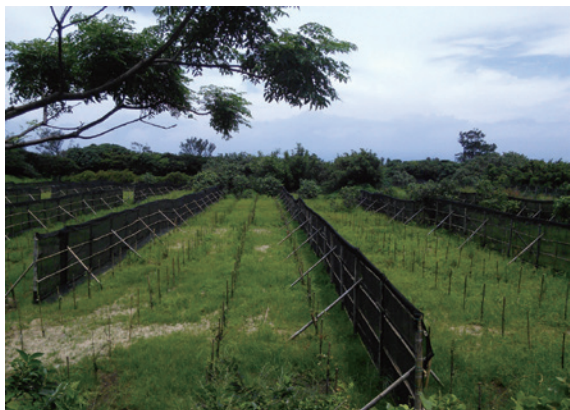
▲照片8、造林地內設置高度2公尺防風網來因應環境因子的變化。

至 1,200 公尺，透風度以 50% 至 60% 最適宜，其施作數量得視林地實際需要調整之（詳如照片 8）。