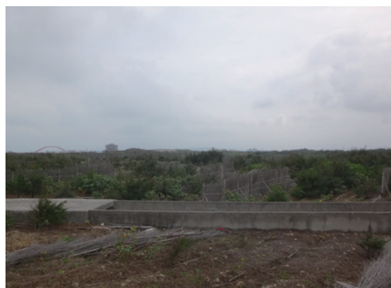
▲照片 7、適地適木營造多樹種混交複層林相

北部地區造林栽植季節大多在每年 1 至 3 月份，海岸地區造林新植苗木株數均較一般區域林地高，每公頃約 4,000 至 5,000 株，採密植方式，適地適木營造多樹種混交複層林相，特別是迎風面區域，可增加林木存活率及抗風性；另林木栽植後，如因天然災害以致生長不佳，造成林木成活率低則應儘速進行補植作業，補植率通常為 30%，依立地環境、苗木生長狀況不一，經由補植及各項撫育工作，俾利早日成林，發揮海岸林功效（詳如照片 7）。