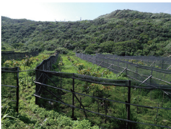
▲照片 6、開溝築堤整地作業，將林木栽植於土堤上。

苗栗縣通霄鎮地勢較低窪且排水不佳，容易長期積水不退之情況，包括雨水及少部份的海水，土壤鹽漬化也往往較高，致使林木長期浸水而影響生長甚至死亡，故藉由開溝築堤整地作業，將林木栽植於土堤上，並選擇較耐淹水樹種，如白千層、木麻黃等樹種，一方面提高植列栽植高度，縮短或避免林木浸水時間，另一則可藉由天然降雨來改善植列土壤鹽化度，提高造林木成活率（詳如照片 6）。