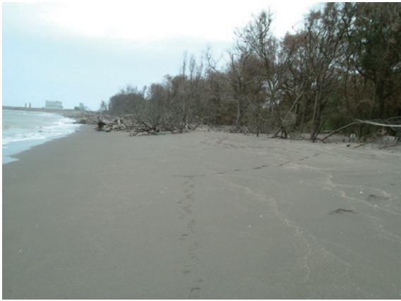
▲照片1、海岸木麻黃防風林遭（突堤效應）海水冲刷淘空等危害