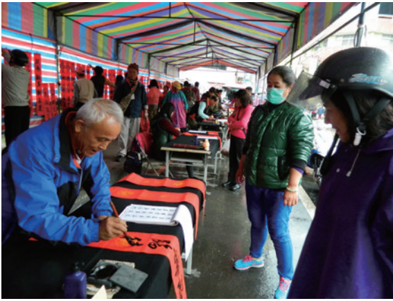
▲南投林管處在水里民族橋上舉行贈春聯活動