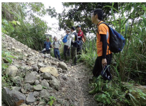
▲南投林區管理處與臺大實驗林管處深入山區執行查緝盜伐巡視

為展現合作打擊山老鼠的決心，南投林區管理處與國立臺灣大學農學院實驗林管理處 1 日在信義鄉羅娜村亞杉坪林道及油杉崙林道執行聯合查緝盜伐巡視，並架設監視設備，監控林道動態，並配合警方不定時突擊巡查林道，讓不肖山老鼠無所遁形。（南投林區管理處 簡盈宜）