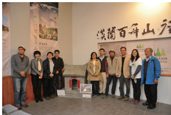
▲現場貴賓雲集，熱鬧開展。

淡蘭古道，是昔日北臺灣「淡水廳」（大臺北地區）至「噶瑪蘭廳」（宜蘭）之間，穿越山區交通路徑的概稱，隨著人們的拓墾與國家治理，逐漸發展成為綿密的路網系統，其範圍現今橫跨北北基宜4個行政區域。為重現淡蘭山徑間百年故事與風華史詩，羅東林管處特於羅東林業文化園區檢車庫進行為期8個月的「重現淡蘭百年山徑宜蘭&羅東雙城展」，並於12月10日熱鬧開展，參加民眾踴躍，共同見證羅東林管處在提升自然步道深度知識饗宴及推動步道生態旅遊上的用心，積極提升自然步道深度旅遊推廣，促進步道周遭社區部落之觀光產業。（羅東林區管處理 陳建忠）