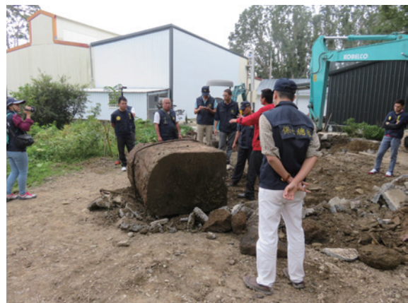
▲查獲將牛樟巨木以水泥掩蓋在地下

臺東林區管理處、保七總隊第九大隊臺東分隊、臺東縣警察局關山分局、花蓮憲兵隊等，於 13 日在臺東地檢署檢察官指揮下，大規模同步搜索臺東縣境內 10 處處所，偵破 1 起牛樟盜伐案並查獲牛樟菇培養場，起出巨大牛樟木塊、木藝品、紅檜漂流木及鏈鋸等作案工具，並將陳姓主嫌等 10 名犯嫌緝捕歸案。（警政署保安警察第七總隊第九大隊臺東分隊孫于陽）