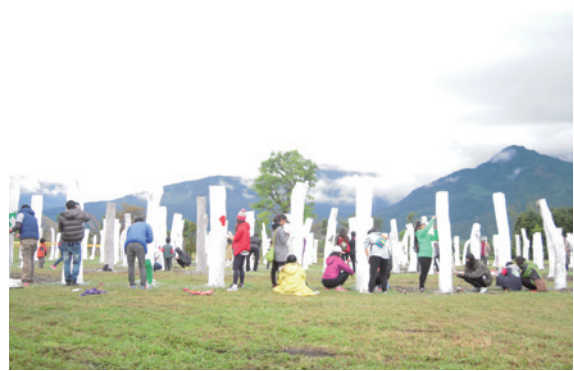
▲106年度第五屆生命寶樹更新彩繪全景（攝影／花蓮林區管理處 陳佳玫）

歲末年終、迎新送舊，花蓮林區管理處大農大富平地森林園區聯合在地的「花蓮縣環頸雉的家永續發展協會」，攜手辦理「第五屆生命寶樹彩繪更新活動—蛙鼓蟲吟辭舊歲鸞翔鳳集迎新春」，邀請國人一同前來為園區「生命寶樹」新年換新裝，創作新春限定、個人專屬的漂流木。每梯次開場由協會派員分享近年來「園區鳥類、兩棲類調查成果」，再以此為題，一同展開彩繪活動。完成彩繪後，由園區志工協助合影上傳 FB 分享，並致贈當日成人自行車體驗券。本年度不少遊客攜家帶眷、呼朋引伴參與彩繪，嶄新的「生命寶樹」就在一片片歡笑聲中亮麗重生。（花蓮林區管理處 陳佳玫）