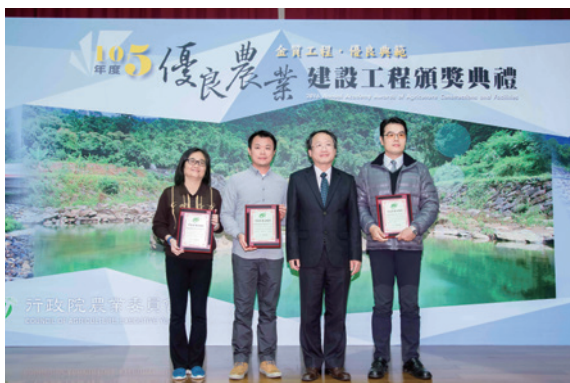
▲105 年度優良農建工程「多望溪河道瓶頸段整治工程」頒獎

羅東林區管理處在 104 ~ 105 年所辦理之「宜專一線改善工程」、「多望溪河道瓶頸段整治工程」、「宜專一線 5.1K 上邊坡崩塌地處理工程」、「太平山分歧點公廁整修工程」經林務局推薦參加行政院農業委員會「105 年度優良農建工程獎」評鑑，在全國上千件農業相關工程競爭角逐中，最終分別榮獲獎項如下：「宜專一線改善工程」農路林道類－優等獎、「多望溪河道瓶頸段整治工程」設施類－優等獎、「宜專一線 5.1K 上邊坡崩塌地處理工程」治山防災類－佳作獎、「太平山分歧點公廁整修工程」設施類－佳作獎。28 日由行政院農業委員會黃副主任委員金城等公開頒獎表揚，相當肯定羅東處對於落實公共工程品管及督導制度之用心及執行治山防災及森林育樂工程的努力表現。（羅東林區管處理 張家明）