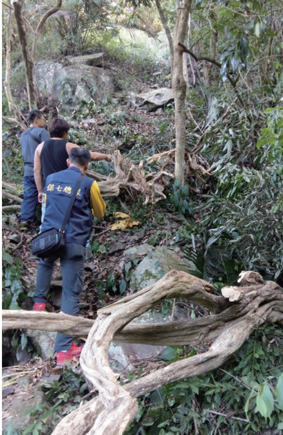
▲竊嫌盜挖七里香樹木被逮（攝影／南投林區管理處 陳長根）

4 株七里香樹木帶回水里工作站假植，並將全案移送法辦。（南投林區管理處 簡盈宜）