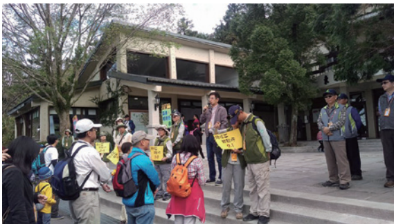
▲「本局71週年局慶－悠遊森林、體驗自然」環境教育研習林華慶局長致詞

本次活動係由林務局人事室會同森林育樂組、政風室及新竹林區管理處精心策劃，運用東眼山國家森林遊樂區豐富動植物生態環境及生痕化石區，規劃多條健康路線及適合親子共同體驗的定向越野活動等。活動現場另有政風室設置攤位，以有獎徵答方式宣導政風法令。當天氣候涼爽宜人，總計約有 200 人參加。（林務局 郭庭濤）