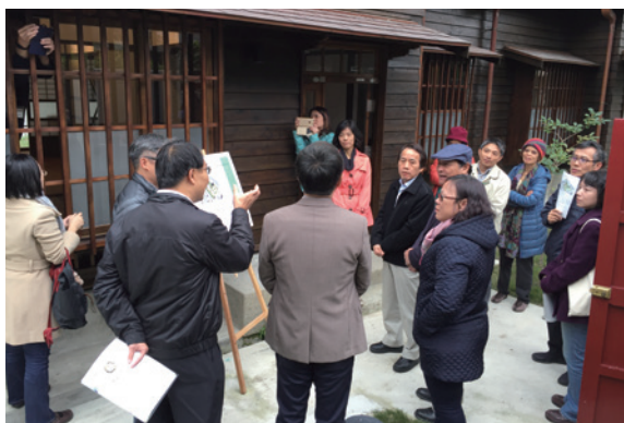
▲農委會主委視察本局經管金山南路日式宿舍古蹟群

行政院農業委員會曹主任委員及臺北市府林副市長於 1 月 24 日率員前往林務局臺北市金山南路日式宿舍古蹟群視察全區建物樣式及現況，並針對該區未來活化再利用方向提供寶貴建議。（林務局 劉兆蘭）