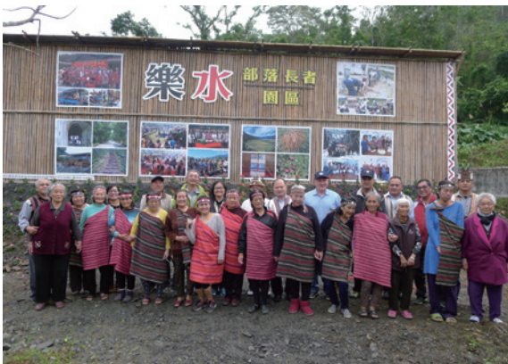
▲與部落長者開心合照（攝影／羅東林區管處理 黃愷茹）

位於大同鄉樂水部落的「門諾漾文化推展協會」，是羅東處太平山策略聯盟成員，參與管理處相關活動、提供原住民傳統技藝表演不遺餘力。105 年執行社區林業計畫，將樂水關懷站（舊瑪崙派出所）外空地，由部落成員 DIY 佈置為樂水長者園區及樂水部落生態教室，以柳杉及桂竹手做生態教育展示牆，並由社區綠美化計畫於周邊栽植綠籬及小喬木，更由羅東處所提供柳杉障礙木 6 根，作成「樂水部落生態教室」意象，以銘記羅東處與樂水部落友善合作、共榮共進的情誼。22 日協會邀請大家共同參與揭牌儀式。（羅東林區管處理 黃愷茹）