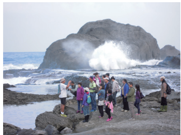
▲聯合溼地計畫的阿美族港口部落，推廣生態旅遊之自然觀察「分組探訪阿米斯冰箱」。（攝影／花蓮林區管理處 陳佳玫）

應用、品嚐在地風味美食。遊程巧妙結合秋冬豐富的生態資源與周邊部落文化，從白天到黑夜，陪同民眾一起體驗人與自然的感動連結，同時認識與海洋共生的智慧、活絡在地低碳產業、響應綠色節能生活。（花蓮林區管理處 陳佳玫）