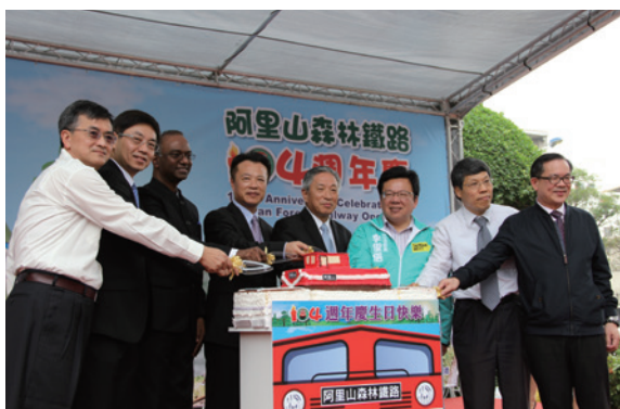
▲祝阿里山森林鐵路營運104週年生日快樂（由嘉義林區管理處提供）