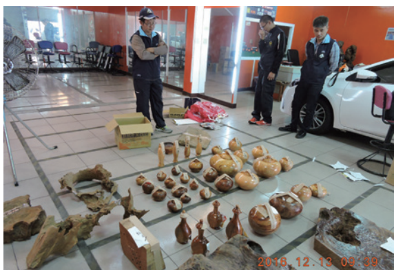
▲查獲大量牛樟段木、木藝品。