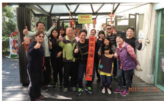
▲雞祥如意賀歲活動照片

為推廣獼猴保育，南投林區管理處 22 日於二水臺灣獼猴生態教育館，舉辦雞祥如意賀新春活動，鼓勵民眾攜帶 105 年 11、12 月或 106 年 1 月發票 5 張兌換春聯 1 副，並以粉絲打卡換朱槿方式，吸引活動參加者進入二水臺灣獼猴生態教育館粉絲團了解臺灣獼猴保育政策。（南投林區管理處 簡盈宜）