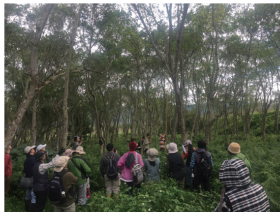
▲管理處同仁示範每木調查作業（攝影／花蓮林區管理處 利映儒）

為增進人工林各項功能並與在地社區及保育團體說明疏伐相關效益，花蓮林區管理處於 24 日在大農大富平地森林園區舉辦「森林健康有妙方－永續森林經營疏伐工作坊」，由林管處同仁帶領當地 NGO 組織及鄰近社區成員認識人工林疏伐與森林永續經營觀念，並讓民眾實際參與下層疏伐「選木」活動。經過本次活動，保育團體及民眾對疏伐工作多持正面看法，不只了解疏伐是符合「環境、社會、經濟」永續的森林作業，更理解林管處積極推動人工林疏伐工作的必要性。（花蓮林區管理處 利映儒）