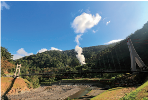
▲連結溫泉區與自然步道兩處的「多望吊橋」

颱風暴雨常會侵蝕河岸，發生災害之虞，因此進行整體治山防洪整治，鐵橋因而位移位置及整修，羅東處在 2016 年重啟修建，命名為多望吊橋，更將過去連結仁澤吊橋與鳩澤索道沿線的小徑以手作步道方式整理重現，並於同年 11 月陸續完成施作，藉由吊橋的引領看見人文與自然的風景，再次串起兩山谷間塵封的歷史記憶，昔日伐木時期的人聲鼎沸到今日提供民眾寓教娛樂的轉變。（羅東林區管處理 楊暄慧）