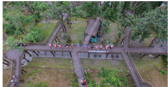
▲於如同葉脈的高空廊道－嬉遊林間進行森林走秀，別具特色。

臺東林區管理處於 11 日在知本國家森林遊樂區辦理別開生面的「2016 嬉遊森林走秀音樂會」。活動邀請臺東縣內卑南、阿美、魯凱、排灣及布農等五大原住民族群，共同攜手在園內高空廊道上進行林間走秀及展演。除了精彩的森林走秀外，現場還有在地小農在大樹圍繞的森林裡，以手作純粹的好食好物，帶你用鼻子、嘴巴親近自然的「森林好事集」。當天並有「樂秧舞集」、「杵音文化藝術團」二大傳藝金曲獎團隊、知本卑南族少女演出讚頌森林、魯凱族達魯瑪克部落的傳統服飾展演、排灣族北里部落的青年演出愛戀的傳統神話，最後由布農族桃源部落老中青三代演出守護山林的故事。以神話、歌謠及服飾展演與森林的親密關係，傳遞臺東多元族群文化價值。（臺東林區管理處 林孟怡）