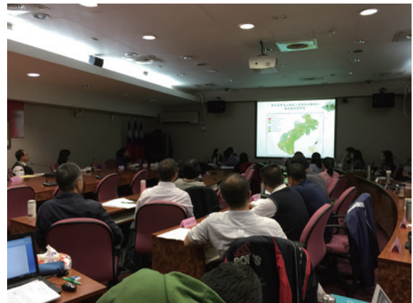
▲石虎保育工作坊邀集專家學者及民間團體探討石虎面臨威脅及可行措施

家學者、政府機關與保育團體，於 23 日辦理「石虎保育行動工作坊」，分享石虎現況、面臨威脅、各機關的努力及遭遇的困難，期討論各種行動方案之芻議，俾利後續邀請相關機關研擬可執行的措施以具體保育石虎。（林務局 許曉華）