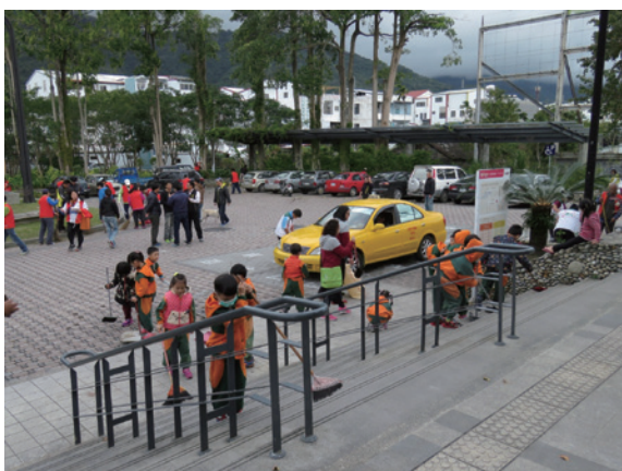
▲關山工作站同仁結合關山地方各單位，至關山火車站前進行清淨家園活動。