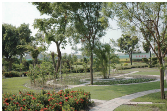
▲雲林縣二崙鄉崙西社區發展協會社區植樹綠美化營造社區公園，連續4年蟬連南投處之全國模範社區。

南投林區管理處辦理 105 年度社區綠美化補助計畫模範社區評選名單出爐，今年南投處所輔導之社區共有 42 個，其中雲林縣二崙鄉崙西社區發展協會連續 4 年蟬連南投處之全國模範社區，此外雲林縣口湖鄉蚵寮社區發展協會、彰化縣鹿港鎮洋厝社區發展協會、彰化縣田尾鄉新厝社區發展協會及彰化縣二林鎮趙甲社區發展協會則同為南投林區管理處模範社區，都有讓人驚豔的綠美化設計。（南投林區管理處 簡盈宜）