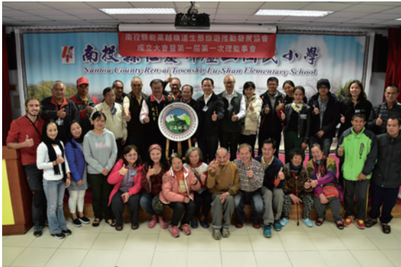
▲林務局推動的南投縣能高越嶺道生態旅遊推動發展協會 12月11日正式成立