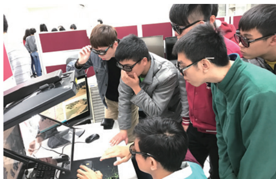
▲中興大學學生體驗立體觀測儀情形（攝影／農林航空測量所 蔡仲涵）

國立臺北大學不動產與城鄉環境學系及國立中興大學水土保持系為「航空測量學」課程需要，分別於 105 年 12 月 21 日及 106 年 1 月 4 日來所參訪，二校師生分別有 27 人及 18 人到訪，農航所為回應二校之殷切期望及滿足課程需求，除規劃機關簡介影片播放，讓師生初步了解農航所工作內容外，特別安排袖珍立體鏡及立體觀測儀之立體像對等森林資源調查設備體驗，讓課堂理論與實務結合，更加深同學們的學習印象。（農林航空測量所 蔡仲涵）