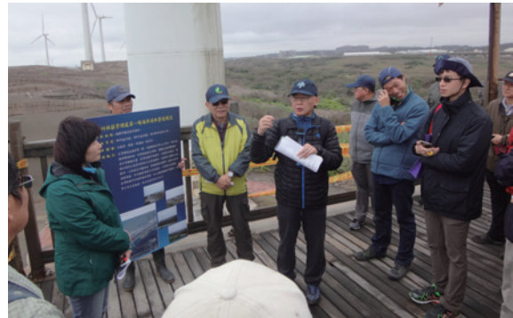
▲新竹林區管理處第一線海岸造林營造現況說明（攝影／新竹林區管理處 蔡乙源）

區漁會永安漁港會議室召開「海岸林學者專家會議」共同研討，並作成紀錄以供日後辦理海岸林造林各項編案之參據。（新竹林區管理處 蔡乙源）