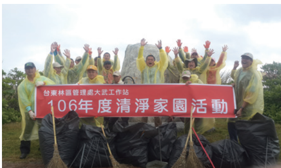
▲大武工作站同仁及地方村民，不畏風雨至大武海濱公園進行清淨家園活動。