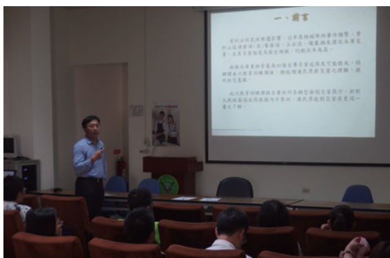
▲大規模崩塌防災教育訓練