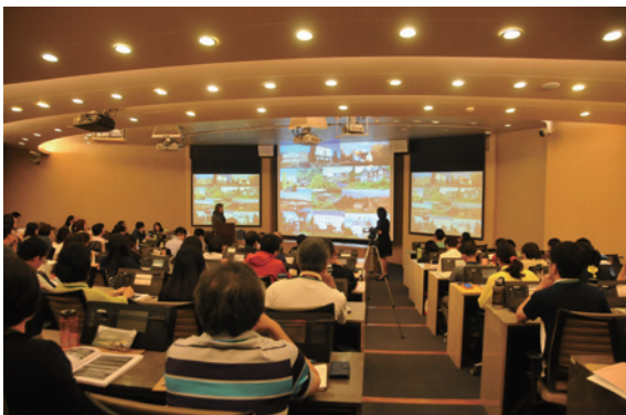
▲林務局與英國田野學習協會共同帶領臺灣邁入「環境教育 2.0」（由林務局提供）

林務局辦理「環境教育 2.0 — 轉型關鍵 · 定義未來：2016 年英國田野學習協會（Field Studies Council）典範轉移與實務交流論壇」，導入英國田野學習協會永續營運環境學習場域的關鍵成功因素及優勢策略，並由林務局分享自然教育中心國際合作經驗及典範學習的歷程，包括組織管理、安全維護、評鑑精進、特色課程等主題，期帶動全國環境學習中心之持續營運與共同發展，計 130 人與會。（林務局 李秉容）