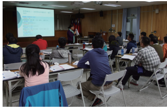
▲花蓮林管處邀請記者講授新聞寫作技巧

隨著林務工作的多元化，花蓮林區管理處為加強同仁於林務工作處理有效轉化運用為新聞寫作題材，了解新聞事件的採訪、處理及記者擔負社會閱聽責任的新聞角色，特地邀請中國廣播公司、國立教育廣播電台花蓮分台及更生日報記者講授關於與媒體關係選立、新聞寫作運用及口語傳播表達等課程。（花蓮林區管理處 陳靜儀）