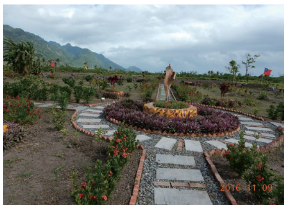
▲興隆社區居民搭配天然的山海風情，善用社區空地，栽植適當的綠美化樹種，整理出美麗的社區小公園。（攝影／臺東林區管理處 鄭秀美）

臺東林區管理處於 9、10 日進行「社區配合植樹綠美化補助計畫」模範社區評比，經評審委員實地考評後結果出爐：第一名為臺東縣東河鄉興隆社區，除獲次（106）年最高補助金額 24 萬元，並提報為全國綠美化模範社區，第二名為臺東縣原住民依澤文化協會，將於 106 年全國及臺東縣植樹節活動中公開發揚。（臺東林區管理處 鄭秀美）