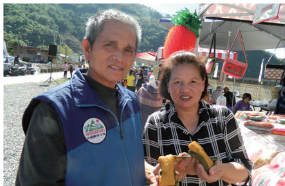
▲原民市集展售泰雅族獵人傳統食物阿木力，開賣不久即銷售一空。

南投林區管理處為建構多元、優質的旅遊環境，帶動奧萬大國家森林遊樂區鄰近部落的整體發展，首次於南投縣仁愛鄉親愛村松林部落籌設「布蘭原民市集」，並於11月19日開幕啟用。「布蘭(Pulan)」原民市集係採松林部落舊地名命名而成，現場展售原鄉在地蔬果、原住民傳統藝品、原住民特色食物醃生豬肉泰雅族獵人傳統食物－阿木力、蜂蛹酒及當地特有香糯米等，林管處也期待遊客在選購部落農特產品之虞，亦可體驗知性與感性的多元旅遊行程。（南投林區管理處 簡盈宜）