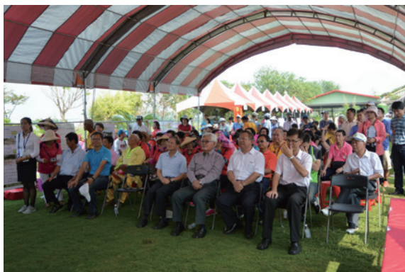
▲雲林縣縣長李進勇及南投林區管理處副處長陳耀榮一起參加第3場「點亮社區嘉年華活動」

頂溪社區等 8 個社區參加綠幸福創意市集展售，同時進行為期 1 週的社區植樹綠美化靜態成果展示。