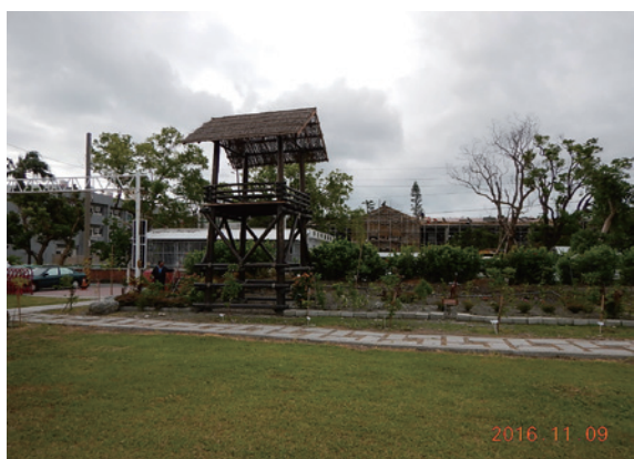
▲臺東縣原住民依澤文化協會，積極邀請鄰近的臺東專校、康樂國小、救星教養院等夥伴，與部落耆老一起揮灑汗水，種下花草草，營造美麗的風格花園。