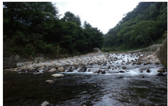
▲粗石斜曲面魚道（攝影／東勢林區管理處 梁家柱）

斜曲面魚道，此魚道工法屬國內首創，又因水流衝擊粗塊石造成水花及聲音效果，藉以吸引馬口魚、苦花與虎蝦等洄溯上游，同時水花衝擊亦增加水中含氧量，更增添魚類生長元素。評審小組對於本處溪流治理加入生態廊道處理，及本工程大膽嘗試國內首見「粗石斜曲面魚道」深感肯定，並期許未來可作為魚道環境教育場所。本工程經評鑑，獲得第 16 屆金質獎—水利類佳作獎之肯定。（東勢林區管理處 梁家柱）