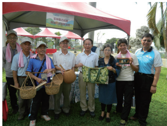
▲林務局副局長楊宏志、南投林管處處長張岱、縣府農業處長陳瑞慶與樟湖社區居民一同展示小花蔓澤蘭染製成品及竹編器皿。（攝影／南投林區管理處 簡盈宜）

南投林區管理處在南投縣草屯鎮國立臺灣工藝研究發展中心生活工藝館草坪廣場辦理「105 年度社區林業成果展—綠保里山生態雲」活動。林務局副局長楊宏志、南投林管處處長張岱及南投縣政府農業處長陳瑞慶也都到場體驗社區林業成果。活動現場除了傳達社區與環境生態保育的重要性外，也帶領民眾認識「綠保標章」，及瞭解「里山倡議」的意義與精神，現場還展示林務局所建置「社區生態雲電子商務網站」及「淺山生態保育成果」，盼藉此網站媒合生產端與消費者，減少中間剝削，達到雙贏。（南投林區管理處 簡盈宜）