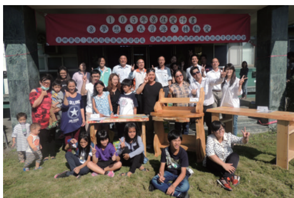
▲桌住愛成果展示會，8戶家庭與林管處和協會開心與自製書桌合照。