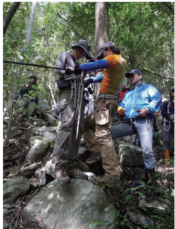
▲林野巡視人員訓練情形

東勢林區管理處與陸軍航空特戰指揮部特戰訓練中心麗陽營區合作，進行2梯次的山地訓練，在特戰教官精實的訓練下，學員們收獲良多，直呼「賺到了」！特戰中心麗陽營區是國軍最精實的山訓部隊，東勢林管處特別挑選80位巡山精英進入營區，接受特戰教官指導，吸收野地技能，特別是困難地形通過、自我確保、追蹤訓練、迷途處置及夜間野外求生訓練等課程，利用營區內訓練場地實際操作，大大提高巡山員未來執行深山特遣勤務的安全度。(東勢林區管理處 吳欣純)