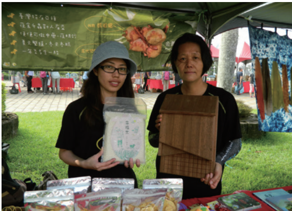
▲南投林管處邀請臺灣永續聯盟一起推展蝙蝠屋，藉由蝙蝠生物防治夜蛾危害，藉此推廣里山倡議友善農法精神。