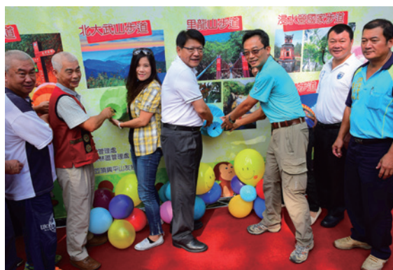
▲步道護照戳印，象徵步道護照啟用。

屏東林區管理處自 91 年起推動規劃轄內步道的整建工作，今年特別將轄內步道之美，彙編成步道護照手冊，並於 15 日與屏東縣政府及茂林國家風景區管理處在大津瀑布步道，共同舉辦「步道巡護 GO 有禮」活動，正式啟用步道護照，邀請大家一起走入屏東林管處轄內豐富多元的步道，體驗山林之美，參與民眾反應熱烈，場面熱鬧非凡。步道護照內一共精選 7 條自然步道，包括位於屏東縣的尾寮山、北大武山、浸水營、里龍山、石門山，還有位於高雄市的美濃雙溪樹木園與六義山等步道，希望大家帶著步道護照，親身探索自然，同時也能留意手冊內的安全注意事項及無痕山林守則，當個負責任的自然愛好者。（屏東林區管理處 黃麒仁）