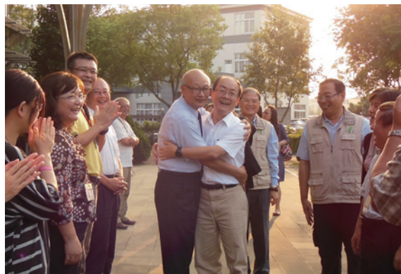
▲處長交接典禮順利完成後，新舊處長接受同仁祝賀。

打下的根基及未來李處長的帶領下，也要繼續努力為林業貢獻，讓更多國人充分享受森林的價值。（南投林區管理處 簡盈宜）