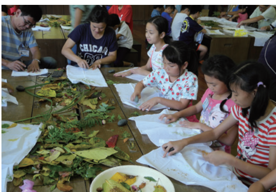
▲親子們運用自然素材，敲染出獨一無二的創作（攝影／屏東林區管理處 吳欣瑾）

產物，如木蠟、桐油、精油…等。活動熱情、專業的環教教師與國家森林志工帶領所有參加者進入園區森林步道感受森林浴的洗禮，說明每株植物背後精彩故事，並運用園區內的自然素材進行敲染創作，製作獨一無二的紀念品，讓所有參加者留下難忘的回憶。（屏東林區管理處 吳欣瑾）