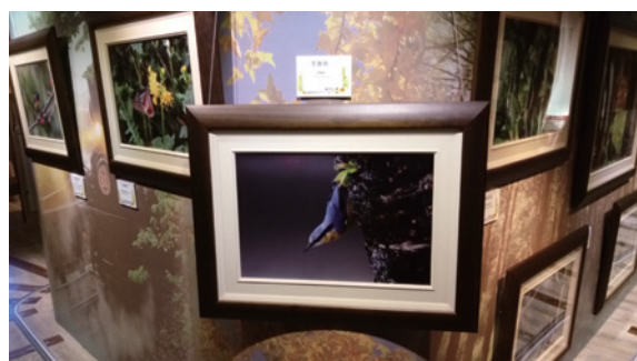
▲阿里山常見的鳥類—茶腹鵝

阿里山國家森林遊樂區自 14 日起於阿里山旅客服務中心 2 樓舉辦「森生不息」阿里山生態保育展，透過影像記錄八八風災後阿里山保育成果及生物多樣性推廣活動，讓來阿里山的遊客雖然無法深入保護區域，卻能透過相片近距離欣賞野生動植物之美，並瞭解阿里山的保育情形。（嘉義林區管理處 許玉青）