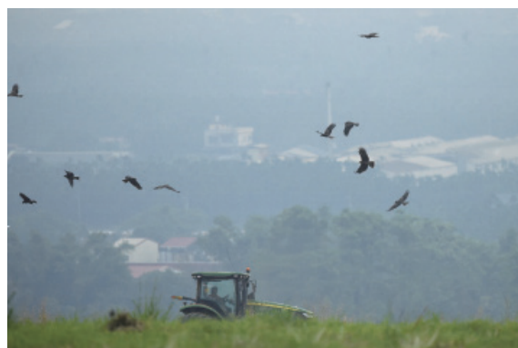
▲農地的保育策略成為黑鳶保育的關鍵之一

我們在 2012 ~ 2016 年間除了記錄到大量鳥類因加保扶死亡之外，也發現多筆黑鳶的中毒事件，其中有 4 隻確診為加保扶中毒死亡、3 隻確診為老鼠藥中毒死亡；在野外目擊同時最大量有 9 隻黑鳶在撿拾被加保扶毒殺的鳥屍（林惠珊，2013）。面對如此環境用藥對食腐性的黑鳶族群而言，是一大生存上的威脅。故意毒殺小型鳥的行為導致黑鳶撿拾有毒屍體而死亡，以及無論是農村或環境用藥中的抗凝血劑型的鼠藥施用，導致被毒殺的齧齒類屍體遭到黑鳶撿拾的可能性大增。