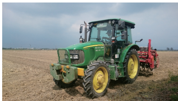
▲農地的保育策略成為黑鳶保育的關鍵之一

近年來，行政院農業委員會支持發展有機及無毒農業的推廣方向、林務局推動里山倡議的行動、防檢局亦著手進行農地鼠藥發放的減量及劇毒農藥逐步禁用等，均有助於產業及環