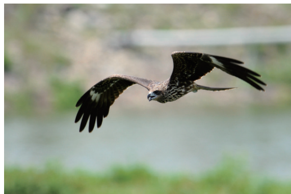
▲ 黑鳶在臺灣是屬於第二級的珍貴稀有保育類野生動物

估全臺可能的黑鳶族群數量，結果顯示全臺黑鳶主要族群的數量為 302 隻，其中又以屏東地區最多（沈振中，2007）。