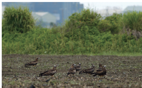
▲成群在山林及農地交界生活的黑鳶成為保育大使

境保育的同時提升。在 2013 ~ 2016 年間的黑鳶族群數量監測，由志工每年 9 和 12 月各進行 1 次黑鳶族群同步調查，在全臺已知夜棲地的黑鳶數量分別是 272、359、426 以及 626 隻，近 4 年族群已明顯增加。綜合可見，透過檢視黑鳶的生存危機，將危機化為轉機，嘗試各種方式協助降低黑鳶族群生存限制因子的壓力，從產業面著手，有助於農民提升收益、改善田間管理、活絡相關產業，同時亦可兼顧環境保育。未來，持續的推廣及觸及更多的民眾，讓全民環境意識提升，不僅是對食安問題的重視，同時是關心自身健康，也能對環境維護及其他物種的生息狀況盡一份心力。🌱