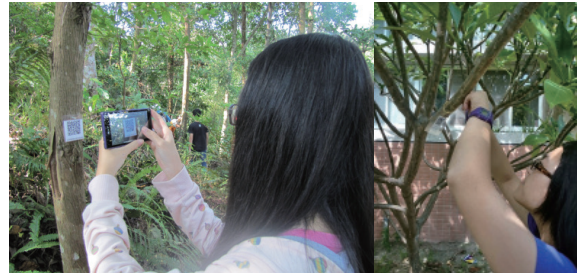
▲圖3、以樹木、植栽為生態教育、管理基點的「生態保育行動解說QR code系統」。