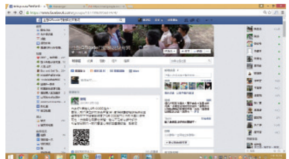
▲圖8、生態保育行動解說QR code系統（經營團隊與使用者交流的社團facebook社群網站，若有學校或機關團體有意自行現場建立樹木解說掛牌，即可於此與經營團隊聯絡，免費下載樹種解說QR code表應用，目前已有近300種樹種，持續增建中 https://www.facebook.com/groups/1077996995607474/ ）