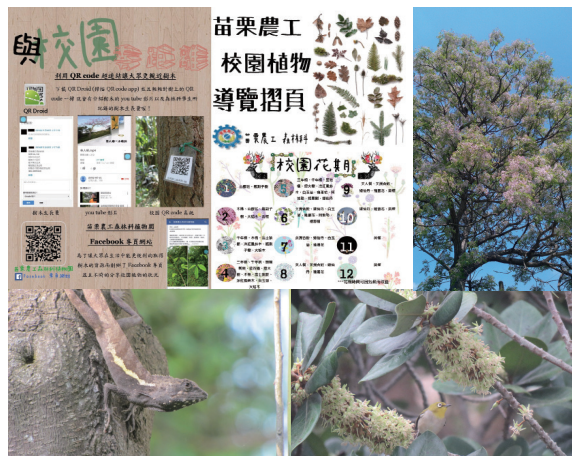
▲圖10、融合教學、專題、活動與校園生態紀錄的「生態保育行動解說QR code系統」。

教育部諸多單位肯定與讚賞（例如：教育部國民及學前教育署特別提及分享於「師友月刊」中），廣受各界好評，亦可說為林學教育及推廣拓展至一個小而美的豐富領域與創新方向。