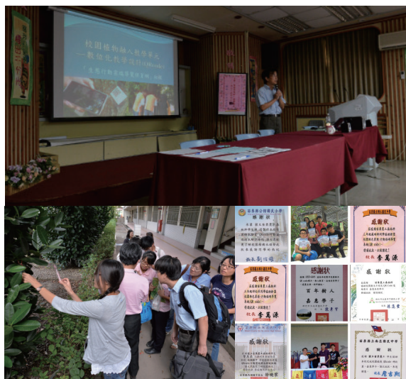
▲圖13、「生態保育行動解說QR code系統」持續於多處教育研習、社區營造場域推廣。

在後期推廣歷程中，承蒙各界先進同好的熱心指教與激勵，更深感此系統目前雖存有諸多疏漏與誤差，但實為一具有應用潛力與發想空間的實惠方向，例如：在一次苗栗縣教師研習（104 年度精進教學能力計畫）的分享後，諸位參與教師就表示願意拓展此一系統，並連結史地人文與藝術領域的內容，成為社區生態與環境教育的據點。每當我們看到一些山林路標、指示標物、解說標牌甚至登山綁帶，未有或現有的一些標示或解說事物，其實也非常值得經營單位或相關團體深思如何增進其內容、效用與改善其形式、結構，此時也就相當程度地啟發性或試驗性強制關聯至「生態保育行動解說 QR code 系統」，可做初步比較分析。期待此次經驗分享可達野人獻曝之效，促進森林遊樂、生態保育、環境教育、資源調查各界投入相關系統之探究、開發、應用與推廣。