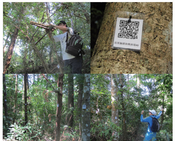
▲圖 12、實習林場的試驗與調查

持續增設與擴大中。此系統設置一方面充分結合森林測計與育林的專業實習與課程活動，一方面更促進森林地面調查與長期監測方法系統化與數位資料化的落實，直接、間接也就提昇了科學科技探究、森林保育與管理之功效。