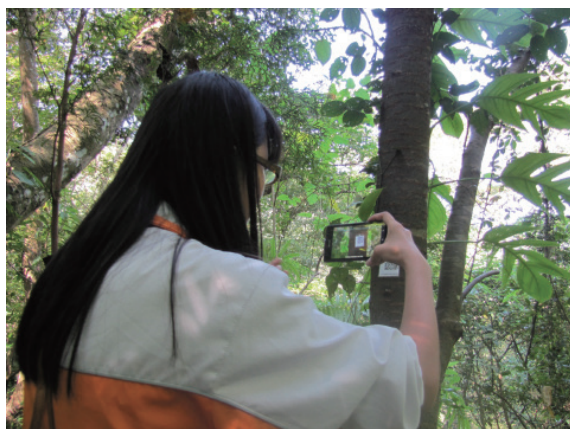
▲圖2、山林綠境就是最鮮活的教室、最精采的博物館

屬草創階段，方興未艾。例如：博物館學中的經營理念與技術，如何將作品物件與參訪動線做最精緻的設計與規劃，都應該可以提供擁有最多藝術文化、知性感性「鮮活作品」、「生動情境」的山林綠境經營者參考與學習。其實國內外早已有專家學者提出「生態博物館」的概念與理論，但在實踐的廣度和深度上都仍有很大的投入空間，以現存的很多自然教育、環境教育導覽媒體、解說看板、標記系統，在成本效益、輕巧便利、即時就境、整合聯結上上都有很多值得創新、探究與精進的方向與課題。