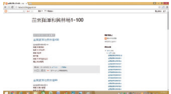
▲圖7、樹木生長記錄網（做為植物生長與保育管理的網誌 Blogger http://lab239.blogspot.tw/ ）