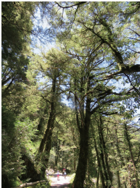
▲圖1、「森林的存在」關乎人類的感知與行動

物而非役於物」地善用現代科技於生態保育與教育上，即成為「生態保育行動解說 QR code 系統」的建置與推廣重要方向。雖諸多疏漏與不足，但衷心期盼能發揮拋磚引玉之效，促進此一方向蓬勃發展。