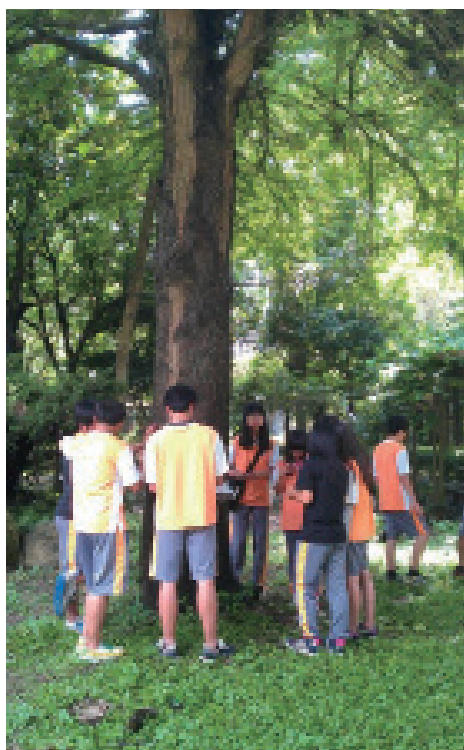
▲圖4、從林業啟動，從校園出發。