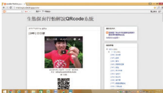
▲圖6、生態保育行動解說QR code系統網誌（整合植物物種解說影片與使用回應的網誌Blogger http://mlaivsqrqrqr.blogspot.tw/search?updated-max=2015-12-11T07:29:00-08:00&max-results=7&start=7&by-date=false ）