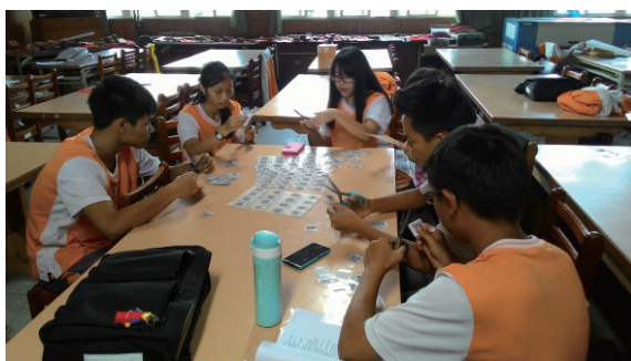
▲圖5、二維條碼QR code掛牌製作與應用

而此次系統採用的 QR code 即是二維條碼的一種，英語稱 Quick Response Code，於 1994 年由日本 DENSO WAVE 公司發明，中文稱快速反應矩陣碼，因發明者希望 QR code 能讓其內容快速解碼。QR code 最常見於日本，為目前日本最流行的二維空間條碼，比普通條碼可儲存更多資料，也不需像普通條碼般在掃描時須直線對準掃描器，因此其應用範圍已擴展到產品跟蹤、物品識別、文件管理、營銷等。