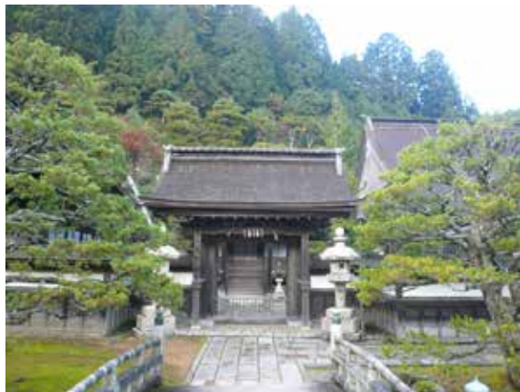
▲高野山寺院與森林緊密相依