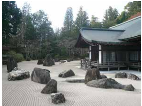
▲金剛峯寺庭院深具禪意