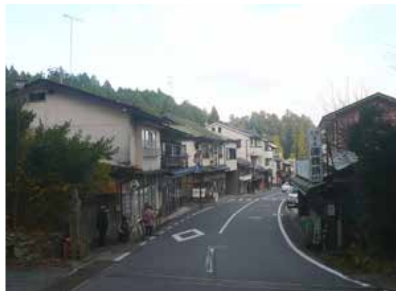
▲高野町是典型的山村聚落

松( Sciadopitys verticillata )，是日本特有種，樹形優美、紋理細緻，被選為町樹（高野町，2017a）。高野町擁有悠久的宗教信仰文化，保存眾多的朝聖歷史古道，維護優良的自然環境，更具有獨特的森林景觀，近年來積極申請森林療癒基地，2007年3月通過認證，由「高野山寺領森林組合」負責，積極推動森林療癒工作（森林セラピーソサエティ，2017）。筆者於2016年11月底前往參訪，收集相關資料並進行深度訪談，希望能將高野町的山村振興與森林療癒成功案例提供國內參考。