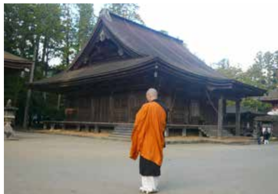
▲高野山的宗教文化融入森林療癒中

的重要特色，也是森林療癒的獨特元素，高野町將寺院的精神文化及精進料理融入森林療癒活動中，更加凸顯高野町的與眾不同。🌲