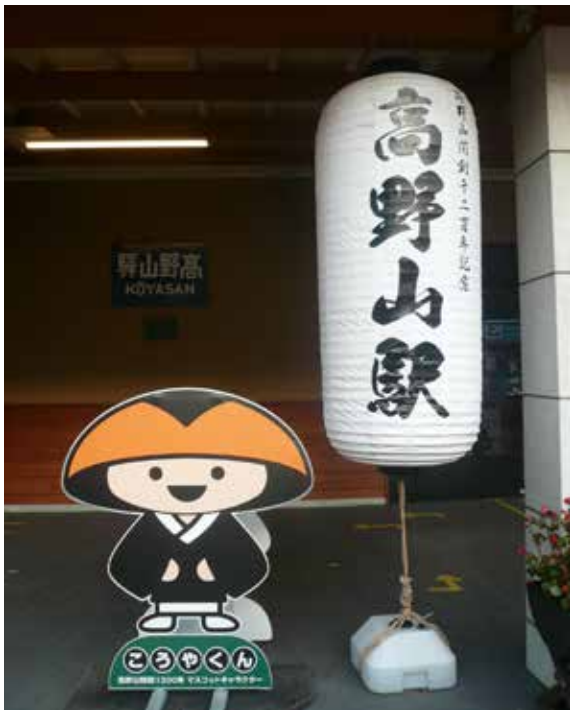
▲高野町已具有1,200年歷史

高野町結合當地的自然及人文特色，積極推廣「著地型觀光」，搭配寺院的「信仰旅遊」及「森林療癒旅遊」，促進遊客在地停留增加消費（高野町，2009）。此外，高野町也積極傳送觀光情報，尤其鎖定京阪神近畿圈及首都關東圈居民，吸引更多都會民眾前來高野町觀光旅遊。