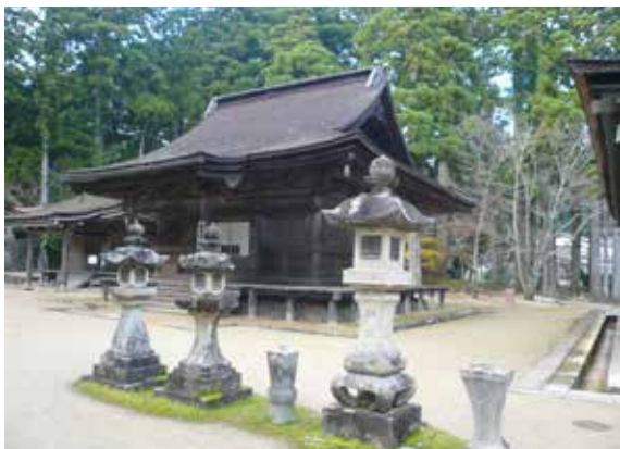
▲御影堂被登錄為聯合國世界遺產