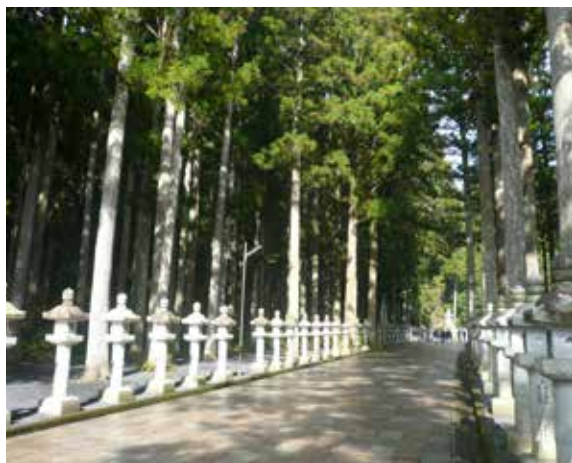
▲奥之院參詣道兩旁石亭羅列

奥之院為弘法大師御廟，至入口一之橋間的參詣道約有2公里長，兩側參天巨杉林立，羅列數萬墓碑，氣氛莊嚴幽靜，這些巨杉都是江戶時代全國各地大名所寄進種植的，樹齡介於400到600年間，目前已成為日本著名的信仰林，面積有17公頃之多。昭和33年（西元1958年）4月1日，參詣道兩側巨杉被指定為和歌山縣天然紀念物，昭和46年（西元1971年）3月30日，這些樹形通直、材質優良的巨杉，進一步被指定為國家特別母樹林，到目前為止，共計有733棵母樹。昭和52年（西元1977年）4月18日，日本全國植樹祭時，當時的昭和天皇及香淳皇后還特地前來高野山進行植物鑑賞，並觀看高野山林業技術實地演練，高野山的林業經營更加受到肯定（金剛峯寺山林部，2017）。