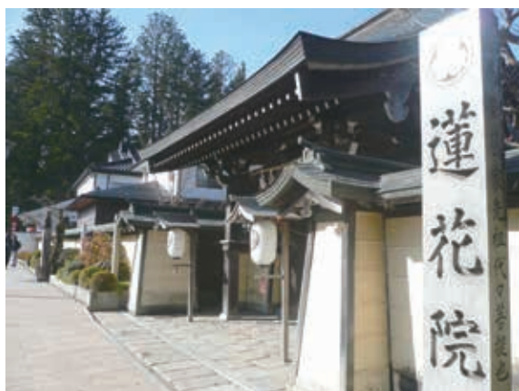
▲高野町擁有悠久的宗教信仰文化