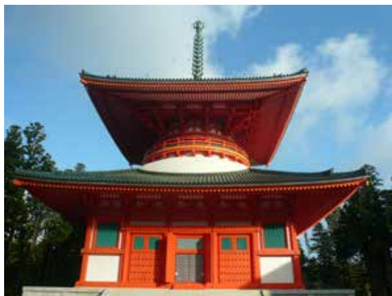
▲高野山金剛峯寺的根本大塔

高野山又經歷過數次祝融火災，復原建材仍舊是取自於當地森林，而造林工作則不斷地進行，樹種包括檜木、日本金松、柳杉、赤松、冷杉及鐵杉等；文化10年（西元1813年），金剛峯寺選取上述6種木材為「高野六木」，作為寺院修繕專用，其他木材一概不用（金剛峯寺山林部，2017）。