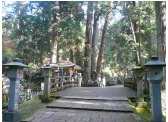
▲高野山的森林療癒步道