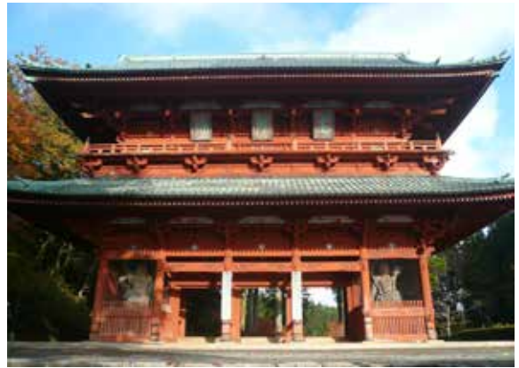
▲高野山大門為聯合國世界遺產

天的恩惠，在高野山採集山菜，並當天料理，品嚐高野山的在地食材美味；「意念」療癒體驗，從不同觀點來體驗高野山，經由法師的講道，觸及心靈深處，獲得內心思緒安頓；「聽覺及視覺」療癒體驗，聆聽森林中生物的美妙聲音，觀賞不同的繽紛色彩及獨特姿態，尤其在夏季時更是賞鳥的最佳季節；「觸覺」療癒體驗，置身在幽靜的森林中，透過觸覺去體會植物世界，達到療癒功效；「嗅覺」療癒體驗，近距離親身體會高野山針葉樹的天然芳香，並動手DIY芬香噴劑。以上五感體驗每一梯次只招收10人，每人收費4,500元日幣； （7）古道巡禮：高野山森林療癒提供八條古道巡禮路線，均相當受到歡迎，例如日本金松純林古道，也是列入世界遺產的參詣道「女人道」，全長5.4公里，高聳的日本特有種金松巨林夾列兩旁，更加襯托出參詣道的靜謐與肅穆；黑河道古道，全長6.0公里，是過去伐木運材時的軌道遺址，2016年時被迫認為世界遺產，可緬懷高野山林業開發史；另外，還有町石道古道，也被列入世界遺產，這是經由九度山大門進入高野山的參詣道，每109公尺豎立一町石，全長8.0公里。以上古道巡禮的森林療癒體驗活動，每一梯次只招收10人，每人收費4,200元日幣。除了上述常態性森林療癒體驗外，高野山也會為特定日子舉辦紀念活動，例如2017年高野山將慶祝當地的森林療癒基地通過認證10週年，於10月15日時舉辦植樹紀念活動，並搭配森林療癒體驗，只招收20人，每人收費4,200元日幣。