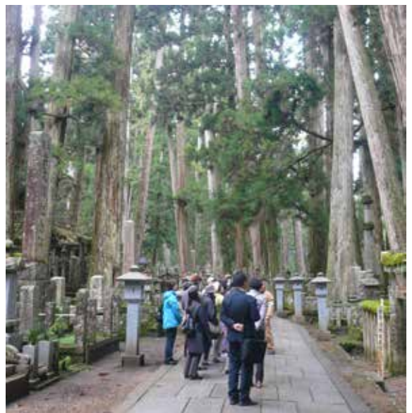
▲高野山森林療癒體驗之旅