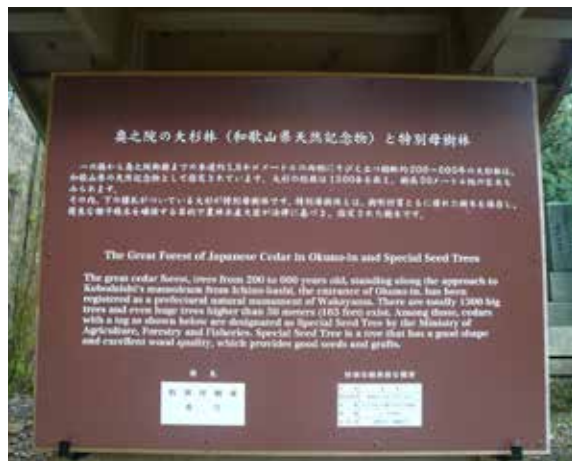
▲高野山國家特別母樹林

高野山百年以上檜木眾多，過去寺院僧侶常就地取材，剝取檜木樹皮作為屋瓦，且不傷及樹木本身，此項傳統工藝延續許久。為了確保這種獨特的鄉土森林文化，金剛峯寺向文化廳申請列入文化財，並於2014年3月24日通過認定。此外，為了體現弘法大師所提倡的「共生」理念，強調人類只是世間中之一員，必須與周遭萬物和諧相處，金剛峯寺在經營森林時，大都採用間伐作業，降低森林破壞。間伐後的木材再加以利用，製作