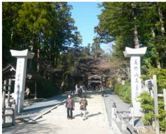
▲高野山金剛峯寺入口

第二次世界大戰後，日本政府將部分保管林歸還給金剛峯寺，面積約600公頃，另外，約483公頃保管林則改為「分收林」，金剛峯寺與日本政府簽訂契約，經營國有林班地，未來林地收益必須按照比例回歸政府。除了委託經營國有林地外，金剛峯寺也陸續購買附近的私有林，擴大經營森林面積，昭和26年（西元1951年），將原先的山林課改制為山林部，並且確立一期10年的森林管理計畫，邁向現代化的林業經營。目前金剛峯寺所擁有的私有林共計1,642公頃，主要分布在高野山，少部分位於九度山及其他地區（金剛峯寺山林部，2017）。