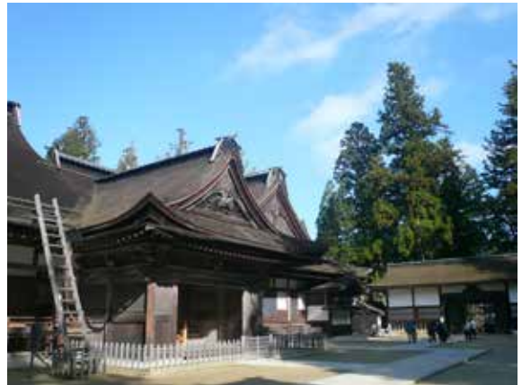
▲金剛峯寺積極投入森林療癒工作