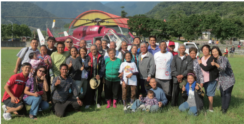
2013年，金岳社區實現以直昇機載耆老返回Ryohen（流興）部落的圓夢計畫。

若將金岳部落的經驗視為南澳地區生態旅遊發展的縮影，可以發現，由於經歷了大規模的集團移住與遷村，現今生活在南澳地區的南