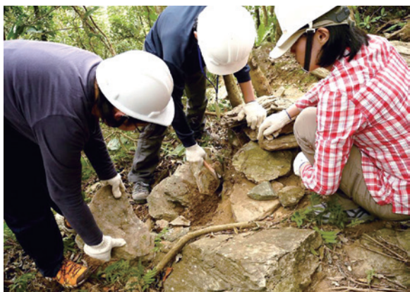
金岳社區楓香步道手作步道工作假期。