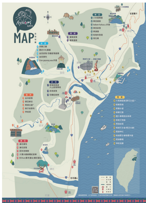
Aynomi愛南澳—大南澳旅遊地圖。