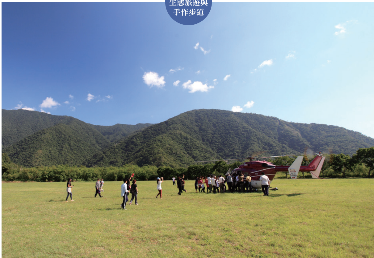
金岳社區實現以直升機載耆老返回Ryohen（流興）部落的圓夢計畫。