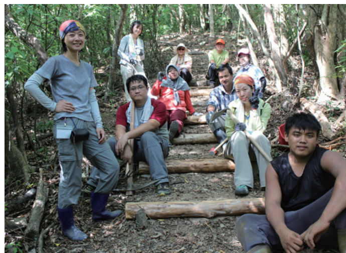
蘇花古道大南澳越嶺段手作步道工作假期。

2014年起，透過系列活動的辦理，「蘇花古道大南澳越嶺段」修復工作假期、大南澳生態旅遊踩線團等，促使跨社區的大南澳生態旅遊遊程開始串連，跨部落旅遊動線逐漸成形、社區之間開始建立合作關係；而手作步道工作假期的經驗也為社區帶來嶄新的觀念，同時帶入與一般觀光客不同性質的族群，擴大了社區推動旅遊服務的視野，為社區環境營造導入更多專業者與志工人力。