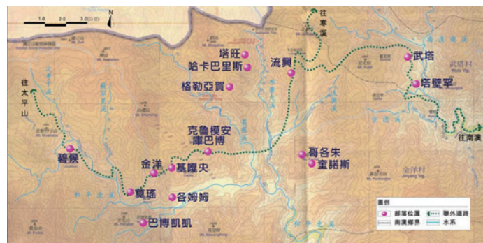
南澳群泰雅族部落位置圖。

儘管如此，在日治時期「理蕃計畫」逐步推行下，南澳群泰雅族人受到日人的威脅利誘，陸續從深山祖居之地遷出；當時各部落主要是利用「番地武塔道路」往來南澳平地與部落。當1964年最後一部分族人遷居至現在的金洋村及武塔村，IlyungKlesan成為泰雅族少數整個流域遷離原居地的社群，而由林務局以「番地武塔道