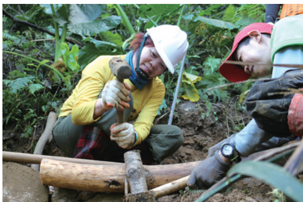
東岳社區蛇山步道手作步道工作假期。

更重要的是，手作步道的核心理念與在地社區亟欲透過古道，重新連結傳統文化的願景契合，因此金岳社區率先積極舉辦相關培力課程，期能學習古道修復的技術，並於社區後山整建「楓香步道」作為第一步實踐。緊接著東岳社區也開始藉由社區林業計畫的支持，展開「蛇山步道」的修復。