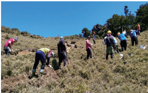
高山協作手作步道訓練。

2014年度臺東處為正視嘉明湖國家步道登山安全與生態環境，朝永續方向前進，委託專業團隊進行嘉明湖步道整體檢核發展，針對步道設施、山屋環境進行盤點，並全面檢討經營管理策略，提出各項改善方案。嘉明湖國家步道為「關山野生動物重要棲息環境」，為保育野生動物、維護物種多樣性與自然生態平衡，提倡步道生態旅遊與資源之公平利用，於2015年度實施步道經營管理新制度，進行住宿總量管制及山屋收費制度。每年並針對步道經營管理檢討，邀請在地協作、登山團體、相關政府單位及專家學者等進行滾動式檢討會議，持續優化嘉明湖步道經營管理服務。2018年為保障在地協作的工作權益，臺東處針對海端鄉高山協作訂定山屋住宿申請利用須知，以確保海端鄉從事協作之個人及企業社員工於嘉明湖步道工作期間，可取得山屋住宿之床位。