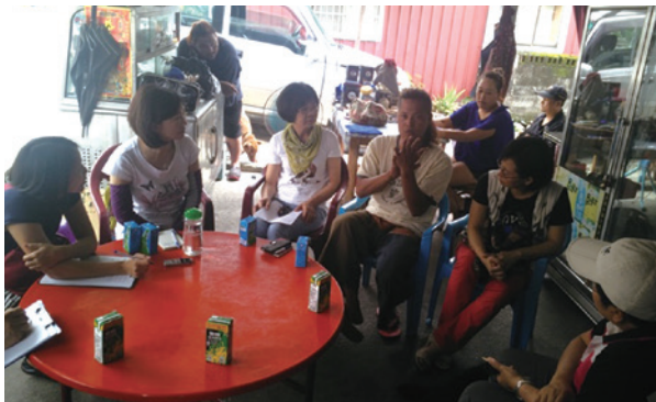
海端鄉協作團隊需求訪談。