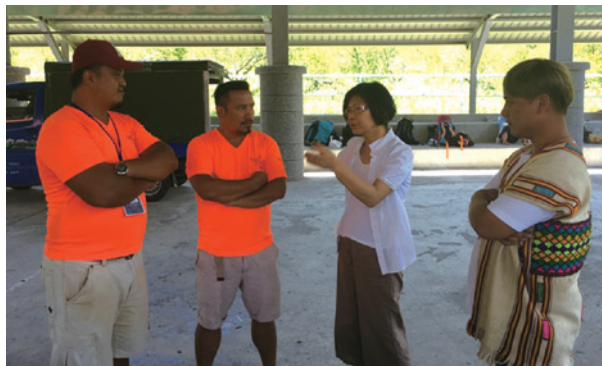
臺東林區管理處拜訪海端鄉在地協作團隊。

談嘉明湖步道與原住民協作產業發展，就必須回到嘉明湖步道的經營管理政策發展歷程，嘉明湖步道自2005年向陽國家森林遊樂區開放以來，登山民眾的遊憩活動集中於週休二日及連假時間，每逢假日嘉明湖山屋常出現一位難求的情況，隊伍四處紮營，使山屋周邊環境出現擁擠人潮，所產生的大量垃圾及排遺更造成