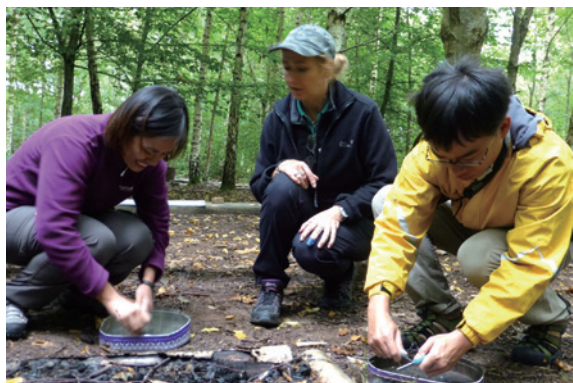
圖10、打火石體驗。