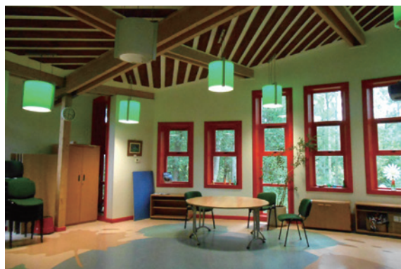
圖4、畢夏木田野中心其中一間木造風格教室。

府教育局主導與施作。畢夏木田野中心2016年4月加入FSC，同時是FSC其中一個自然教育中心，也是國家配電公司環境教育聯盟其中的成員，像這樣在英國有和電廠有合作關係的教育中心有4個。畢夏木田野中心面積佔地70公頃，擁有較古老及新生的森林環境、水池等棲地，該範圍主要以推動教育為目的，在經營管理與場域維護上，電廠每年贊助2萬英鎊給中心作為營運資金，也贊助6萬英鎊作為中心場域維護的預算，雙方亦簽訂「永續維護計畫」共同進行場域維護，在分工上，中心負責建物內部維護，電廠負責建物以外的修繕（圖3）。