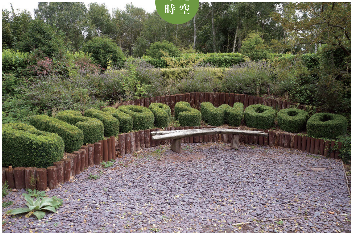
畢夏木田野中心（Bishops Wood Field Centre）入口意象。