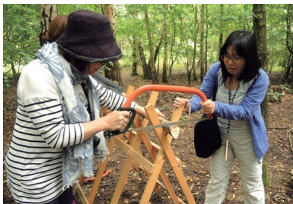
圖9、木工體驗。