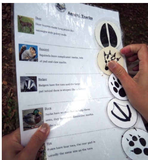
圖6、探索動物足跡學習單。