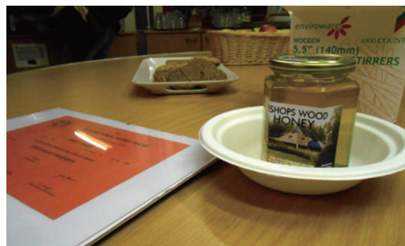
圖2、畢夏木田野中心與合作蜂農所產的森林蜜。

畢夏木田野中心在1994年由當地政府教育局和國家配電公司（National Grid）共同成立與營運，國家配電公司為中心建物與土地之財產所有權人，而所有建物的設計與規劃由地方政