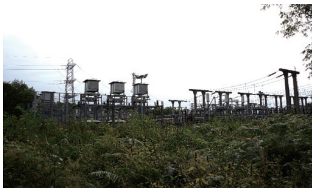
圖3、國家配電公司所屬的配電場即位於中心旁（National Grid）。