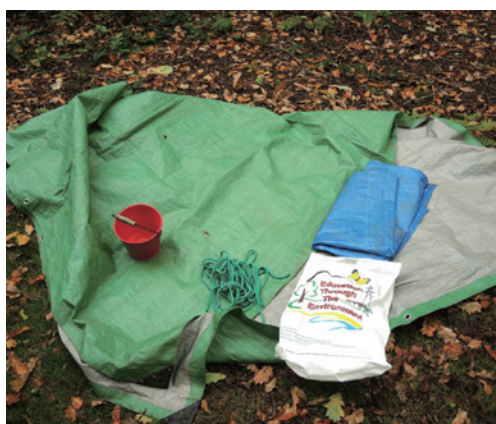
圖7、使用之器材(右上)。