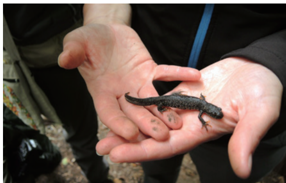
圖11、教師發現之蝶鵲向學員說明。（攝影／曾郁惠）