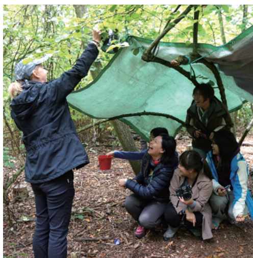
圖8、教師利用灑水器測試是否牢固(右下)。