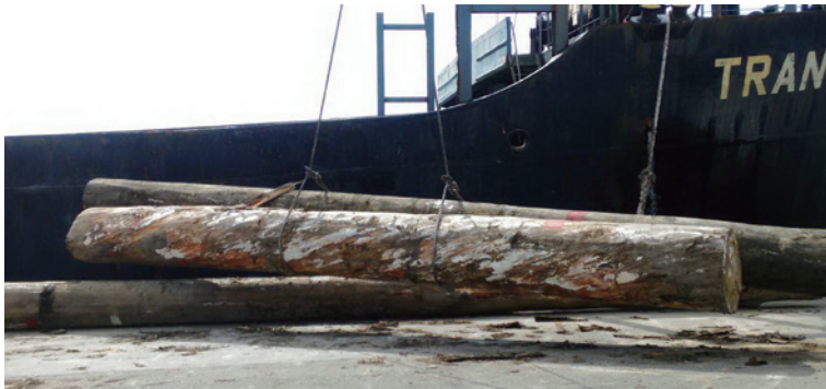
圖1、進口原木卸船作業。