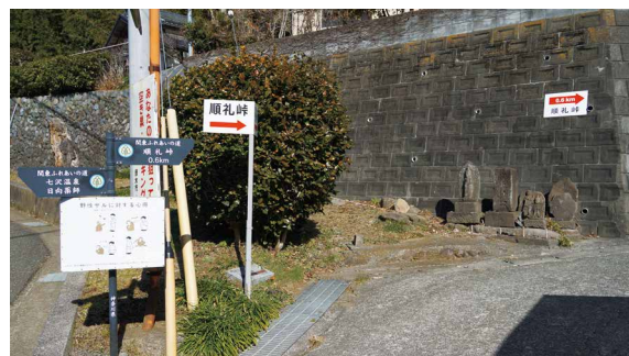
圖8、順礼峠步道之入口。

厚木市的森林療癒強調「森林與溫泉的療癒結合」，就是鼓勵民眾擁抱森林和走向大自然，親身體驗悠久的天然溫泉和享用新鮮的當地食材，藉由綠色產業的推展，振興地區的經濟和創造民眾的福祉，並賦有歷史的傳承意涵。