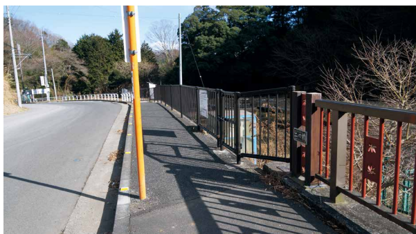
圖6、二之足林道途中的二之橋。