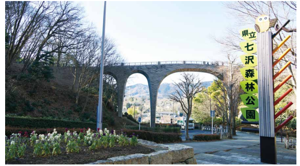
圖3、七澤森林公園前拱型陸橋。

森林療癒基地佔地約1,500公頃，擁有許多設施，如住宿設施、醫院、森林公園和露營地等，除了3個公認的森林療癒步道外，還有搭配許多套裝行程。在森林療癒基地中活動，經森林方面的醫學專家所證實，可達到放鬆心情的效果（池井晴美，2014），而且再搭配周邊的輔助設施，效果更佳。在2006年經由東京農工大學的協助下，於本厚木站附近的都會區和