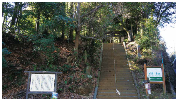
圖7、鐘ヶ嶽健行步道入口。

觀。「食」的里山保全活動則安排在每月第三個星期日的10:30-15:00，就地使用園內的雜木林的薪材，並料理出野外風味餐（費用為300日元，雨天中止）。