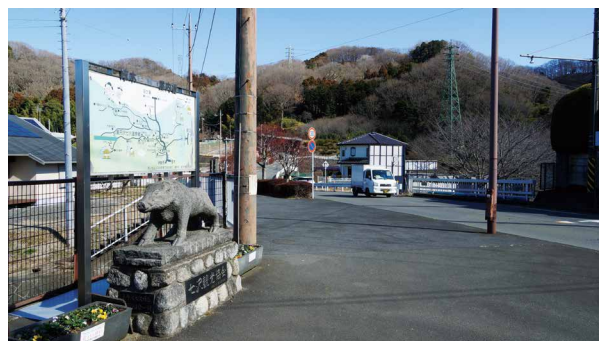
圖5、七澤觀光協會立牌的野豬雕像。