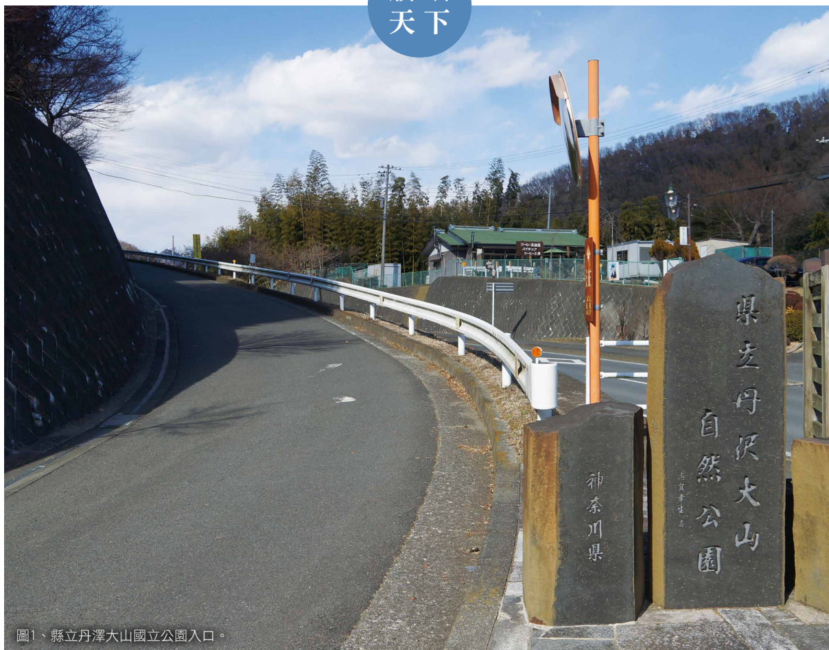
圖1、縣立丹澤大山國立公園入口。