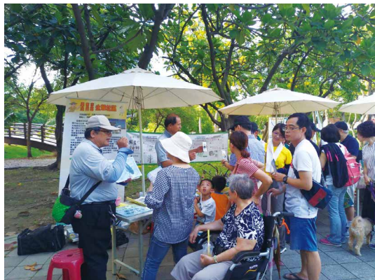
民眾熱情參與「國際生物多樣性日」推廣活動。