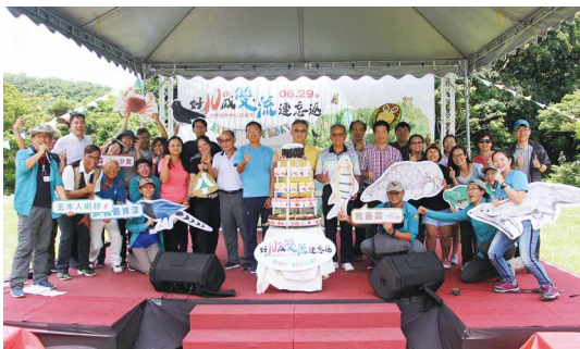
來賓一同切蛋糕慶祝雙流自然教育中心十周年。