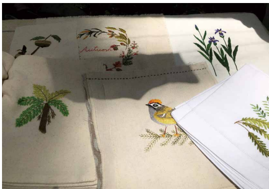
以森林為創意發想的作品。