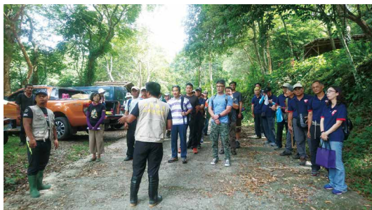
達魯瑪克部落協助辦理731世界巡護員日－邁向勇士之路、魯凱族文化體驗活動。