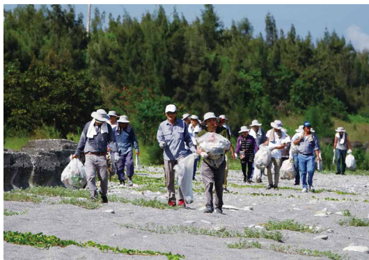
參加人員一同進行淨灘。