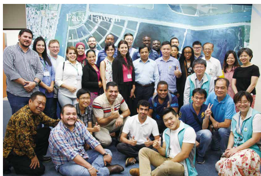
農航所向來訪外賓介紹立體觀測技術。