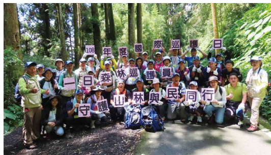
一日森林巡護員體驗活動。