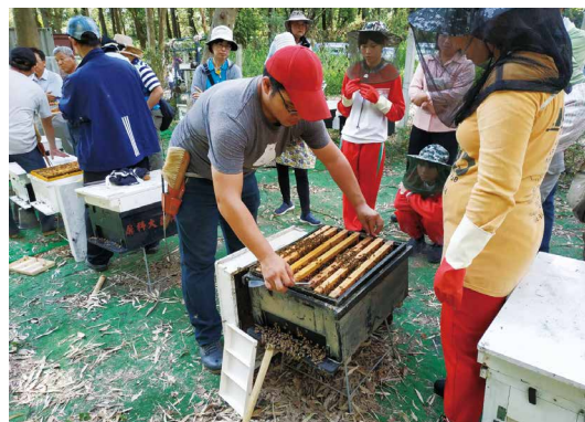
林下經濟養蜂教學實作。