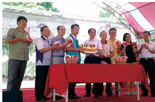
嘉義縣縣長翁章梁（左4）、林務局副局長廖一光（左5）與貴賓一同為觸口自然教育中心慶生。