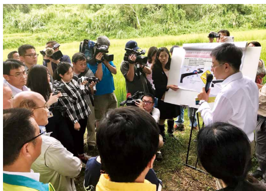
林務局局長林華慶於楓樹里現地向行政院院長蘇貞昌簡報說明。