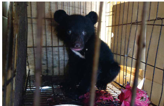
民眾緊急收容於香蕉園發現的小黑熊。