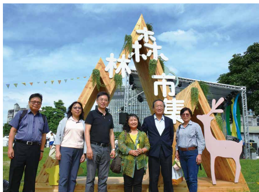
與會貴賓在森林市集意象前合影。