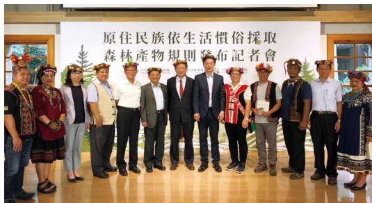
原住民族依生活慣俗採取森林產物規則發布記者會，與會貴賓大合照。