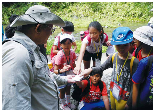
在環境教師的帶領下，學員學習辨認動物腳印足跡，並穿梭在雙流森林與溪流，尋找各式各樣的生物。