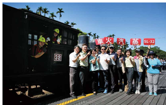
蒸汽火車於竹崎火車站。