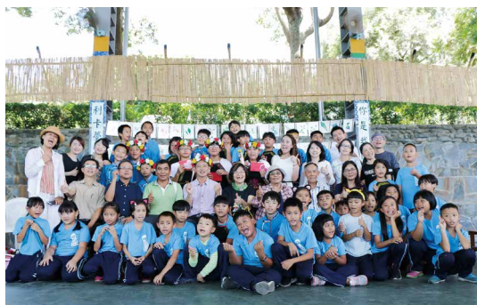
臺東處結合利嘉國小畢業典禮，公開發表《你是我的菜》一書和DVD。