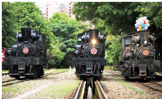
3輛百年蒸汽火車同框。