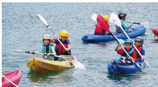
「溯·森林」營隊學員在鯉魚潭划獨木舟，除了鍛鍊體力也培養合作精神。（攝影／池南自然教育中心環境教師 林大成）