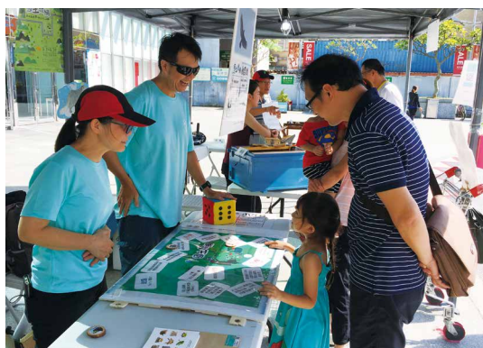
瑞穗生態教育館以山脈生態大富翁遊戲讓小朋友認識動物棲地。