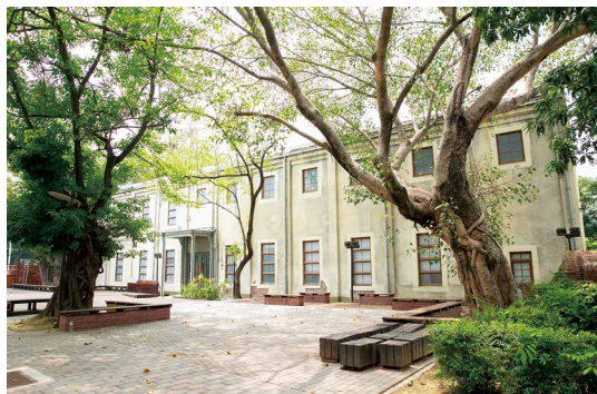
嘉義製材所的發電中心—動力室。(攝影/林鐵及文資處 曾靖惠)