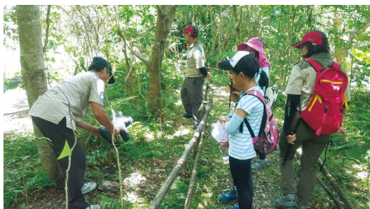
民眾體驗森林護管員執行野生動物受困陷阱解救及相機監測業務。