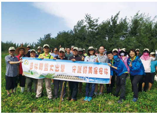
在地志工參與海岸造林活動。