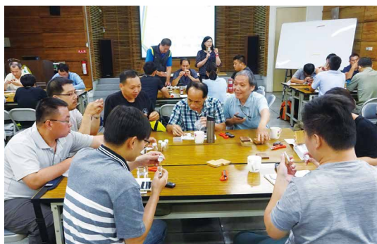
木材辨識鑑定技能研習班學員實務操作情形。