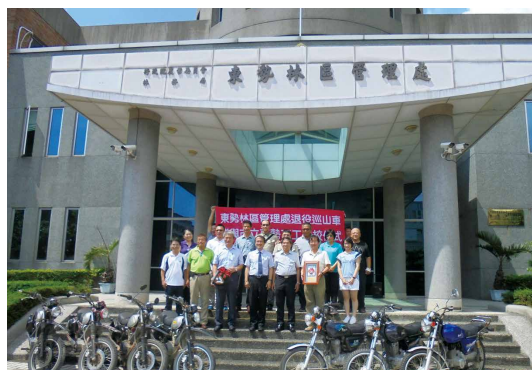
參與贈車儀式人員與車輛合影。