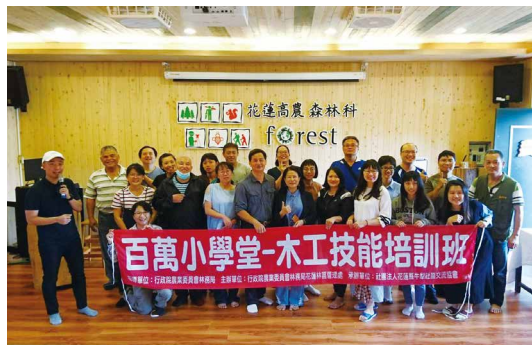
木工技能培訓班在花蓮森林科館開幕。