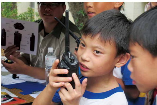
南陽國小學童體驗無線電操作。