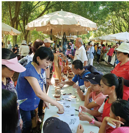
透過「悠遊荷岸咖啡日」活動，推廣東勢林業文化園區及宣導森林多元服務價值、綠色保育等理念。