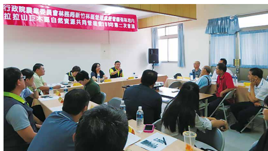
新竹處召開共管會第2次會議。