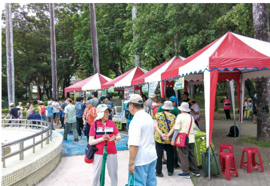
民眾參觀沙蜥解說攤位。