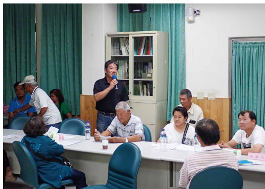
恆春場座談會林農詢問林下經濟問題。