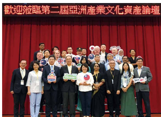
「第二屆亞洲產業文化資產論壇」與會26位專家學者與貴賓大合照。