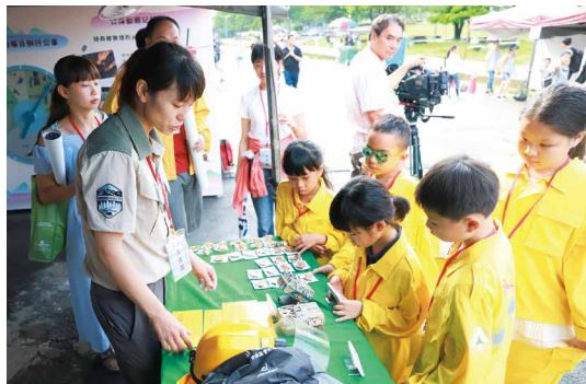
森林護管員透過互動遊戲向小朋友介紹出勤時的裝備。