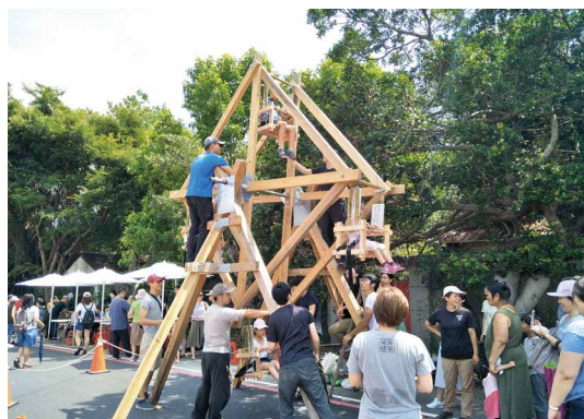
充分展現「木材」特性的國產材原木構摩天輪。