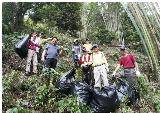
中華民國溪谷運動協會與志工共同淨山。