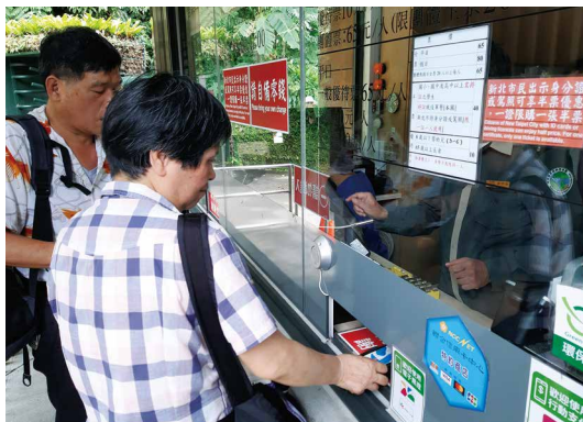
民眾於內洞國家森林遊樂區使用悠遊卡付費購票。