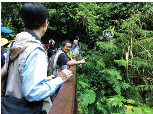
由部落長老帶領遊客認識霞喀羅古道。