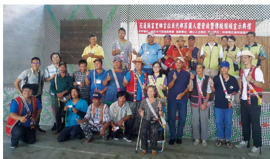
吉拉米代部落與合作團隊合照。