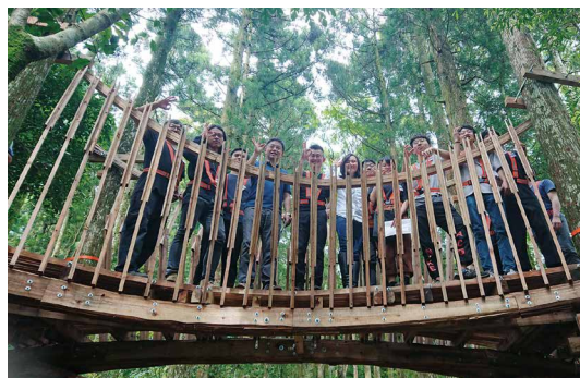
與會人員與淡大建築設計作品「浮森」互動，體驗國產材的美好。