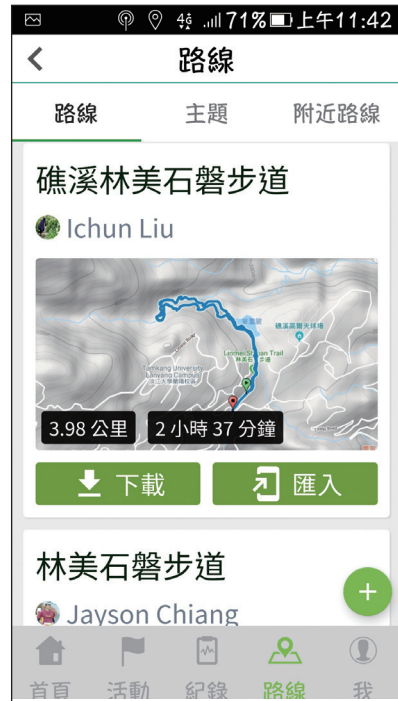
圖1 可以搜尋及下載前人軌跡資訊。