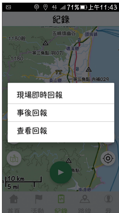
圖7 新增即時及事後回報功能。