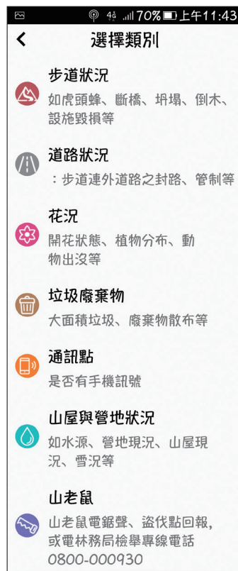
圖8 步道版的公民科學家的回報類型。

然而對林務工作來說，這也是公民科學家的回報記錄功能，在氣候變遷逐漸嚴重的現在，可以藉由讓民眾來記錄，對於後續植物物候的紀錄有重要的參考價值，另外目前育苗工作以適地適種為優先，就算是同一種物種，在不同地理氣候區或山地植群帶都有不同開花結果的時間，若知道該步道何時開花結果，對於編