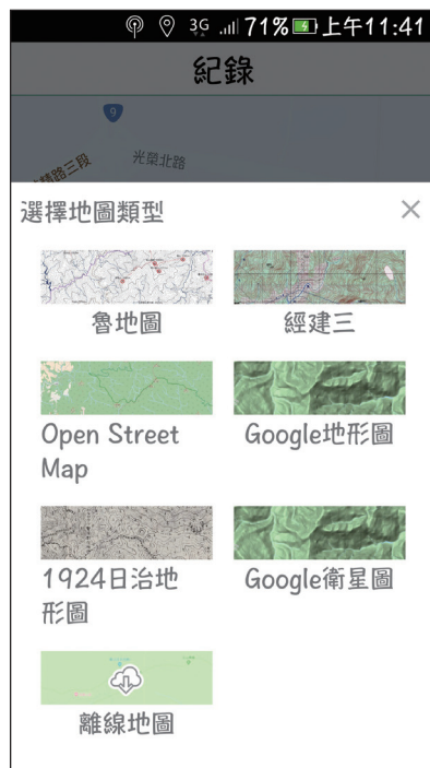
圖5 多種線上地圖可以切換查詢及製作離線地圖。

可使用魯地圖、經建三版地圖、Google地形圖、OSM地圖、1924日治地形圖製作離線地圖（圖5），供無網路訊號之離線使用。地圖範圍可直接以軌跡涵蓋範圍、或是自訂範圍下載。目前Android版可以直接下載全臺離線魯地圖，是最直接最方便的做法。