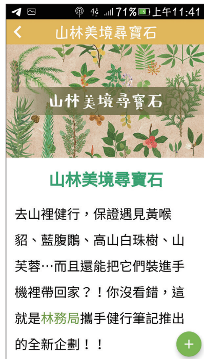
圖2 特殊任務活動有助於民眾走入山林之意願。