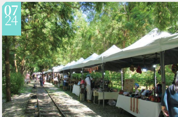
▲林蔭下軌道旁的林田山 Mjiras Dgiyaq市集 (攝影／花蓮林區管理處 李佳容)

■花蓮林區管理處在林田山林業文化園區舉辦「林田山 Mjiras Dgiyaq市集」(Mjiras Dgiyaq為太魯閣族語，Mjiras為「吶喊」，Dgiyaq為「山頂」，象徵過去居住於此的部落族人和曾在此伐木的工人們，在林田山勤奮努力的生活，也因工作環境，常藉由吶喊的方式傳遞訊息)，結合攤商和樂團表演，邀請遊客感受林田山的人文風情。 (花蓮林區管理處 李佳容)