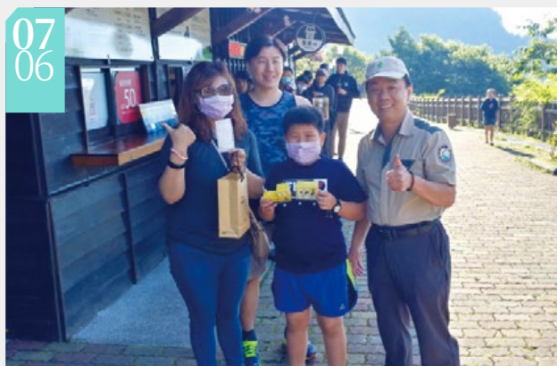
▲搶得頭香遊客與太平山莊經理合影

■太平山國家森林遊樂區內人氣遊憩設施一蹦蹦車，在部分路線暫停行駛近半年後，7月6至9日試營運，並於7月10日正式恢復全線3公里通車。來自新北市新店的遊客6時30分便抵達等候並搶得頭香，太平山莊經理致贈蹦蹦車紀念品，讓遊客欣喜萬分！