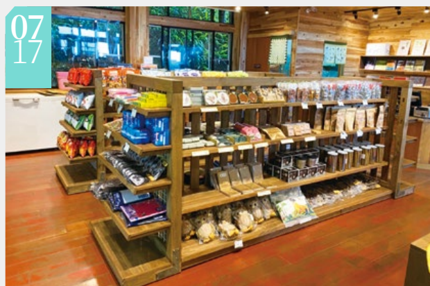
▲以國產材柳杉裝修的販賣部提供遊客必BUY的文創紀念商品

■太平山國家森林遊樂區的太平山莊販賣部近期特別利用轄區內柳杉風倒木，來裝修販賣部壁板及展架，讓販賣部質感再提升，除了達到推廣國產材利用之功能，也能減少碳足跡，展現在地特色。