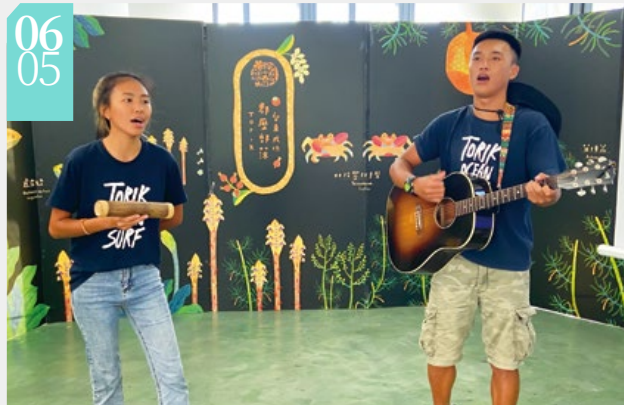
▲都歷部落青年的歌謠傳唱表演

■臺東林區管理處輔導都歷部落推動友善生產、水梯田復育及生物多樣性棲地營造初步有成，於6月5日辦理「都歷 里山里海 x 友善農耕分享會」。分享會中放映兩段部落進行友善生產、水梯田復育及動植物調查監測成果的紀錄短片；部落婦女們更用當地友善生產的食材，現場製作部落風味美食，讓與會前來觀摩的其他部落夥伴及臺東縣的民眾，感受這群來自海邊的農夫們如何體現里山里海的豐足生活。