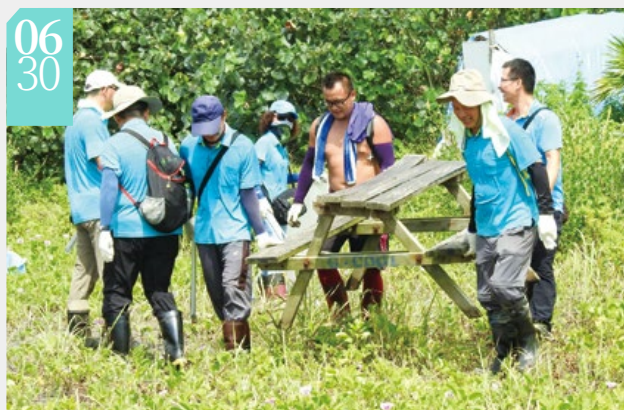
▲協力清出林下廢棄物

羅東林區管理處與東北角暨宜蘭海岸國家風景區管理處、頭城鎮公所、港口社區發展協會及衝浪業者一同撿拾編號2703區外保安林內堆置的遮陽傘、沙發、桌椅、衝浪板等大型廢棄物，以及無所不在的玻璃酒瓶；本次淨灘活動動員50多名人力，共清理出2台垃圾車量的廢棄物。羅東處亦藉此活動提醒附近的衝浪業者做好自我管理，並宣導遊客在享受清涼海水的同時，也應自律不亂丟垃圾，共同維護無敵海景及民眾安全。