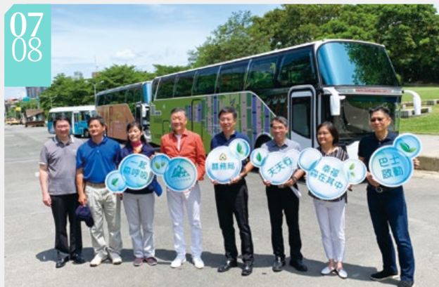
▲林務局與雄獅旅遊集團共同宣告「幸福·森在其中」天天行巴士啟動

■林務局於8日舉辦巴士啟動記者會，與雄獅旅遊攜手合作推出「幸福·森在其中」遊程，主打內洞、八仙山、大雪山、奧萬大及太平山等五大國家森林遊樂區的生態旅遊，共推出20條精選生態遊程，其中11條天天出發，期提供民眾更容易親近自然的旅遊方式，形塑國家森林遊樂區「健康、樂活、療癒」的品牌形象。