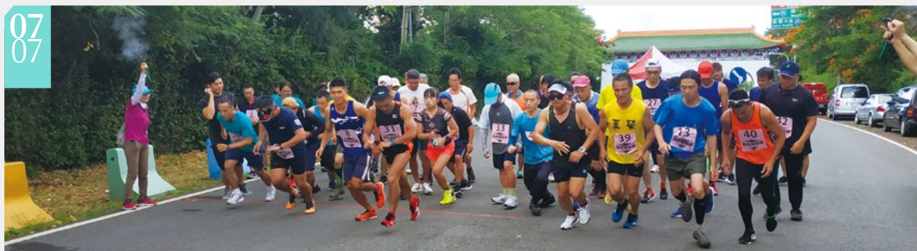
▲越野體能競賽起跑

■為了向堅守第一線保護山林的護管員們致敬，林務局在墾丁舉辦全國森林護衛隊體技能競賽，由副局長廖一光率領來自全臺各地的護管人員共100多人參賽。今年「世界巡護員日」的標語為「我們與森林的距離」，因此競賽的第一項目「越野體能競賽」，請護管員們從墾丁牌樓往上跑到墾丁國家森林遊樂區入口，讓大家從海岸邊越來越接近森林；第二項競賽項目是「定向運動」，考驗護管員在森林中的方向判斷及路線規劃；最後一項競賽項目為「木材辨識」，以跑台方式辨識貴重木及常見次級木之木材標本。經過一番激烈競賽後，由新竹林區管理處獲得總成績第一名，屏東、花蓮林區管理處分居第二、三名。此次趣味競賽除可凝聚組織向心力，促進情誼交流外，並能提升護管員在工作崗位上所需體技能。