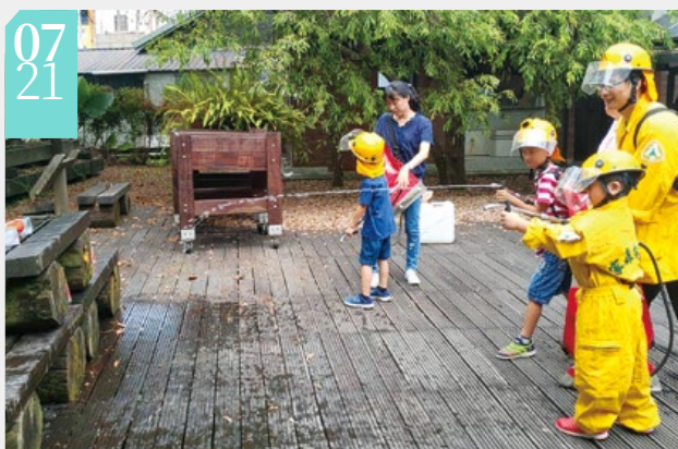
▲小小森林救火隊執行森林救火任務

■羅東自然教育中心舉辦「森林護管－你、我、他！」活動，希望藉由體驗遊戲及講座活動，讓民眾也能成為「一日森林護管員」。活動上午安排趣味闖關的方式讓民眾體驗森林護管員的工作，內容包含負重跑走、樹木調查工作、森林疏伐作業的監督、森林救火隊、查緝盜伐者以及認識臺灣的保安林等關卡；下午則邀請羅東林區管理處資深森林護管員來分享工作甘苦，讓民眾了解如何與森林護管員站在第一線一同保護山林。