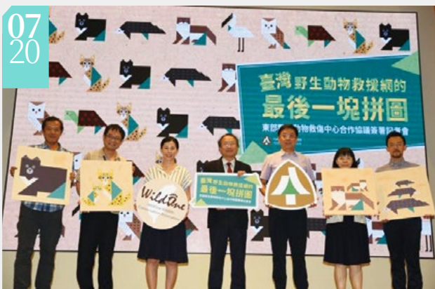
▲野生動物救傷中心合作串聯完整救援網絡

■林務局為強化野生動物救援網絡，20日與社團法人臺灣野灣野生動物保育協會簽署合作協議，共同推動東部第一座大型野生動物救傷中心，為野生動物救援網補齊東部這塊拼圖。未來該中心將全力協助東部地區野生動物救援工作，尤其臺灣黑熊、穿山甲等保育類野生動物的緊急救援與醫療照護，將更能把握黃金醫療時間，提高動物復原野放的機率，保護珍貴的野生動物。