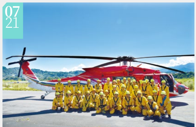
▲陸空聯合搶救森林火災吊掛訓練

■為強化森林火災整備工作，林務局南投林區管理處於7月21至24日於臺中市石岡區亞拓飛行場，會同新竹林區管理處、嘉義林區管理處、內政部空中勤務總隊及消防署特種搜救隊辦理陸空聯合搶救森林火災吊掛訓練，以精進國家森林救火隊救災技能，操演內容包括：森林火災發生時直升機空中物資運送、救火隊員空中吊掛投入火場及滅火水袋裝卸等科目，演練場面逼真。