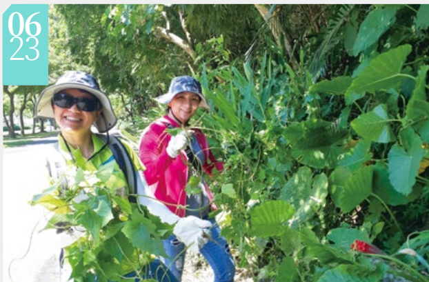
▲結合志工夥伴共同拔除小花蔓澤蘭

■羅東林區管理處與宜蘭縣樹藝景觀所在武荖坑風景區共同舉辦「小花蔓澤蘭防治宣導研習活動」，結合宜蘭縣防治外來入侵植物工作平臺的機關夥伴、綠美化志工及社區民眾，共同打擊有「綠癌」、「生態殺手」之稱的小花蔓澤蘭。活動邀請特有生物中心黃士元博士及天然染、DIY製作專業講師進行教育講習，從實地認識、實際防除及再次利用等活動，帶領民眾了解如何對付小花蔓澤蘭的入侵。