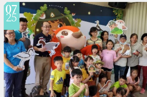
▲《里山在這裡》新書發表會

■嘉義林區管理處推出《里山在這裡》繪本合輯，25日在鰲鼓濕地森林園區東石自然生態展示館舉辦新書發表會。藉由書中主人翁社區林業小幫手「林業嘉」的視角，帶領大家一起瞭解社區夥伴如何實踐里山倡議的精神。現場除