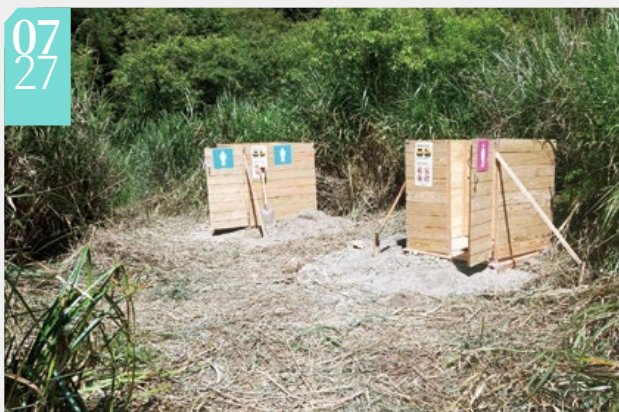
▲眠月線旁已設置大型貓坑

■阿里山林業鐵路眠月線因網路多元傳播，成為熱門的打卡秘境，遊客過度集中所衍生的環境污染問題，嘉義林區管理處已僱工定期沿線清理，並於塔山及石猴車站旁山徑設置大型貓坑（生態廁所），呼籲山友珍惜使用，不要再隨地污染環境，也希望大家幫忙維護廁所設施，為大自然盡一份心力。