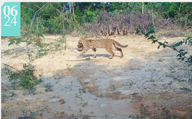
▲居住在苗栗淺山的石虎媽媽與寶寶

為進一步推動國土生態保育綠色網絡建置計畫，新竹林區管理處邀請財政部國有財產署及臺灣環境資訊協會等8個環境保育團體共同參與國土綠網平臺會議，透過平臺運作，讓公部門有機會聽取保育團體的實際需求，保育團體間也能彼此交流關注議題與經營方式。平臺會議過後，新竹處將持續扮演保育人網鏈結的角色，串起更多公私部門、團體的合作，共同攜手建構國土生態保育綠色網絡，為環境永續凝聚更全面性的目標。