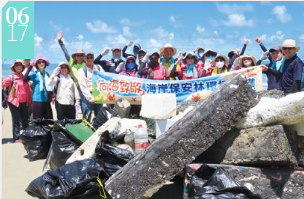
▲「向海致敬」海岸保安林環境維護

■嘉義林區管理處為響應行政院「向海致敬」計畫中的海岸保安林環境維護，特別結合國家森林監測志工共同淨灘，17日於臺南市北門雙春編號第2018號飛砂防止保安林，辦理「向海致敬」淨灘活動，共清理海岸垃圾1,200公斤，以實際行動，讓雙春海岸重回美麗面貌。