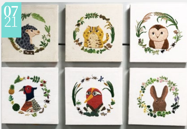
▲「走入里山-里山航行自然書寫創作聯展」刺繡展品（攝影／林務局 羅秀雲）

■林務局與交通部臺灣鐵路管理局自107年起，連續兩年使用EMU800型微笑號通勤電聯車，打造里山動物彩繪列車，乘載著「編織國土生態綠網、讓動物們也能快樂出門平安回家」的理念，開啟國人對淺山野生動物的認識，啟發人們對自然生態的喜愛，進而關心保育、投入行動。列車於109年8月4日卸除彩繪貼膜，林務局與臺鐵局特地再次攜手，7月21日至31日，在臺北車站西側走廊舉辦「走入里山—里山航行自然書寫創作聯展」，以文句、影像、手繪稿、手作刺繡等，呈現里山之美，希望藉由展覽，喚起國人親身實踐保護里山環境的行動，持續在淺山地區與農業區，在建構土地的生態機能之外，同時兼顧到傳統文化、地景、糧食以及經濟，實現人與大自然和諧共處的願景。（林務局 羅秀雲）