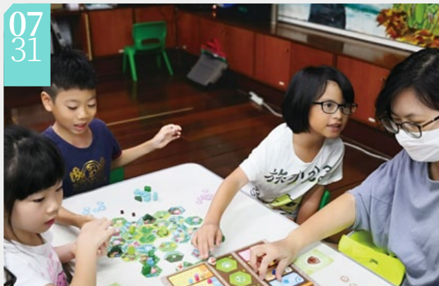
▲親子體驗桌遊互動熱烈

■花蓮林區管理處響應731世界巡護員日，在池南自然教育中心辦理「我們與森林的距離—桌遊體驗活動」，吸引許多親子參加，參與的民眾藉由桌遊了解森林的功能與重要性，也在遊戲中化身森林護管員，從事救火、造林、查緝山老鼠等工作，深刻感受護管員守護森林資源使命感。