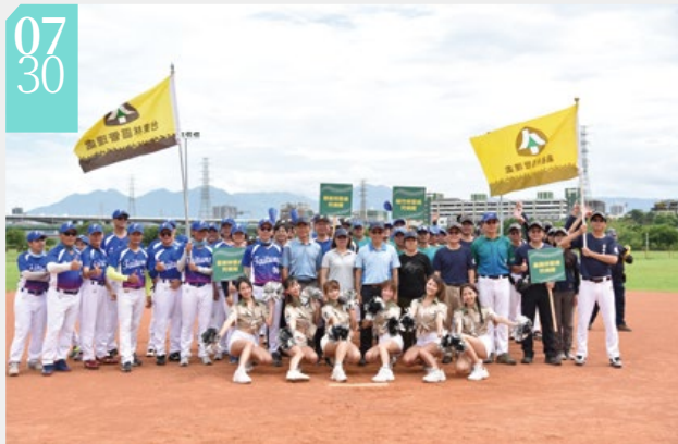
▲林務局慢速壘球交流競賽

■林務局於7月份舉辦所屬機關間慢速壘球交流競賽，並於「世界巡護員日」前夕（30日）舉行準決賽及總決賽。藉由輕鬆、有趣的團隊運動競賽方式訓練森林護管員體能，更讓林務局所屬單位間能相互交流，讓守護山林的堅強團隊更有力量。在精彩刺激的對戰後，本次競賽由臺東林區管理處拿下冠軍寶座，第二名為嘉義林區管理處，屏東林區管理處及新竹林區管理處並列第三名。