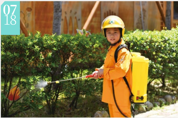
▲小朋友體驗搶救森林火災活動

■東勢林區管理處於東勢林業文化園區辦理「我們與森林的距離－森林巡護體驗活動」，現場安排體驗森林護管員工作項目闖關活動，包含負重跑走、樹種辨識、森林火災搶救、航照判釋等闖關項目，另展示山老鼠冷知識及盜伐木、鏈鋸，以及邀請2位森林護管員現身說法分享工作甘苦談，讓民眾親身感受護管員工作之多元性及辛勞，體驗「一日森林護管員」，寓教於樂。