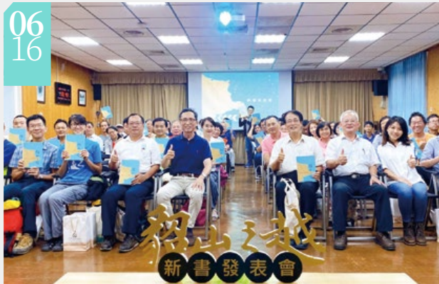
▲《韶山之越—淡蘭古道自然發現史》新書發表會

■2014年羅東林區管理處在太平山林業百週年的發想下出版了《桃色之夢—太平山百年自然發現史》，由於內容另闢蹊徑，有別於林業開發及鐵道懷舊史，大多是國人過去所未知的知識，發行後獲得各界迴響與肯定。2018年在古道延伸的脈絡下，出版了《霧林之歌：宜蘭古道自然發現史》，今年完成《韶山之越—淡蘭