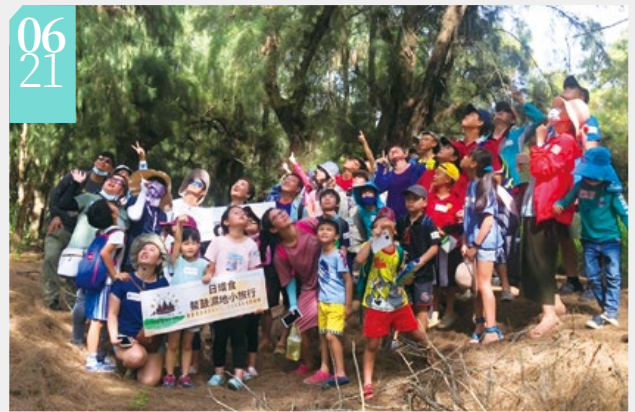
▲悠遊嘉南山海趣一日環食小旅行

■嘉義林區管理處在鰲鼓濕地森林園區港口宮旁生態日晷，與嘉義市天文協會合作辦理「2020日環食－悠遊嘉南山海趣」活動，共架設5部天文望遠鏡觀測日環食動態；由嘉義永慶高中國樂社悠揚琴聲中開場，雲嘉南濱海國家風景區管理處洪肇昌副處長、嘉義縣東石鄉公所蔡武憲機要秘書一同參與日環食觀測開跑儀式，活動中東石高中熱舞社、東石陶笛隊輪番演出，食甚時更有巾幗震天集樂團打響太鼓，象徵與民眾一起趕走把太陽吃掉的天狗！