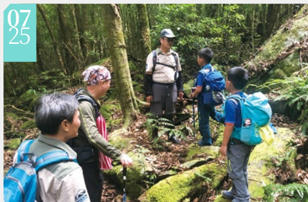
▲森林護管員帶領民眾體驗盜伐案件偵辦的過程與艱辛

■新竹林區管理處在苗栗縣南庄鄉加里山登山步道舉辦「一日巡護體驗活動」，讓社會大眾可以透過親身體驗來了解森林護管員日常工作的點滴，巡護體驗現場由森林護管員介紹護管工作內容，接著由森林調查監測志工帶著大家進行巡護體驗，最後進入牛樟盜伐舊案現場，由森林護管員及保七總隊第五大隊員警分享盜伐案件偵辦的過程與艱辛，體驗民眾皆對森林護管員的工作艱辛留下了深刻的印象。