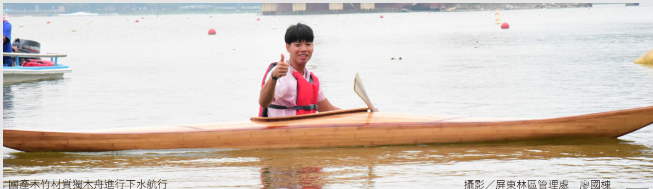
國產木竹材質獨木舟進行下水航行