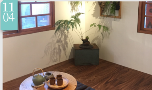
▲ 以臺灣原植物創作植板盆栽為森家增添盎然綠意

新竹林區管理處與龍華科大、中興大學、梧桐基金會、厚食聚落及各界職人攜手合作，於新竹市將軍村策劃「森家不凡—國產材特展」活動，將臺灣生產、臺灣製造的國產材器物、臺灣原生植栽，融入居家生活，展現國產材的多元應用與不凡價值。