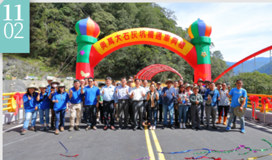
▲ 奧萬大石灰坑橋正式開放通車典禮

南投林區管理處於奧萬大聯外道路7K+600舉行奧萬大石灰坑橋正式開放通車典禮，該橋全長70公尺，寬10公尺，屬於三跨之預力梁及混凝土T型梁之複合型橋梁，該橋橫跨好發土石流的石灰坑，避開易致災路段，終於在克服各種施工困難之情形下竣工。