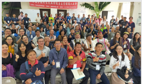
▲ 第三屆全國原住民族狩獵自主管理獵人大會