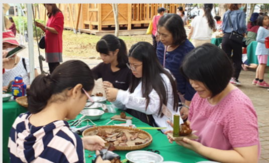
攝影／東勢林區管理處 尤丰君

東勢林區管理處於東勢林業文化園區舉辦「綠色樂活行」主題活動，結合園區導覽健走活動，由志工老師帶領民眾漫步園區享受自然、探尋林業文化史跡；活動中邀請「臺灣石虎保育協會」分享石虎保育相關知識及議題，並辦理有多位友善耕作、木藝創作的夥伴參與的木木市集、利用園區森林手作DIY、集章闖關活動，讓遊客透過輕鬆有趣的方式來認識生態保育及森林多元的服務價值。 （東勢林區管理處 尤丰君）