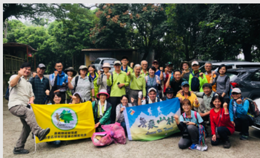
攝影／嘉義林區管理處 吳宗杰

嘉義林區管理處於臺南市關子嶺大凍山舉辦手作步道及淨山活動，邀請臺南地區登山團體、國家森林志工、白河區公所等機關團體約50位，以就地取材方式修整部分步道路段，讓山友及志工人能更深入了解手作步道理念及操作。同日也舉辦淨山活動，清理步道沿線及休憩點環境，提供民眾更清淨優質的步道環境。 （嘉義林區管理處 吳宗杰）