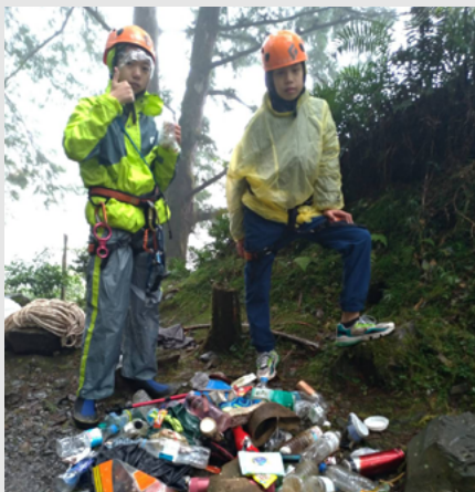
▲ 垂降所撿拾的垃圾及掉落物品琳琅滿目