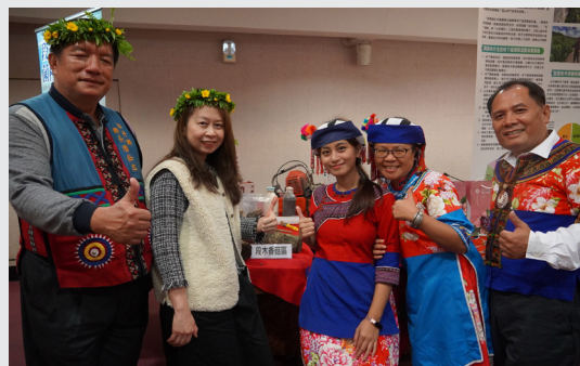
屏東科技大學社區林業研究室 提供