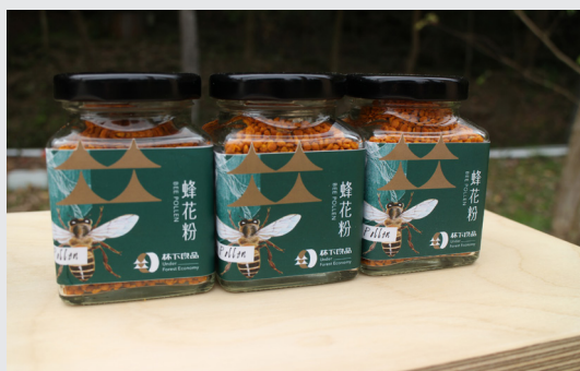
▲ 林下良品產品包裝