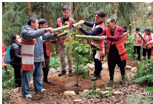
與族人共同復育、澆灌南庄橙

「嘎達釉」是賽夏族對南庄橙的稱呼，意指「媽媽準備好的糧食」，自古以來都是賽夏族重要的生活必備植物，可作為零食，也應用於醫療與祭典等方面，但這臺灣特有種植物「南庄橙」，隨著淺山森林的開發利用，已幾乎於其原發現地絕跡，同時，其珍稀程度屬極度瀕危等級之物種。