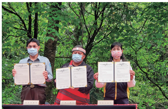
與部落群簽署共管合作備忘錄

新竹處與兩個族群間互動過程與達成的階段性目標雖不盡相同，但透過誤解、衝突、溝通、理解、討論、共識到合作，處內同仁對原住民朋友因過往歷史脈絡所造成的民族性背景有深一層的認知。堅信這樣的認知與了解，能讓同仁未來在面對原住民議題時，更能秉同理心，以原住民的立場、角度與需求，尊重部落想法維持良性溝通，並以平等互惠分享的原則，一起學習、分享權利與承擔責任，共同致力於原民山林傳統智慧文化傳承，追求森林經營與生態保育的永續發展。藉由彼此緊密的合作，共創地方產業與森林資源維護雙贏的永續經營模式。🏠