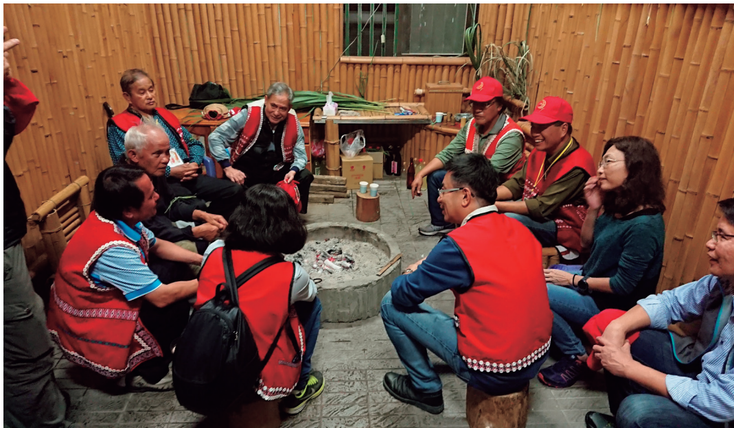
新竹處與賽夏族雙方坐下來對談溝通