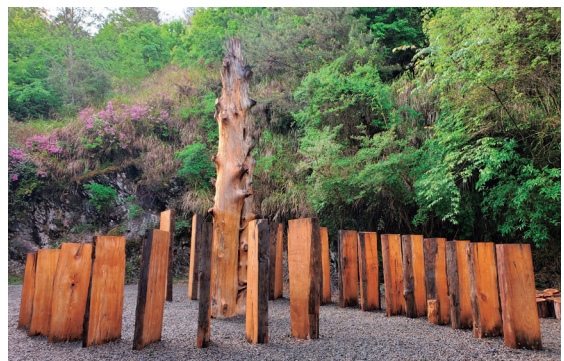
泰雅祖靈紀念廣場

透過泰雅祖靈紀念廣場裝置藝術完成的契機，部落提出應依循傳統儀式，舉辦Sbalay和解儀式，及對未來主張山林資源共同管理機制並簽署備忘錄。為尊重原住民傳統文化，泰雅爾族民族議會、原民會、林務局、新竹處等多個單位，就Sbalay和解儀式辦理方式及內容，於2021年2月至4月間，召開7次會議共同研商規劃。