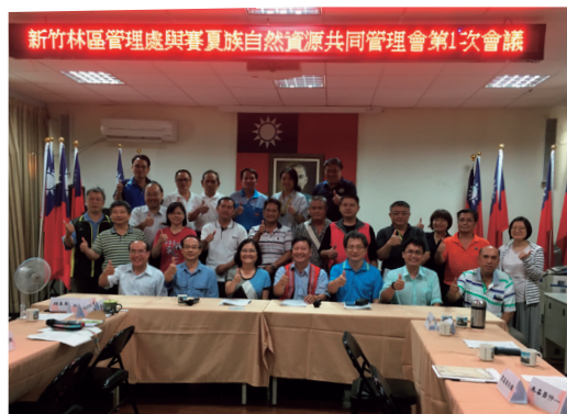
新竹處與賽夏族第1次共管會議

另外，賽夏族為傳承傳統文化，依循「原住民生活慣俗採取森林產物規則」，由新竹縣五峰鄉賽夏族文化藝術協會提案申請國有林產物「臺灣檫木」作為賽夏族祖靈祭、矮