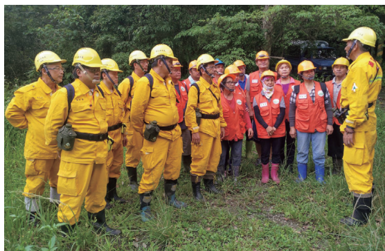
部落加入森林救火支援隊演練