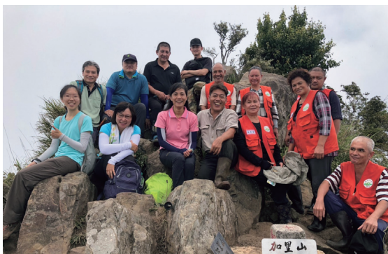
新竹處與部落攜手巡守周邊國有林