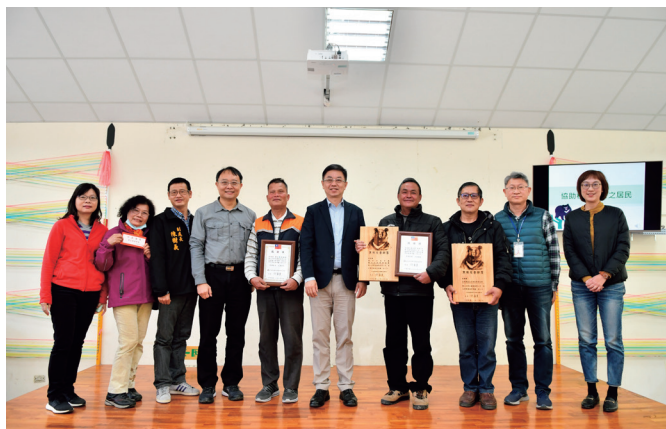
▲ 將臺灣黃藤仔細剖好的藤片，細細編織成男人的背籃（Tokan）（麻必浩部落提供）