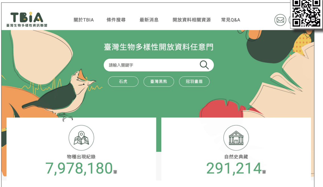
TBIA 資料庫共通查詢系統首頁設計。

單靠TaiBIF小規模團隊的一己之力是遠遠不夠的，也因此，臺灣生物多樣性資訊聯盟（Taiwan Biodiversity Information Alliance, TBIA）的成立為這樣的困境帶來一絲曙光。TBIA為由中研院生物多樣性研究中心（TaiBIF團隊）、特有生物研究保育中心（臺灣生物多樣性網絡TBN團隊）、林務局、海洋保育署、林業試驗所、營建署（國家公園及濕地資料庫團隊）等國內收集、管理及利用生物多樣性資料的主要公家機關，於2021年9月29日共同簽署MOU正式成立，最大的目標之一便是透過跨單位的合作，設計一套可行的資料流通整合模式，善用各單位專長互補長短的精神，串連國內主要的生物多樣性資料庫，以建構去中心化