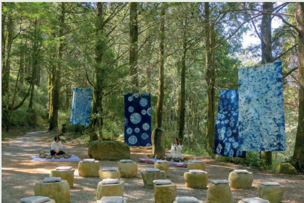
■ 行走在阿里山新秘境「水山療癒步道」，感受森林帶來的療癒氛圍，讓心靈沉浸在與森林間的對話。（林業保育署嘉義分署提供）