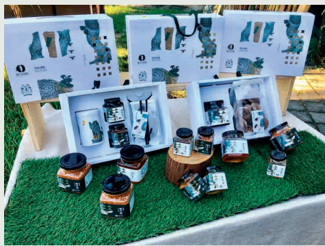
■ 來自阿里山的林下良品—蜂蜜、段木香菇、蜂花粉、金線連茶可謂森林系美味。

林業保育署的署徽中心代表人，也代表樹，而這個樹的意象是向林務局局徽致敬，象徵傳承。署徽上方的藍帶與下方的綠帶，分別代表水與森林。署徽想表達的意念，就是人與山林所形成的林產業，都是依附於永續循環的自然生態，和諧共生，而林業保育署所揭櫫的嶄新任務及目標，也已對應到我們新的組織設計。