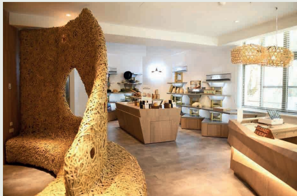
■ 八仙山國家森林遊樂區將國產木竹材融入遊客中心設計，在室內也能感受滿滿的山林氣息。（林業保育署臺中分署提供）

我們有兩個以保育業務為主軸的單位—保育企劃組及保育管理組，前者原為林務局的森林企劃組，負責國有林區保育與生產的空間規劃及森林經營方針的擬定，新的保育企劃組將再擴大量能至國有林區外的全臺保育空間規劃，並由保育管理組負責各項保育工作的推動執行，包含自然生態系的維護管理及野生動植物的保育利用。