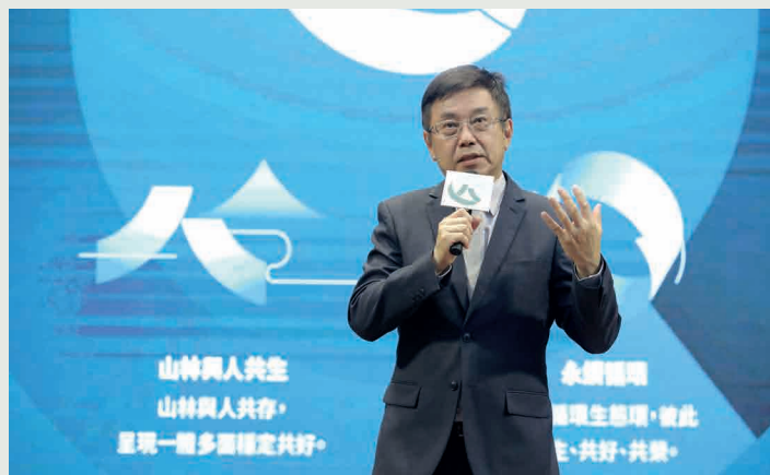
■ 2023 年 8 月 14 日林業及自然保育署揭牌典禮，署長林華慶說明機關未來發展目標。

比如說臺灣竹林面積有 18 萬公頃，在 2050 淨零碳排的挑戰下，豐富的竹材會是未來極其重要的戰略性綠