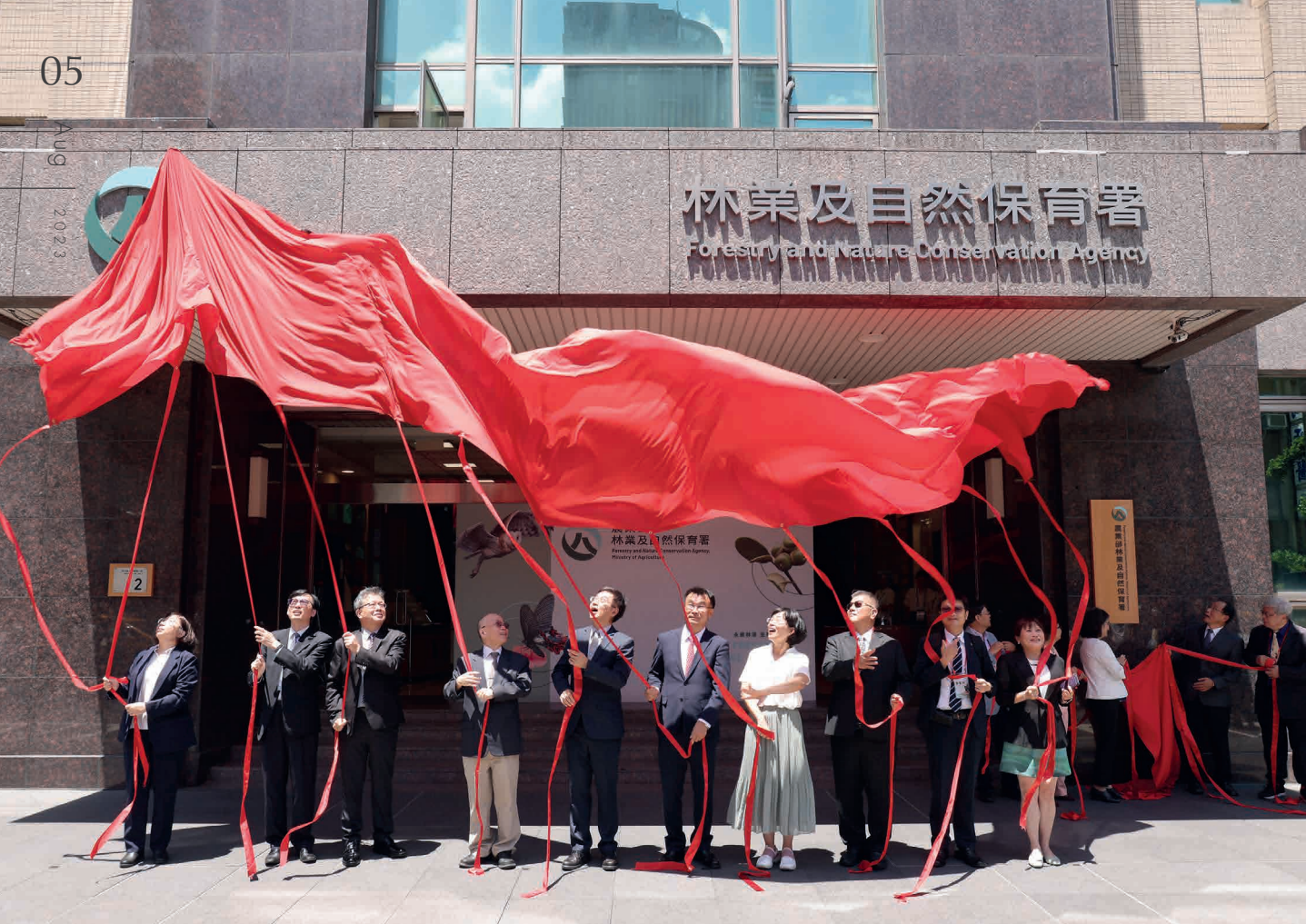
■ 林業及自然保育署揭牌儀式