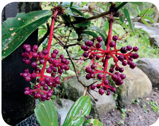
■ 南迴公路一帶的臺灣原生瀕危植物「野牡丹藤」果實。