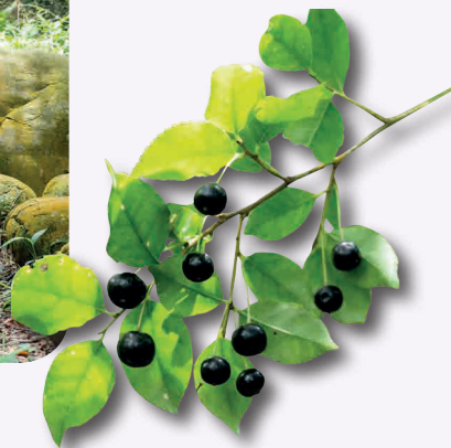
「燈稱花」果實。