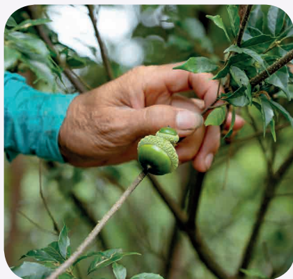
「大坑風景區」5 之 1 步道路旁即可見到臺灣特有種「小西氏石櫟」。

黃群洲談到，「大部分林木是春天開花、夏天結果、秋天採種」，採種得從 8 月忙到隔年 1、2 月；採種大多是採取種子，但像「風箱樹」因不易授粉結果，也會剪取枝條、再扦插育苗。他說，枝條要有兩個「目」（節間），「一個生根、一個開葉」。