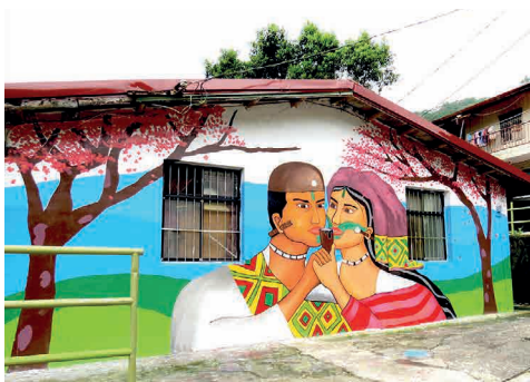
■ 福山—在泰雅族的祖居聖地內感受原住民的文化風采