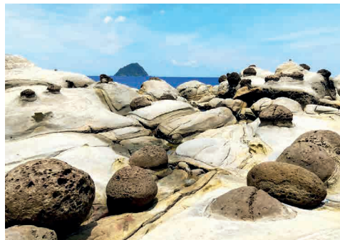
■ 和平島地質公園緊鄰阿拉寶灣，此處地質型態甚為豐富。