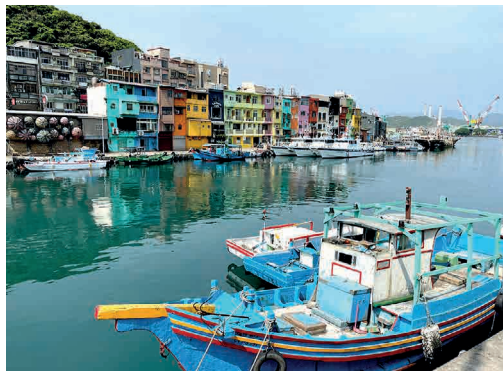
正濱漁港曾是臺灣的第一大港，如今以彩色街屋聞名。

基隆獨特的港都風情，從一艘艘載著經濟貿易的輪船開始，勾勒出 400 年裡不同的歷史航線，累積不同人文的生活風貌，進入陽明海洋文化藝術館穿梭船艙與貨櫃，體驗海運人的移動生活。而