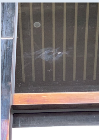
■ 現場可觀察到窗戶上留有褐鷹鴉撞擊的痕跡