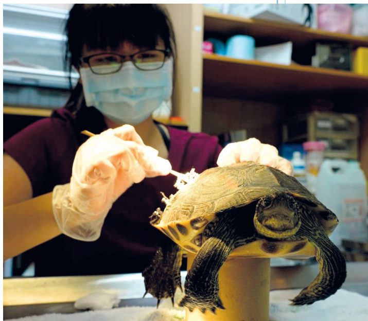
■ 臺灣斑龜被車子壓破殼，正在進行補殼手術後的術後照顧。

野生動物醫療不同於寵物及家畜，救助的動物大小不一、種別繁多，並且相關文獻通常非常稀少，對於獸醫師而言往往是巨大的挑戰。另一方面，為了讓這些動物能夠順利返回野外，需要搭配專業的野放訓練師、照養員，以及瞭解野生動物的習性，才能將動物野放回適當的棲地。野生動物救傷與保育是一項充滿挑戰且意義重大的工作。在醫療過程中，獸醫師們不僅學習到各種動物的救治技巧，提升醫療技術，還能瞭解野生動物們所面臨的環境威脅。野生動物救傷不僅僅是為了個別動物的健康，更是為了整體生態系統的平衡與人類的福祉。透過不斷完善救傷系統和宣導教育，希望能喚起更多人對野生動物的關注與保護，共同創造更安全的生存環境。🌱