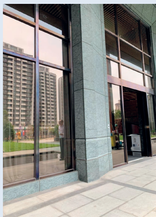
■ 新建公寓大廳外頭的大片玻璃窗容易成為鳥類窗殺的撞擊熱點。