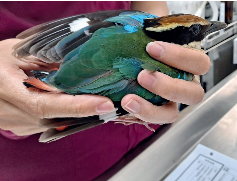
■ 替保育類八色鳥進行理學檢查