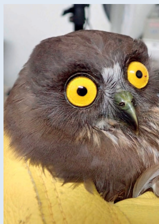
■ 在野生動物診所等待康復的褐鷹鴉

讓褐鷹鴉免於在野外因為人類原因而死亡，可以順利地回到野外。「傷害補償」正是野生動物救傷重要的功能之一。此外，這隻褐鷹鴉的治療過程也都有被完整記錄下來，使用在教育宣導的教案中，希望能夠藉由告訴大眾這隻鳥兒的故事，喚起大家對鳥類窗殺的議題的重視，並且鼓勵民眾親自動手改造窗戶，面積不大的窗戶，可在窗外懸掛垂墜物，或遵循長寬 5x10 cm 的間距原則黏貼圓形貼紙，就能有效改善窗殺。期待可以藉由大眾的行動，來減少後續鳥類因為撞擊窗戶入院的機會。