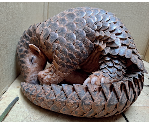
■ 入院等待檢查的穿山甲

讓褐鷹鴉免於在野外因為人類原因而死亡，可以順利地回到野外。「傷害補償」正是野生動物救傷重要的功能之一。此外，這隻褐鷹鴉的治療過程也都有被完整記錄下來，使用在教育宣導的教案中，希望能夠藉由告訴大眾這隻鳥兒的故事，喚起大家對鳥類窗殺的議題的重視，並且鼓勵民眾親自動手改造窗戶，面積不大的窗戶，可在窗外懸掛垂墜物，或遵循長寬 5x10 cm 的間距原則黏貼圓形貼紙，就能有效改善窗殺。期待可以藉由大眾的行動，來減少後續鳥類因為撞擊窗戶入院的機會。