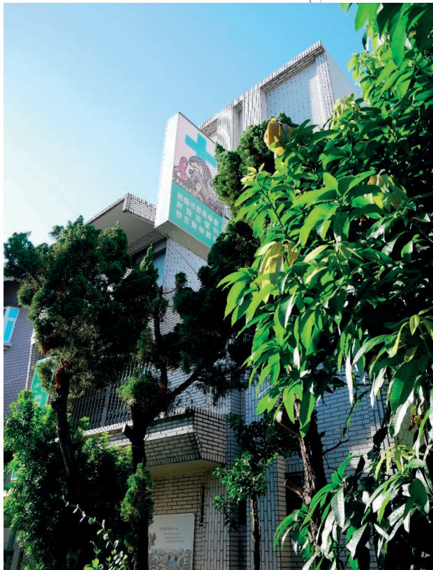
■ 桃園市野鳥學會附設非營利野生動物診所