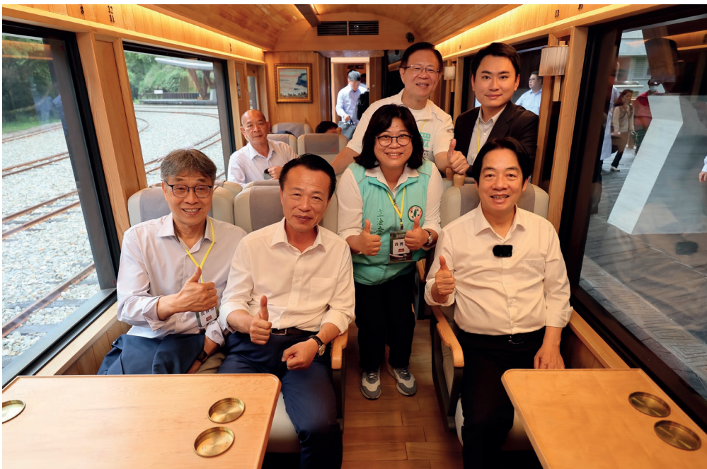
■ 總統賴清德（右下）搭乘福森號視察

行車安全，也有助於環境永續。同樣的，新建 42 號隧道也採取尊重自然生態的先進減法工程。由於位在二萬平偏遠山區，須克服腹地狹小，施工困難的問題，同時也保存了既有隧道洞口，展現維護文化資產等特色，更因此獲選「優良隧道工程獎」。今年 5 月 17 日，42 號隧道終於竣工啟用，也代表林鐵全線通車的準備工作完滿達成。