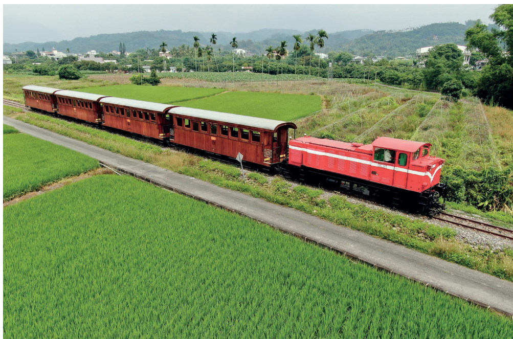
■ DL-34 號由修理工廠完成檢修後，進行試運轉確認車況。

除了車站修復，誠如總統賴清德自任行政院長以來就對林鐵所做之基本要求指令：安全至上！阿里山林鐵陸續完工的沿線邊坡整治，從樟腦寮站、獨立山站、與第一分道到二萬平站的邊坡穩定治理工程，不僅保障了