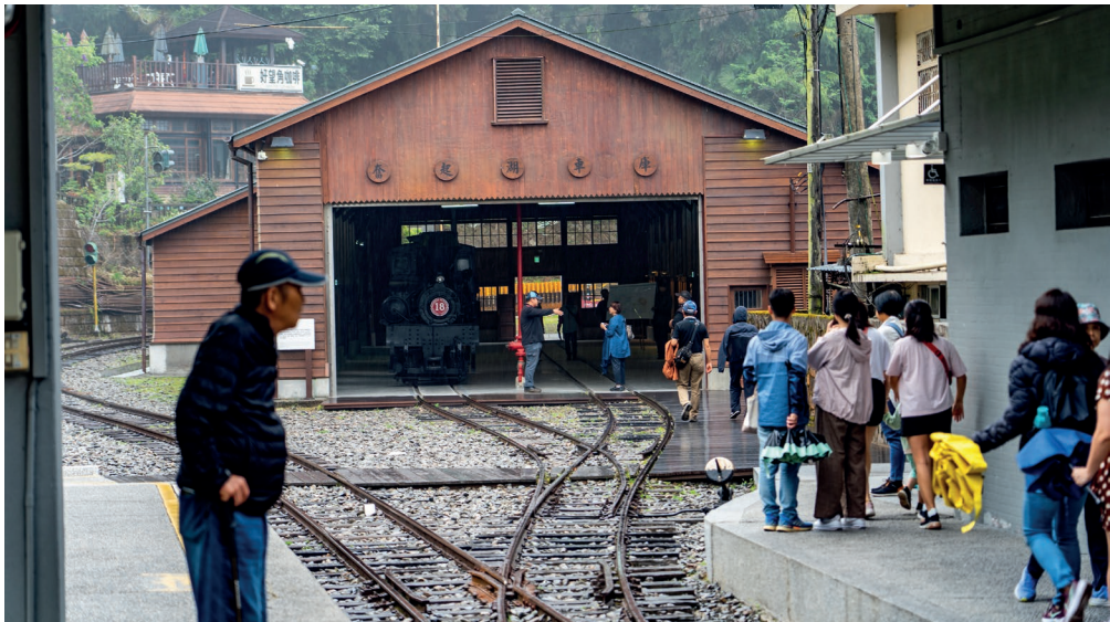
■ 阿里山林業鐵路每年吸引無數遊客慕名前來

亦積極協助辦理沿線「特色小站」主題列車活動，包括十字路、水社寮、交力坪、多林、竹崎、梨園寮、鹿麻產等各個車站及相鄰社區。