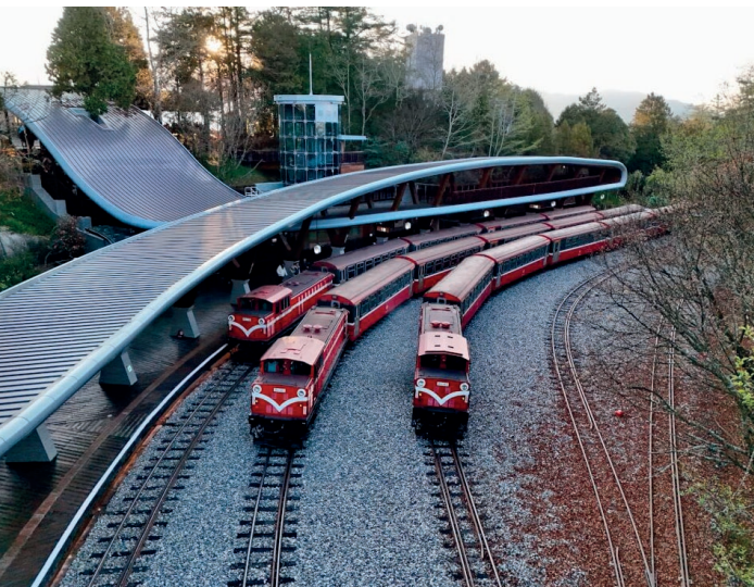
■ 祝山車站建築特色以飛繞的雲浪造型屋頂，象徵迎接日出破曉。

檜生長，採取生態檢核的縮小與迴避措施；透過邊坡的維護，將舊月臺向外延展，順應地形的月臺更兼具觀景