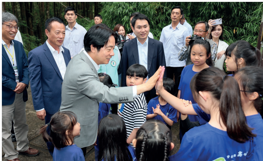
■ 總統賴清德（左 3）視察三代木與民眾互動

在這全線通車、全球歡欣關注的感動時刻，隨著林鐵華麗轉身，重新出發。我們也以此和這片美麗山林一起許願，願能永續平安地，邁向下一個百年盛世。🌿