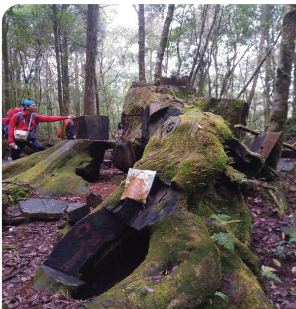
■ 水漾森林、千人洞路線上的舊林政案件現場。

同年年底，為持續推動計畫並邀請學生社團再次參與，臺中分署與工作站的承辦人員親赴國立中興大學拜訪當時任社長及其幹部團隊，積極說明社區林