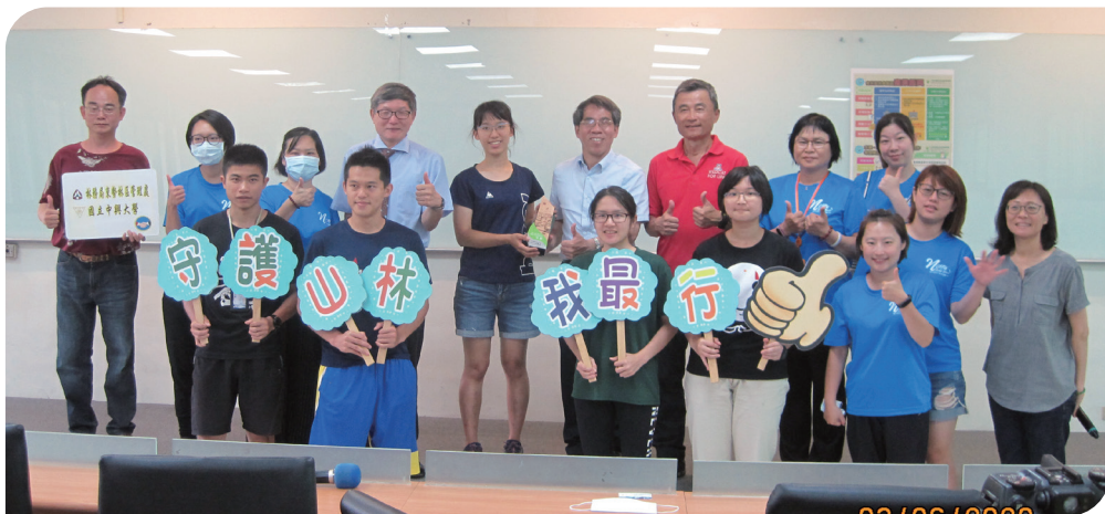
■ 國立中興大學登山社獲頒 2019 年社區林業計畫特優社區表揚活動

業計畫的宗旨、執行內容與參與方式，並針對計畫執行中的彈性與支持機制提出具體說明。在充分溝通與社團內部討論後，登山社決定重啟合作，成功申請 2023 年度的計畫，並延續至今。