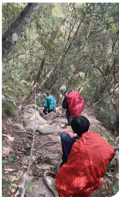
■ 東卯瀑布上捎來西南稜下屋我尾行程