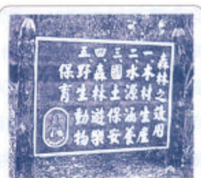
圖25所示，台林旅遊公司為林務局福利委員會之經營機構，即以之為公司標誌。又民國50年代，省營「台灣大雪山林業公司」使用

此一局徽使用期間當為民國50~60年代；但在同期間(民國50年代)，林務局亦曾採用「台林」模式標誌作為局徽，如