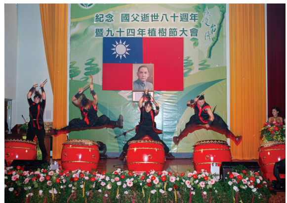
▲植樹節大會精彩的表演節目。

麗的成績單。尤其3月5日在嘉義縣民雄鄉中正特區所舉辦的回「嘉」種樹活動，有許多家長帶著小朋友親手植樹，藉由家庭傳遞植樹的正確觀念，讓我們感到相當欣慰。一個家庭種一棵樹，一個社區就有好幾百棵樹，500個社區那就有上萬棵樹。這些家庭和小朋友都是未來的植樹尖兵，是台灣綠美化的希