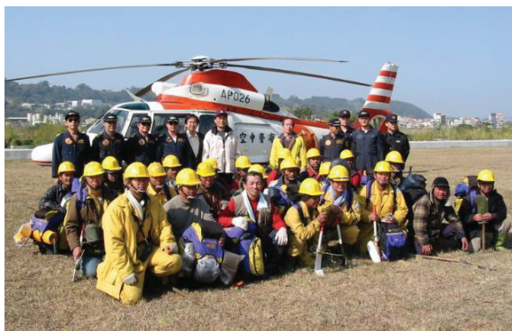
圖9 空中警察隊直昇機協助救火隊員後撤

任務可以說是告一段落，林務人員守護臺灣這片美麗的森林是我們永遠的使命，霜雪陪伴著我們踏過無數個山峰，烈火中揮汗灑落大地，點點滴滴永藏在心頭，在這次的任務當中，不論在裝備或者任務執行上仍然有很多調整修正的空間，倘若林務局今年召開二次森林火災會議的決議能確實執行，相信救火成效更能提高許多。謝謝先進們惠予指正，感謝參與救火的所有救火隊員、補給隊及不眠不休積極籌備各項工作的後勤人員、林務局森林火災防救中心指揮官及幕僚人員，另特別感謝空中消防隊、國軍海鷗救難大隊及空中警察隊的鼎力相助，使本次陸空合作搶救森林火災的任務得以完滿達成，在此謹以此文致上至高的感謝之意。🚁