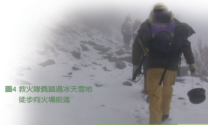
圖4 救火隊員踏過冰天雪地 徒步向火場前進

在停機坪因為冰雪風雨又濕又冷，能避風的場地過小，安置人員過夜是一個問題，在此時早上由28k工寮出發的人員也已經抵達233林道4.5k的工寮，這時林志銓決定由黃錦琳、陳代偉、雙崎工作站王村田及12名造林工人在停機坪旁的造林地內過夜；林志銓、董欽淮及張厚添走回4.5k工寮和後來的人員會合過夜。在停機坪的15個人利用現有的芒草及所攜帶的帆布搭起一個臨時的茅草屋，不但可以擋風且可以擋些許的雨，再加上所攜帶的露宿袋，也算是一個可以安心過夜的地方。在4.5k的舊工寮內，因為年久失修，