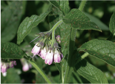
▲照片1 康復力。

以上，而在野化的種數上，以菊科植物為最多，其次是禾本科植物，第三為豆科 (Leguminosae) 植物。本次調查之初步結果亦顯示出菊科及禾本科植物之野化能力強，成為本遊樂區之外來野化植物中強勢的類群。