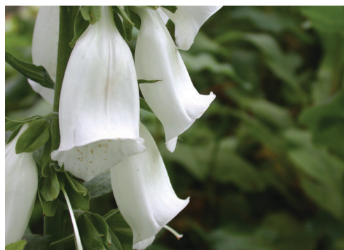
▲照片5b 毛地黃-白色花冠。

特性，莖高約90-150公分，直立而不分枝。葉卵狀長橢圓形，莖下部之葉具葉柄，上部之葉無柄或具短柄，葉緣有鋸齒，葉面皺縮，花萼5裂，花冠長鐘形紅色，亦有少許白色花冠之植株 (照片5b)，有紅色之斑點，二強雄蕊，蒴果具宿存萼，種子小而多，為冬枯型植物，在本遊樂區中每年11月至翌年3月為「冬枯期」，4月根株部為綻放新芽，成為新的植株，主要的花期在4-9月，開花時到處可見如成串倒掛鈴噹般的花朵，風中搖曳美不勝收，亦不時有熊蜂穿梭於群花間。植株花開雖美，但毛地黃全株有毒，不可任意碰觸。