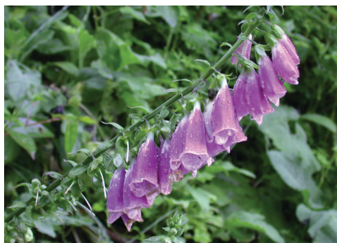
▲照片5a 毛地黃。