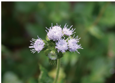
▲照片7 紫花藿香薊-花。

外來種轉化成入侵種之過程中，外來種引入會出現二種狀況，其一，外來種無法適應當地的環境，或受到當地本土種的排斥，族群不能自我維持，導致引入失敗 (fails in transport)；另一種情況則是外來種建立了自行繁衍族群或自我維持族群 (self-sustaining population)，稱之為成功建立 (estab-