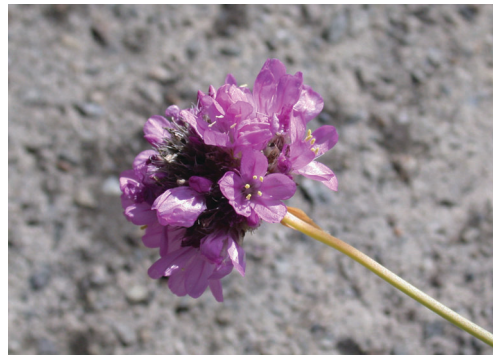
▲照片3 海石竹-花。

於41K船型山附近的有落葵、山葵及銀膠菊 (照片2)；僅分布於43K鞍馬山莊附近的有非洲鳳仙花、大波斯菊及柳葉馬鞭草；僅分布於49K小雪山莊附近的有野燕麥、松葉佛甲草、芹葉牻牛兒苗、歐洲黃菀、西洋蒲公英及海石竹 (照片3)。