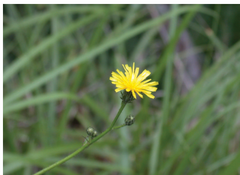
▲照片6 貓耳葉菊-花。

特性，莖高約90-150公分，直立而不分枝。葉卵狀長橢圓形，莖下部之葉具葉柄，上部之葉無柄或具短柄，葉緣有鋸齒，葉面皺縮，花萼5裂，花冠長鐘形紅色，亦有少許白色花冠之植株 (照片5b)，有紅色之斑點，二強雄蕊，蒴果具宿存萼，種子小而多，為冬枯型植物，在本遊樂區中每年11月至翌年3月為「冬枯期」，4月根株部為綻放新芽，成為新的植株，主要的花期在4-9月，開花時到處可見如成串倒掛鈴噹般的花朵，風中搖曳美不勝收，亦不時有熊蜂穿梭於群花間。植株花開雖美，但毛地黃全株有毒，不可任意碰觸。