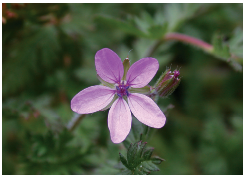
▲照片4 芹葉牻牛兒苗-花。

35K收費站附近之康復力是早期引進栽植之藥用植物，適應環境後而能自行繁衍下一代，康復力之葉形與毛地黃極為相似，其在未開花時，常常被誤認為是毛地黃，在觀察期間發現其族群僅限於35K收費站旁，明顯無擴張之現象。在41K船型山附近的落葵及山葵為早期林業人員自行栽植之食用植物，落葵生長於員工宿舍旁，其有逐漸擴張之勢，但僅以緩慢之無性繁殖的方式擴張，而山葵僅著生在舊苗圃地上方水源地附近，無明顯擴張之現象；另外本遊樂區於2004年首度於鞍馬山工作站辦公室旁發現之銀膠菊，其原產於美國南部、墨西哥、宏都拉斯、西印度群島以及南美洲，於1980年代才被証實歸化，現在不少荒地均可見大片分布，而其引入本區域之原因可能是經由之新植草皮夾帶進入，植株僅有3株，植株高度20-30公分，明顯比低海拔之植株來得矮小，同一個區域在2005年的觀察中發現植株已達6株，有繼續擴張之可能性，有待進一步觀察。43K鞍馬山莊附近非洲鳳仙花、大波斯菊及柳葉馬鞭草等3種歸化植物主要是觀賞用途，