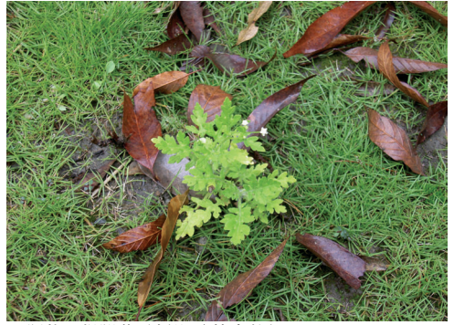
▲照片2 銀膠菊。