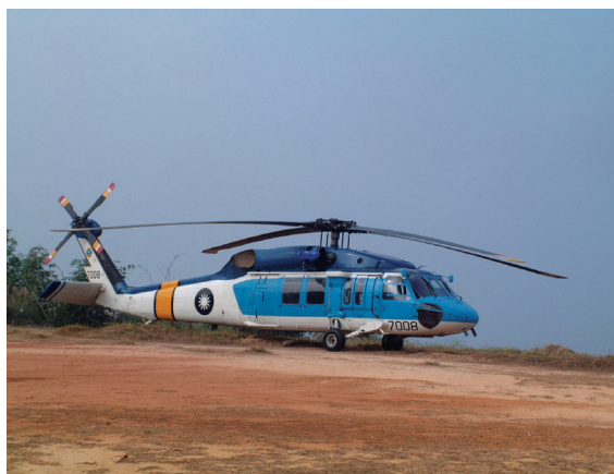
▲空中救護隊之S-70C型直昇機。

雖然多年來林務局在森林火災搶救上，曾陸續引進了直昇機空中滅火機制，但因機種及數量不足，成效未顯，直至2002年6月消防署空中消防隊成軍，因直昇機機種及數量充足，成為協助森林火災防救的生力軍，又逢空中消防隊成立前（2002年5月）台中縣發生了武嶺森林大火，直昇機發揮了空中勘察、灌灑及運補功效，2002年11月南投縣奧萬大亦發生森林火災，因其屬森林遊樂區敏感位置，當機立斷向空中消防隊請求直昇