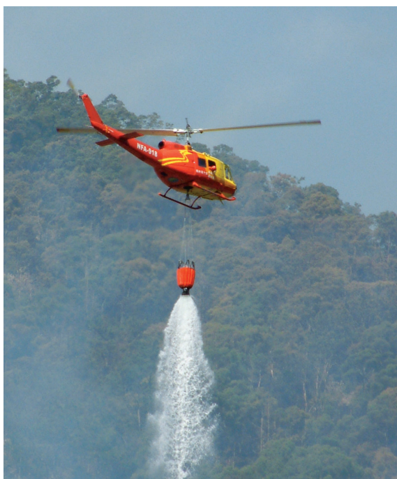
▲UH-1H型直昇機空中滅火。