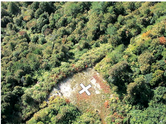
▲機降滅火法—於高山地區設置臨時起降平台供救火使用。

空中滅火之一大利器，而臺灣曾於1964年成立森林空降救火隊，惟臺灣山區地形陡峭，成效不彰。