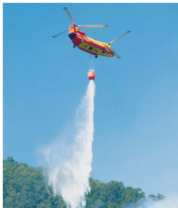
▲B234型直昇機空中滅火。

砍或開闢防火線、引火回燒等間接方式撲滅森林火災，尚可利用固定翼飛機或直昇機至火場附近水庫、湖泊、河流、海上、或人工池塘取水，直接將水源運送至火場上方進行空中灌灑作業。