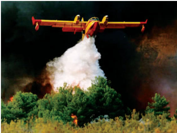
▲水轟炸機滅火法。