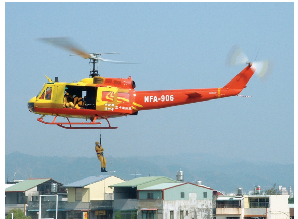
▲索降滅火法—直昇機吊掛訓練。

機降滅火法為利用直昇機將地面救火隊員迅速送至火場附近，俾能在最短時間趕赴火場撲滅森林火災，此法極適用於臺灣之陡峻地形及中央山脈不易到達之林地，林務局亦為配合機降滅火，已在全台山區設置直昇機臨時起降平台60處，並將座標位置及現況等建立資料庫，每年編列經費辦理整修工