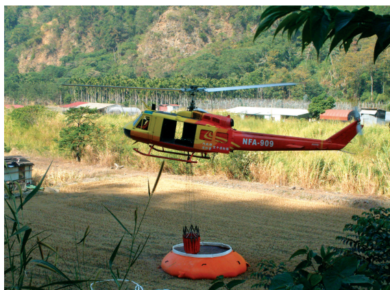
▲UH-1H型直昇機至開口式水袋取水。