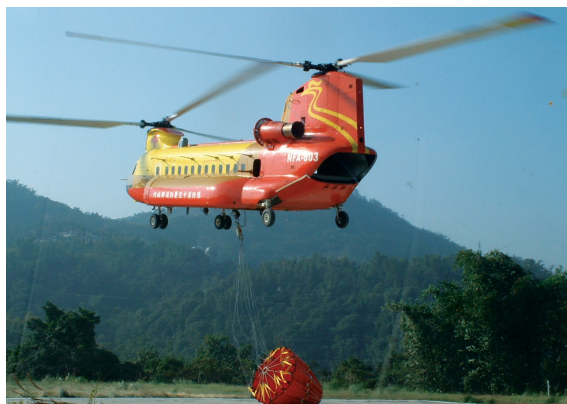
▲B234型直昇機裝置7噸之開口式水袋。