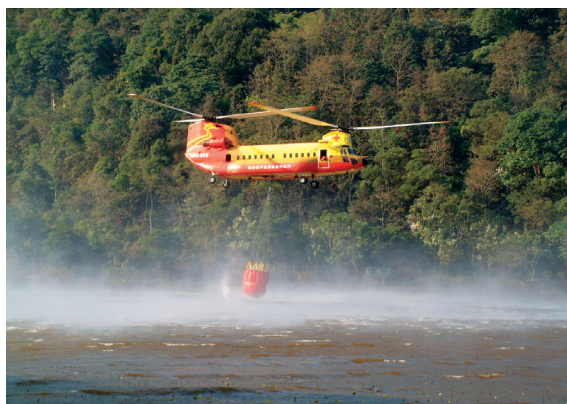
▲B234型直昇機於水庫取水情形。