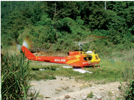
▲機降滅火法—於高山地區設置臨時起降平台供救火使用。