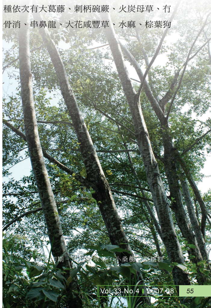
▲演替初期—臺灣涼喉茶—小桑樹型植群。

本植群型共計有11個樣區，區分為4個亞型台灣月桃—大葛藤亞型 ( Alpinia formosana — Pueraria lobata subsp. thomsonii subtype) 通脫木—水麻亞型 ( Tetrapanax papyriferus — Debregeasia orientalis subtype)、臺灣油點草—水麻亞型 ( Tricyrtis formosana — Debregeasia orientalis subtype)、南投涼喉茶—小桑樹亞型 ( Hedyotis hedyotideia — Morus australis subtype)，共同特徵種為芒、小桑樹，上層優勢種有台灣赤楊、水麻、小桑樹、通脫木，地被優勢種為芒，其他5% - 2%之重要值的地被優勢物種依次有大葛藤、刺柄碗蕨、火炭母草、有骨消、串鼻龍、大花咸豐草、水麻、棕葉狗