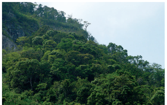
▲ 演替中期-瓊楠-小葉白筆亞型植群。

本植群型共計有6個樣區，區分為2個亞型瓊楠-小葉白筆亞型 ( Beilschmiedia erythrophloia - Symplocos modesta subtype)、柏拉木-黃藤亞型 ( Blastus cochinchinensis - Calamus quiquesetinerivus subtype)，共同特徵種為三葉山香圓、鬼石櫟、鵝掌柴，上層優勢種有鬼石櫟、鵝掌柴、長尾尖葉櫛、柏拉木、山龍眼，地被