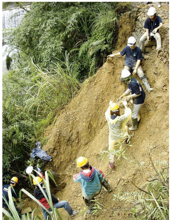
▲桶后越嶺道工作假期活動。

改善、沖蝕路面修復等。參與志工來自社會不同社群，包括退休人員、大學生、上班族等共18名，並需自費2,000元。