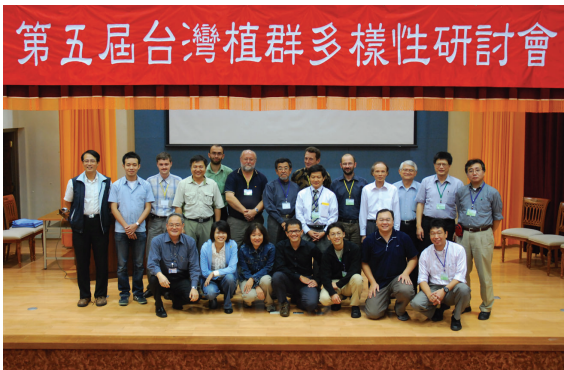
▲第5屆台灣植群多樣性研討會與會專家學者及參加人員合影。

國內外植群專家經驗交流及討論的機會，林務局與台灣生物多樣性保育學會於96年10月25、26日，在林務局2樓大禮堂舉辦「第5屆台灣植群多樣性研討會」。本次研討會不但有「國家植群多樣性調查及製圖計畫」研究團隊成員，發表歷年來累積調查資料的分析研究報告，更有來自捷克、南非、俄羅斯及日本等4國共11位國外植群專家發表9篇植群相關研究報告，藉由本研討會來作為國際植群研究學術交流的平台。