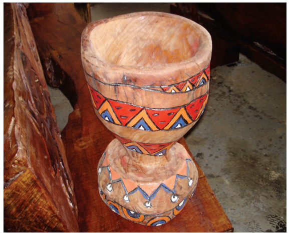
▲漂流木創意花盆。（屏東林區管理處提供）

外形不定及強度偏低又極不均質等缺點。凡此皆不利於工業應用，再加上其數量不固定，民間業者常裹足不前。因此，以漂流木的特質為基本考量，或以造形設計為應用導向等理念，施以適當的加工。本次展示作品中創意木椅、花架及花盆等計約45件成品，件件不同，可引發人們不同想像。（編輯部）