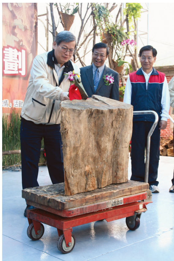
▲開幕典禮由林務局顏局長仁德開「斧」。

花蓮林區管理處主辦的「林業雕·原民刻·森坂劃—2007林業經營與原住民族文化木雕藝術創作活動」於96年11月11日舉辦盛大開幕典禮。開幕典禮由林務局顏局長仁德開「斧」，有別於一般活動以敲「鑼」「開鑼」方式展開，開幕活動是以斧頭劈向尚待雕刻原木，現場民眾無不嘖嘖稱奇。開幕活動簽到「簿」也別出心裁以紅檜製作，簽到「簿」周圍並配合活動主題雕刻原住民族及林業相關圖案，親筆簽名來賓字跡將於事後由木雕師雕刻於紅檜簽到「簿」上，與本次活動木雕作品永久存於林田山。