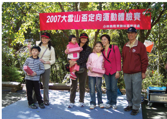
▲東勢林區管理辦理定向運動遊客研判地圖及管副處長立豪頒獎競賽結果。

回到原點即可核對是否正確。據參賽者表示，以上活動根據地形、地物來判斷方向是非常重要的。大雪山國家森林遊樂區內推動旅遊新體驗之定向運動，未來在帶學校團隊行程時將納入規劃。