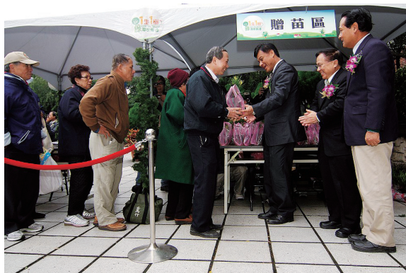
▲記者會後農委會蘇主委親自贈送樹苗給民眾。