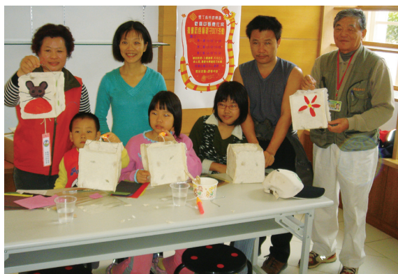
▲國家森林志工指導遊客製作紙燈籠。

墾丁國家森林遊樂區位於鵝鑾鼻半島的中央地帶，屬高位珊瑚礁岩，又地處熱帶，及每年10月至翌年2月的落山風吹襲，形成全台獨有的熱帶季風雨林區，區內植物多達1,300多種，自然景觀經多年完善保護，如