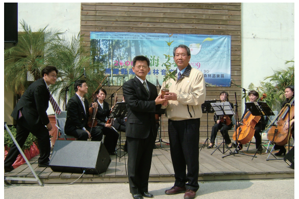
▲屏東林區管理處處長簡益章贈苗（桂花）給高雄縣縣長楊秋興。

屏東林區管理處及高雄縣政府於2月27日在高雄縣政府廣場，為3月9日在藤枝國家森林遊樂區共同主辦的「2008樹海之聲—高雄縣藤枝森林音樂會」舉辦宣傳記者會，會中由高雄縣交響樂團演奏梁祝小提琴協奏曲、莫爾島河等揭開序幕，另為配合當日的記者會，