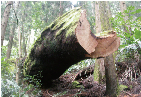
▲盜伐之牛樟。

管理處將結合當地社區民眾，以社區林業方式，共同加強林地護管巡視、查察取締工作，冀能根除盜伐案件及不法情事之發生。