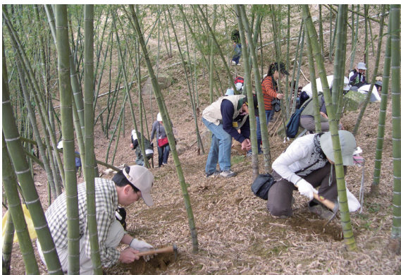
▲大雪山國家森林遊樂區暨大雪山社區生態旅遊示範地觀摩交流活動內容：採筍情形。

東勢林區管理處為持續結合各觀光資源主管機關，共同推動文化旅遊、生態旅遊與健康旅遊之發展策略目標，配合內政部營建署於3月27、28辦理大雪山國家森林遊樂區暨大雪山社區生態旅遊示範地觀摩交流活動。