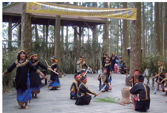
▲寶山國小表演「槍祭」及「報戰功」。

屏東林區管理處為提供獨特的生態旅遊與保存原住民傳統文化，於3月30日在藤枝國家森林遊樂區「柳杉平台森林劇場」辦理「森