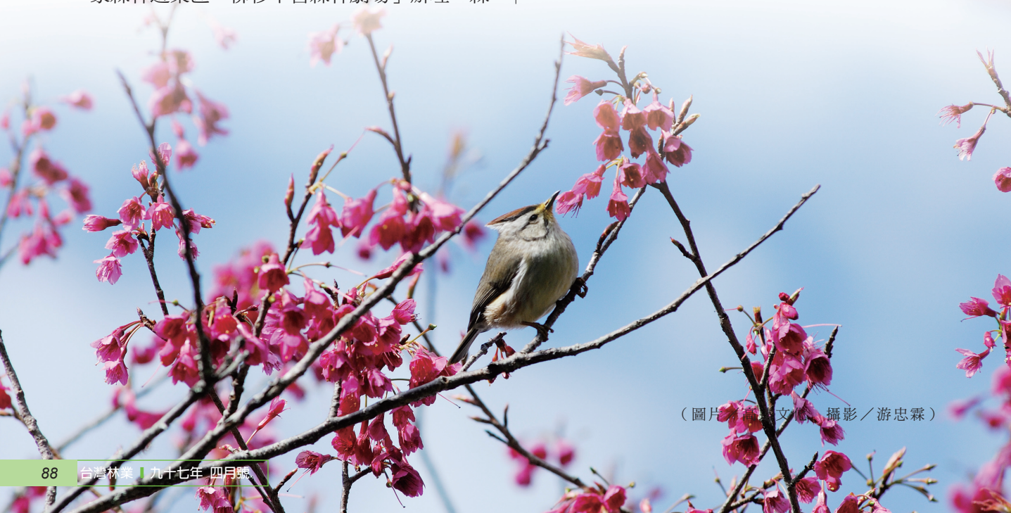
（圖片／圖文網 攝影／游忠霖）

今年初至3月期間，屏東管樂團與高雄交響樂團等接續演出，受到遊客熱烈迴響，此次為了保存自然與人文特色及支持社區永續發展，特邀請當地布農族舞蹈團與寶山國小等在「柳杉平台森林劇場」演出槍祭、八部合音及報戰功等15種包含文化與歌舞的表演，提供遊客最原始的音樂饗宴。（屏東林區管理處 洪寶林）