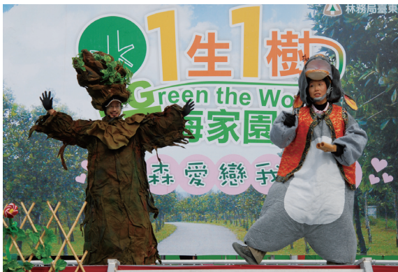
▲台東林管處的環教志工表演行動劇，一起討論救地球的方法。

在台東林管處及台東縣政府的號召下，台東地區一年一度的植樹節活動於3月8日在森林公園展開。上午9點鐘，活動準時開始，首先由台東商校管樂團演出，悠揚的樂聲，搭配著和煦的陽光，現場民眾時而靜靜的聆聽、時而隨著節拍搖擺。接著，由台東林管處的環教志工粉墨登場，裝扮成樹老、金鼠、胖蛙、螢火蟲等角色，在舞台上各自論述「少肉、減碳、多種樹」的議題，大家一起討論救地球的方法。藉著活潑生動的肢體語言、精彩有趣的對白，將許多日常生活中的環保小撇步介紹給現場的來賓及學生，讓大夥兒都看的目不轉睛而又笑聲連連，同時瞭解了現階段我們所遭遇