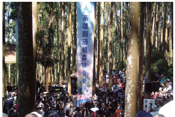
▲高雄縣管絃樂團在藤枝國家森林遊樂區之柳杉平台現場演奏情形。

此次音樂會特邀請高雄縣管絃樂團，在藤枝國家森林遊樂區演出，置身於林間山嵐中欣賞管弦樂音，更是人生的一大享受。而為響應林務局推動「一生一樹 綠海家園」活動，現場亦提供桂花、樹蘭、含笑花、羅漢松及黃金扁柏共1千株苗木贈給現場朋友，希望大家共同來植樹，因為「植樹」與「聽音樂會」都是一種深植人心的修養，當日活動引起熱烈的迴響。(屏東林區管理處 洪寶林)