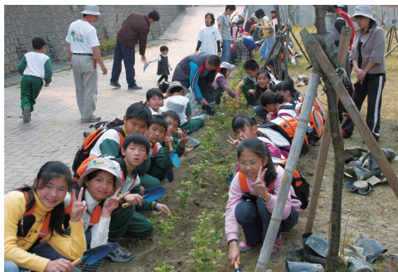
▲小朋友參加植樹活動將環境教育實際付諸行動。

活動首先由榮獲多家媒體邀請表演的豐陽社區鼓舞團帶來強而有力的太鼓揭開序幕，現場氣氛熱烈，此外，更有許多有趣的互動闖關活動，期望參與遊戲的小朋友可以從遊戲中瞭解森林的特色。