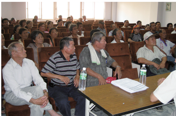
▲甲仙鄉國有林事業區內濫墾地清理說明會。（攝影／屏東林區管理處 朱惠絨）

屏東林區管理處為補辦清理「台灣省國有林事業區內濫墾地清理計畫」遺漏尚未完成清理之舊有濫墾地，自97年6月21日起開始受理申請，並分別於6月23日在桃源鄉公所、6月25日在六龜工作站及7月22日在甲仙共舉辦了3場說明會，占用人分別提出許多相關問題，屏東林區管理處人員除了解決占用人的相關提問外並巧妙的運用平時機關訓練的技巧化解許多占用人疑慮。（屏東林區管理處 朱惠絨）