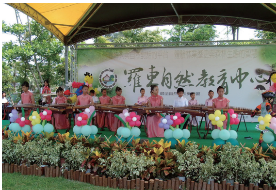
▲開幕活動古箏表演奏出優揚的音樂。

特殊日子所辦理的「主題活動」；及不定期推出的「特別企劃」等，不論是學校教師、親子或團體，都可以在中心課程中找到需求。(編輯部)