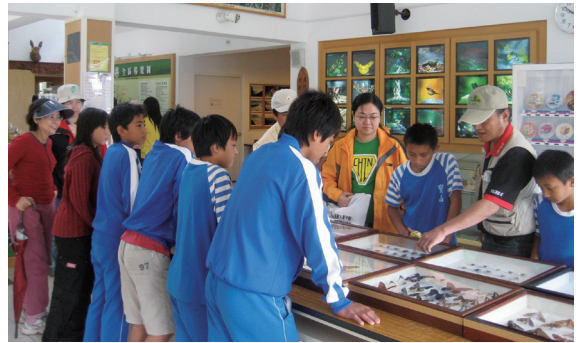
▲小朋友參觀遊客中心蝴蝶標本聽取志工哥哥解說。