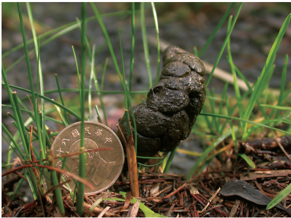
▲山羌排遺。