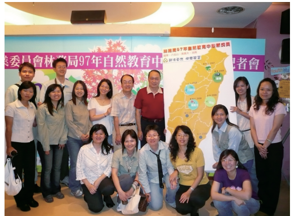
▲4處新成立之自然教育中心之工作夥伴合影。