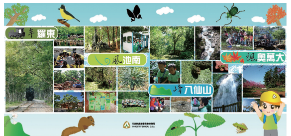
▲97年自然教育中心聯合開幕記者會文宣資料。（林務局提供）

教育中心，共計達成8個自然教育中心的目標，以打造台灣最完整的森林自然教育網絡。（林務局 羅秀雲）