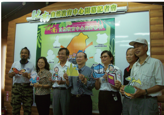
▲池南自然教育中心開幕記者會中與相關單位建立夥伴關係。

池南努力創造森林與人結合的一個快樂學習優質教育場域，全面提升花蓮地區環境教育與戶外遊憩之品質。不論您是大朋友或小朋友，都可在這森林學堂，快樂學習。 (編輯部)