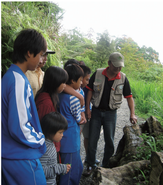
▲戶外課程是小朋友的最愛。（攝影／屏東林區管理處 廖國棟）

活動由特有生物研究保育中心中海拔試驗站人員專業指導與協助，講授藤枝的昆蟲生態，許多入園遊客亦一同聆聽。讓所有到藤枝遊玩之民眾除能享受森林浴外，亦能了解昆蟲生態對環境保護之重要性，使藤枝之旅更具豐富而感性。（屏東林區管理處 廖國棟）