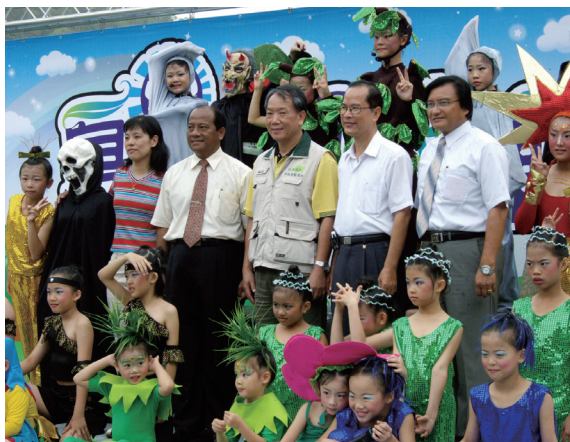
▲「夏日涼風綠動雙流」與會來賓及表演小朋友合影留念。

最特別的是邀請了屏東市啟智協會、屏東伯大尼之家及屏東勝利之家等弱勢團體來園區外，知名的爆米花兒童劇團也共襄盛舉，表演勵志生態歌舞劇—「大樹」，藉由小樹苗成長過程中必須接受大自然的考驗，忍苦耐磨、堅強勇敢，才能成為「大樹」，許多欣賞的小朋友皆深受感動。期望將感動化為直接的行動，讓台灣青山綠水長在，後代子孫皆能享有「福爾摩沙」之美譽。(屏東林區管理處 陳以臻)