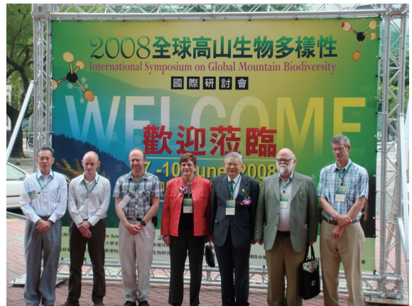
▲2008全球高山生物多樣性國際研討會外賓合影留念。

在2,000公尺以上的高山，生物多樣性受到氣候變遷的衝擊更為顯著，本次研討會特別強調高山生物多樣性之衝擊及脆弱度的評析，提出氣候變遷對高山生物多樣性衝擊之因應策略，將可做為政府從事永續發展之施政參考。（編輯部）