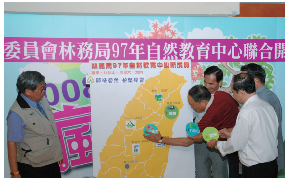
▲池南、羅東、八仙山、奧萬大自然教育中心陸續成立啟用。

林務局預計以3年的時間，在每個林區管理處各設置1處自然教育中心，98年預定將成立的有嘉義觸口、屏東雙流及台東知本自然