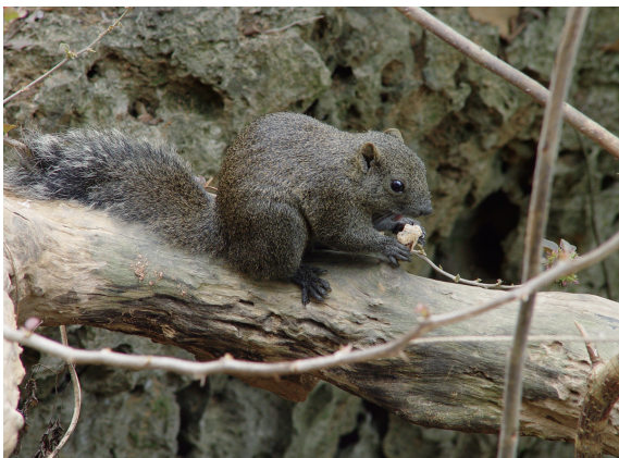
▲赤腹松鼠。

森林志工學員，讓志工夥伴們從另一個角度觀察自然的訊息，帶領民眾探險去，進入不同的動物趣味世界。如果民眾自行前往遊樂區時，別忘了也扮演森林中的柯南，找一找！猜一猜！是何種動物不小心洩漏了蹤跡？(屏東林區管理處 陳以臻)