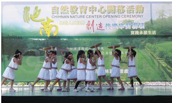
▲開幕活動中小朋友熱力表演原住民舞蹈。

東部第1座自然教育中心—池南教育中心於97年7月4日在快樂與繽紛的氣息中熱鬧開幕。開幕活動由在地原住民社區、文蘭國小、銅蘭國小表演熱情活力的原住民舞蹈、森巴鼓、及太魯閣傳統詩歌，宜昌國中管弦樂隊等團體表演揭開活動序幕。開幕活動中亦規劃有林業文化、森林美學及自然資源有關的闖關遊戲，另於會場中安排原住民射箭及社區DIY產品展示等活動。花蓮林區管理處特別於池南園區裝飾百隻大風車，當風車隨風轉動，象徵環境教育的推廣「生生不息」。當天多達500位民眾熱情參與，親身體驗了一場別具意義的開幕活動。