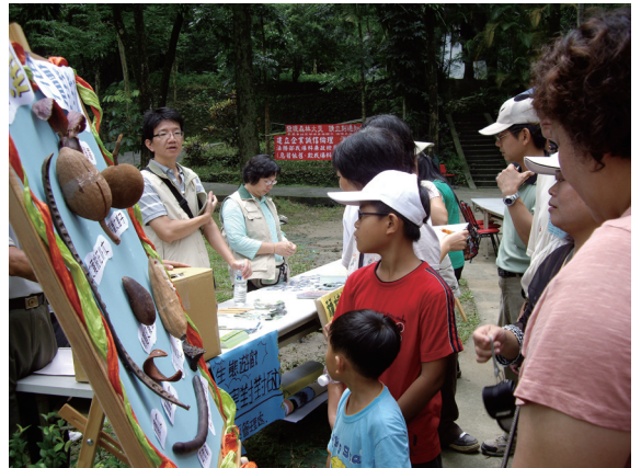
▲民眾參加果實對對碰遊戲。

屏東林區管理處再度與美濃愛鄉協會攜手合作辦理，今年更是以嘉年華會的方式舉辦，自97年7月26日起即有「樂活登山騎鐵馬」、「賞蝶去」等熱身活動，於7月27日的「祭蝶儀式」及「生態嘉年華會」盛大展開，同時協請屏東科技大學植物標本館（PPI）提供珍貴的一驅蟲大風子、南美叉葉樹、緬甸鐵木、大葉蘇白豆、銀葉樹及鳳凰木等樹種之果實，籍由果實對對碰活動，讓原本高掛在樹上的果實，經由民眾以手指觸摸，認識各樹種的果實；另配合「一生一樹、綠海家園」活動，於會中贈送桂花、含笑花等香氣迷人的樹苗及樹形優美之羅漢松等3種本土樹種；保林、防火常識答題拿獎品及「無痕山林」之登山倫理宣導逐一熱鬧登場。（屏東林區管理處 彭采宸）