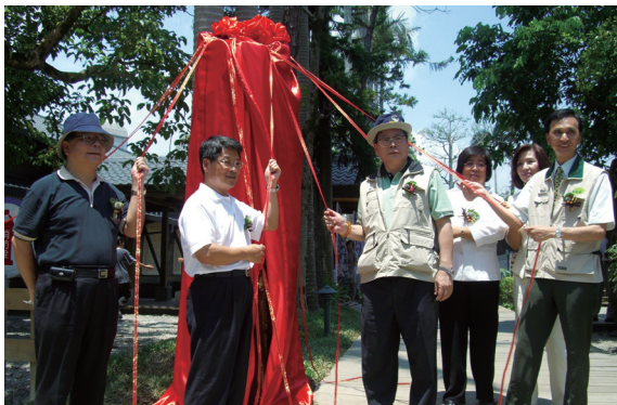
▲羅東自然教育中心啟用開幕揭牌。