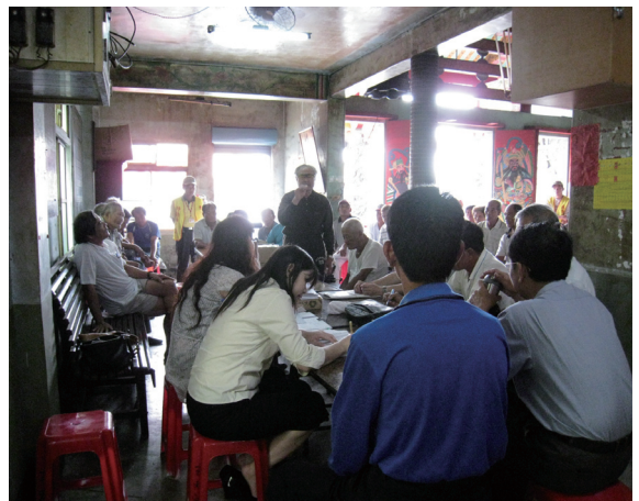
▲參加行動辦公室民眾踴躍發言。

屏東林區管理處為宣導林業政策及服務民眾，97年7月29日上午9時30分至中午11時在枋寮鄉新開村廟，辦理政策宣導及為民服務，本次下鄉服務項目包括：改正造林管理事宜、租地承租戶辦理換約、續約、繼承等相關業務、國家步道LNT無痕山林運動、候鳥保護宣導、乾燥季節防火宣導、其他林政、造林及保育相關業務等。當日由工作人員向鄉親說明現行之林業政策，當地鄉親參加情形踴躍，也針對林務相關政策提出自己的看法，讓林務單位帶回參考。