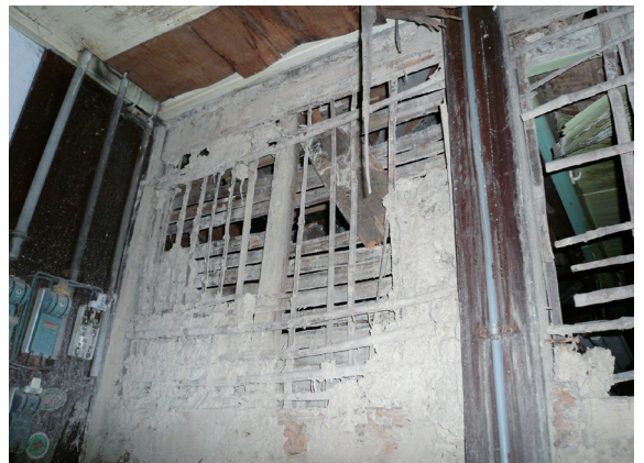
▲照片9 剝落的竹編土牆。

大約是在60年前，林務局的日籍豐澤先生從山上移植一株150公分左右的台灣油杉幼苗到22號宿舍的庭園內，如今已挺拔茁壯，