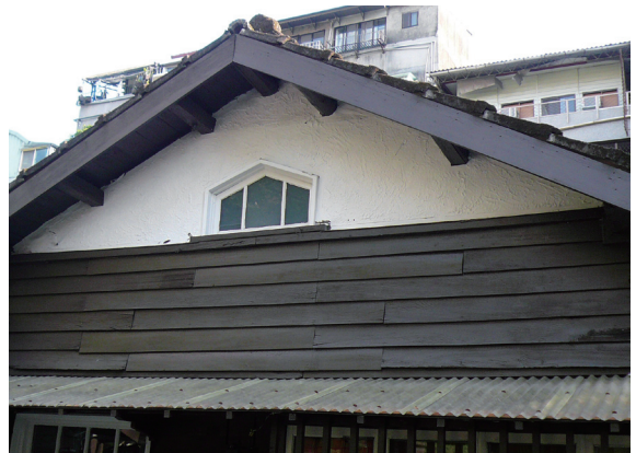
▲照片2 英式雨淋板和西班牙式粉牆。

東西向的和平東路及南北向的麗水街，由此展開的巷弄則影響了宿舍的佈局。在東西向的生活道路兩側，各家戶均朝向道路開門，主要的房間設於大門的反面，即北朝南和南朝北的兩種佈局，都存在於錦安里的宿舍群。這樣的配置形式不止於錦安里日式宿舍群，譬如同屬於新開發地區的大安，與專賣局有關的官舍，也採用朝北與朝南的官舍住宅，以配合東西向的生活道路（閻亞寧、林淑美，2006）。