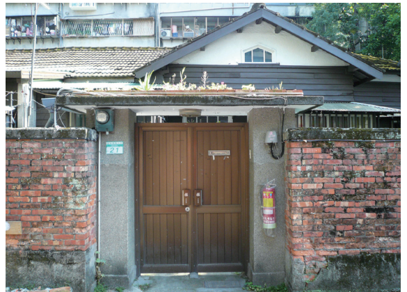
▲照片10 洗石子門柱及紅磚矮牆。

是平地少數存活的案例。經專家實地勘查發現，它的樹齡約在70~80年之間，開花結實情形良好，但種子多為空粒，發芽率極低，係因為附近沒有可供雜交的同類樹種之故。而這棵珍貴的老樹，遂成為社區發動日式宿舍保存的起始點。除了珍貴的植物資源，尚有喜鵲、樹鵲、五色鳥、貓頭鷹、鸚鵡等飛鳥常於此區徘徊，甚至以此為家（台灣油杉社區發展協會，2007）。