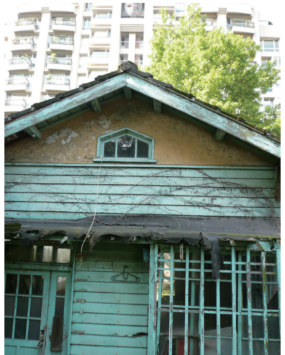
▲照片11 傾頹宿舍與嶄新大廈形成強烈對比。

另外一大特色是錦安里附近為數不少的日式住宅，紫藤廬便是其中之一。以錦安里所在的大安區而言，日治時期便以古亭町、錦町、福住町及一部分大安12甲範圍中的日式住宅數量較多，整區在2000年現存的日式住宅多達333戶，絕大部分原本是作為公家單位的宿舍，其中又以台大和師大的教職員宿舍為主，多分布在學校周圍的區域（薛琴，2000）。由於光復後日式住宅不斷被闢成新建地，許多現存的日式住宅呈現零散的分布，比較密集的有錦泰里日式宿舍群、錦安里日式宿舍群、青田街日式宿舍群以及溫州街日式宿舍群。這些宿舍建築本為殖民城市中殖民官員