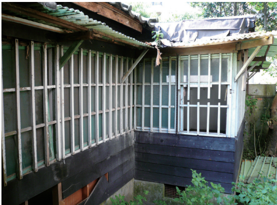
▲照片4 後院增建的木屋。