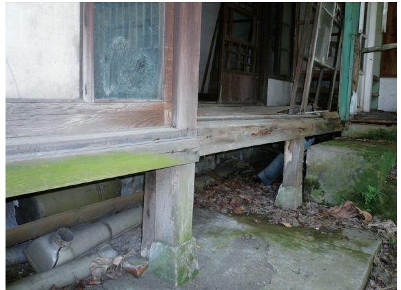
▲照片5 基座抬高以利防潮。