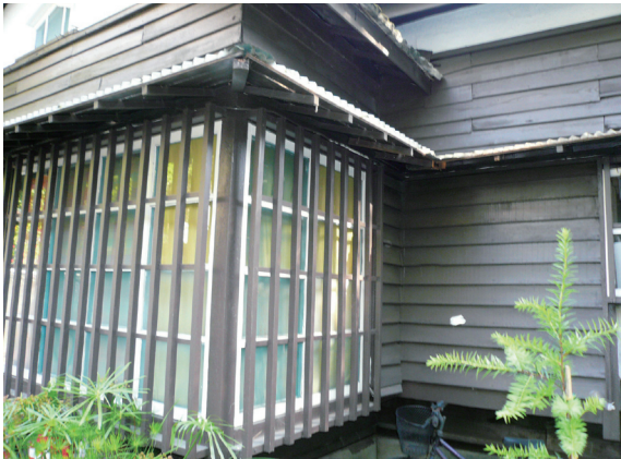
▲照片3 典雅樸素的木條窗戶。