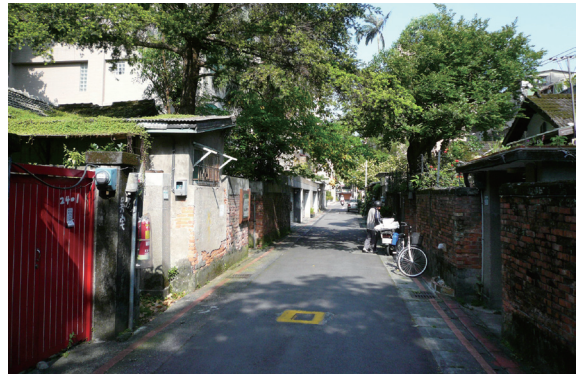
▲照片1 錦安里日式宿舍為南北相對格局。

傳統日本住宅觀念，多採單一的座北朝南配置，然而本區宿舍卻呈現較為特殊的狀況。與錦安里日式宿舍群最為相關的街道為