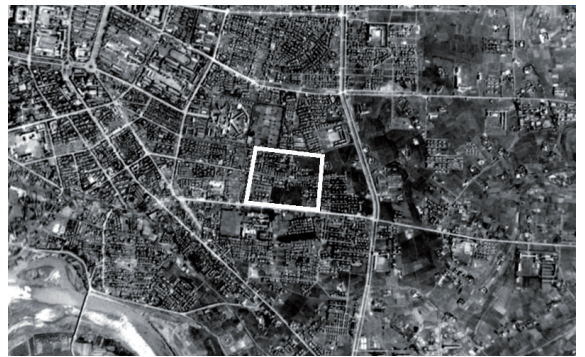
圖2 1947年台北市航照圖。