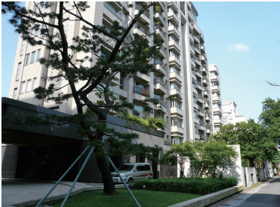
▲照片12 新建的大廈與殘留的老松。

建物的些許輪廓。雖然保存狀況不一，但是這些建物和遺跡均代表了日治中晚期政府計畫性地向台北城外東、南、及東南方建置公家機關和住宅用地的重要證據。