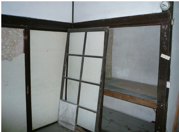
▲照片8 居間室內的收納。

評估標準列為嚴重瀕臨滅絕之物種，也是台灣文化資產保存法公告保護的5種珍貴稀有植物之一。其為松科油杉屬的常綠大喬木，生長速度緩慢，木材質地緻密，紋理漂亮，是良好的建築材料；又因其木材含油量高，故稱油杉。台灣油杉僅分布在台灣本島南北兩端，分別為北部的坪林、礁溪一帶，以及南部的大武山區，目前這三個地區都設有台灣油杉的保護區（林務局，2007）。