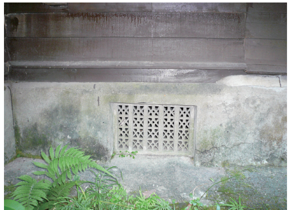
▲照片6 基座通風口。