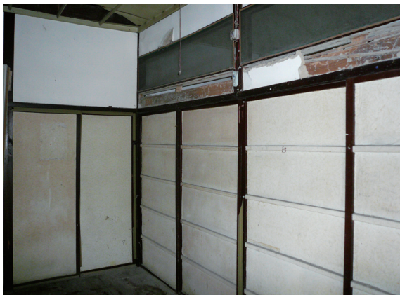
▲照片7 白色底底的格間板。