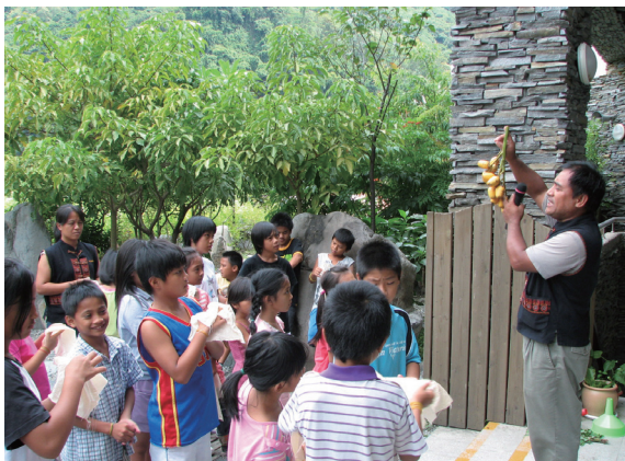
▲解說植物染材料。

研習皆以活動方式呈現，讓學員以身心體驗的方式吸收有關自然的知識，以「植物染DIY」、「動植物尋親」、「植物編織DIY」最受歡迎亦最能傳達取用自然、保育自然的