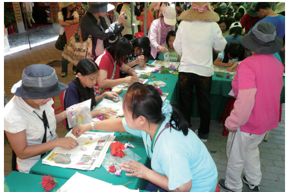
▲民眾參與開幕現場DIY活動。