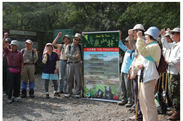
▲參加淨山民眾在登山口處呼口號為自己打氣加油。

為推動「無痕山林」運動的概念，屏東林區管理處利用暑假結束前的週末，特別選在人文史蹟與動植物資源都極為豐富的浸水營古道辦理淨山活動，參加活動的民眾於97年8月30日早上9點半抵達古道屏東端入口處，並接受「無痕山林」運動宣導概念後，開始古道的健行淨山活動，沿途清代營盤遺址、日治時期駐在所遺跡以及各種動植物資源，在志工生動而專業的解說帶領下，使民眾在淨山之餘，對先人篳路藍縷、開山修路、移民後山的心境能有切身的感受；此外沿途豐富的鳥況及植物相，在漫長的路程中亦提供了天籟之音及沁脾的清涼，也舒緩了身心的疲憊；下午4點鐘，一行人到達台東大武加羅板，隨即搭乘小巴士返回屏東，結束了一天疲憊而充滿意義的行程。活動結束後，屏東林區管理處並籲請參加民眾，在林務局網站內的台灣山林悠遊網簽署無痕山林宣言，為推動「無痕山林」與捍衛台灣山林之美共同努力。（屏東林區管理處 劉大維）