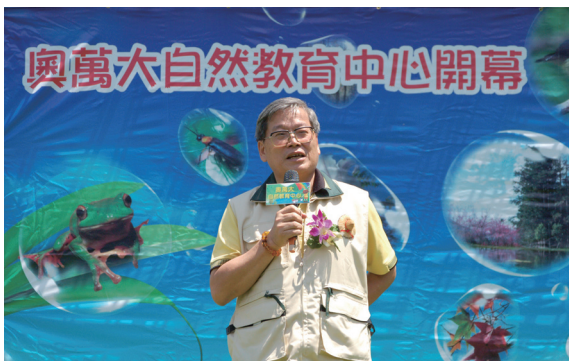
▲林務局局長顏仁德於開幕典禮上致詞。

開幕活動，由奧萬大的鄰居萬豐國小及松林部落分別以歌唱及舞蹈為中心慶生，生態闖關遊戲「飛吧！美麗的種子」、「誰是一對」、「承諾鳥與時光明信片」、「奇幻的水中世界」、「我是鳥媽媽」等帶給參與的民眾出奇不意的驚喜。今年主題夏令營