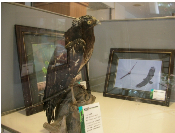
▲墾丁猛禽生態展現場。

另因猛禽辨識不易，觀察距離又遠，除了少數專精猛禽觀察愛好者之外，一般大眾只能感受墾丁猛禽遷移盛況的熱鬧氣氛，而無法窺其堂奧，進而瞭解猛禽的生態並領略其中之美，屏東林區管理處於97年9月13日起至10月27日止，假墾丁國家森林遊樂區舉辦「恆春半島猛禽生態攝影展」活動，內容包括：恆春半島常見猛禽生態標本展示、恆春半島猛禽攝影展、恆春半島猛禽介紹、猛禽的生態地位、猛禽的傳說故事、猛禽生態影片欣賞。希望藉由寓教於樂的方式，引導民眾認識遠來的嬌客。