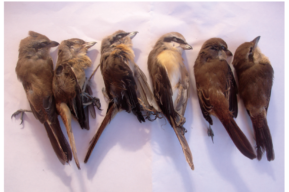
▲慘遭扭斷脖子的紅尾伯勞鳥，死狀淒慘。

屏東林區管理處與森林警察隊及枋寮分局獅子分駐所員警，於97年9月26日上午7時許在枋山鄉善餘村公墓旁的芒果園內，查獲