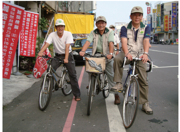
▲響應世界無車日屏東林區管理處處長與同仁一起騎鐵馬上班。

自歐盟決議將每年的9月22日訂為世界無車日（World Car Free Day）以來，以無車日宣傳環保概念的作法，廣受世界各大城市歡迎並採行；「世界無車日」的精神，不代表沒有車輛，而是要鼓勵大家盡量使用大眾運輸工具，以節約能源，減少石油的使用。屏東林區管理處近年來在國有林地積極造林，辦理平地綠美化工作，為降低二氧化碳的排放，減緩