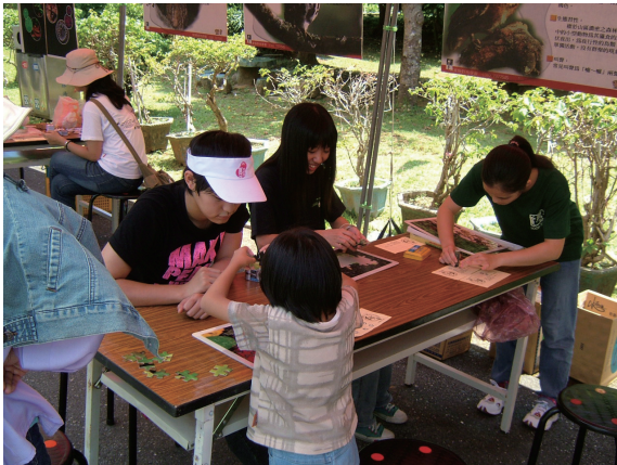
▲墾丁群鷹會生物多样性闖關遊戲活動，民眾參加踴躍。

灰面鷲、赤腹鷹剪影，並裝飾上五顏六色之風車，闡述落山風起與灰面鷲、赤腹鷹飛抵恆春半島意象。