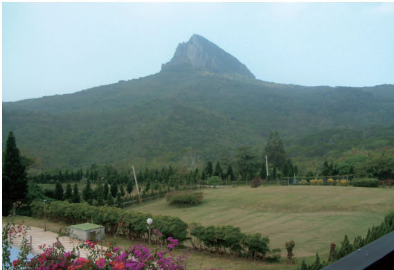
▲由墾丁賓館Lobby可眺望恆春地標一大尖山。(攝影／屏東林區管理處 張志明)

釋放投資訊息外，亦期望能透過招商說明會聽取民間廠商的意見，屆時歡迎合於資格之民間廠商參與本案，共同為墾丁地區觀光遊憩貢獻心力及開創新契機。(屏東林區管理處 彭采宸)