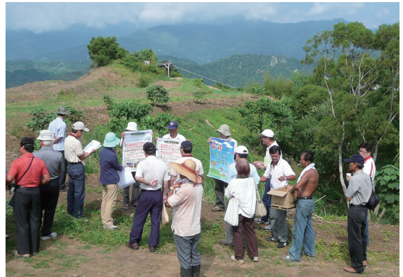
▲興昌社區總幹事向評選委員現場解說。

各個受考評社區對本評比也相當重視，紛紛慎重以簡報及現場講解等方式向評選小組委員說明規劃設計理念、栽種樹苗及後續維護管理等工作，最後在評選會議中統計各社區成績。評選結果：第1名（全國模範社