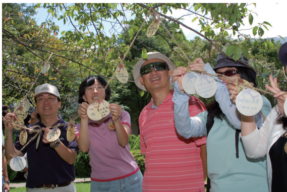
▲參加人員寫下對奧萬大孩子的祝福並許下對環境永續的承諾。（攝影／林務局 黃信富）

活動已搶先登場，營隊中透過各種生態、藝術以及探險活動，帶領小朋友與大自然做最直接的接觸，讓小朋友可以在營隊中獲得豐富的自然知識，培養關懷周遭萬物的人文情操，成為永續小尖兵。（林務局 羅秀雲）