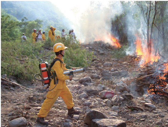
▲救火人員使用脈衝槍滅火。