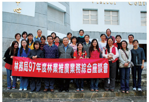
▲林務局97年度林業推廣業務綜合座談會假知本國家森林遊樂區舉辦。

為加強推展林務局與各林區管理處、農林航空測量所林業推廣業務，並交換彼此工作心得及經驗交流分享，於97年11月18、19日假台東林區管理處轄屬知本國家森林遊樂區舉辦「本局97年度林業推廣業務綜合座談會」。