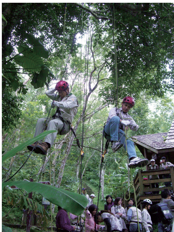
▲山湖戀－樹冠上的眺望爬樹體驗活動。

旅遊與環境教育工作上一起成長茁壯，每年均藉由年會的舉辦，讓朝氣蓬勃的志工夥伴們相聚一起，藉由經驗分享與交流，共同成長。「2008林務局國家森林志工年會」於97年11月28、29日，在山光水色的池南國家森林遊樂區盛大揭開序幕。來自各地的志工夥伴除林務局8個林區管理處成立之志工團隊外，尚包括台灣大學實驗林管理處、中興大學實驗林管理處、林業試驗所及特有生物研究保育中心的志工團隊，大家在山湖戀活動中體驗大自然的恩惠與賜予。