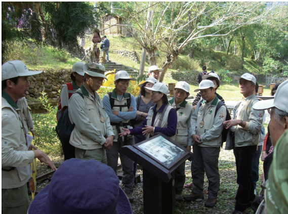
▲志工於林田山林業文化園區進行參訪活動。

志願服務績優團隊」及「國家森林之友」；最後由各隊志工展現活力與熱忱，分別表演精彩