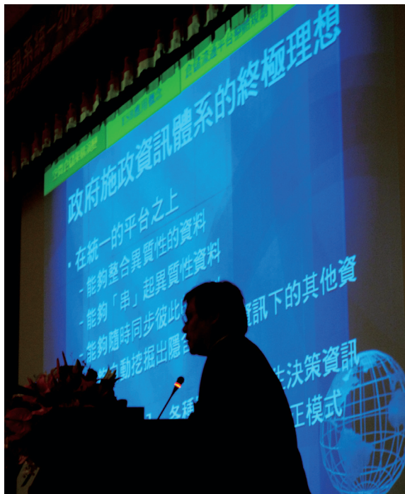
▲「國土資訊系統—2008自然資源與生態資料庫分組成果研討會」成果專題簡報。