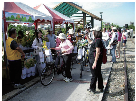
▲林管處於鐵馬騎遊活動路線設站提供樹苗及福袋贈送現場參與的民眾。

嘉義林區管理處配合嘉義市政府於97年11月15日辦理「2008桃城風情季－鐵馬騎遊」活動，騎自行車已成為日益盛行的全民運動，不僅增進親子關係、更能強健體魄，促進全民身體健康。而在享受追風趣的同時，也藉由植樹來為地球減碳。