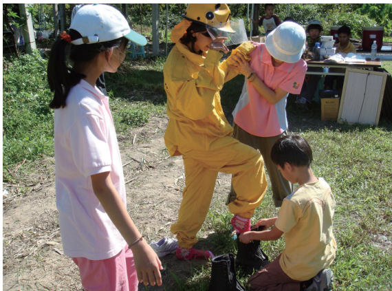
▲比比看誰完成國家救火隊的著裝比較快！

15日一早，參加活動的大人小孩陸續報到，在慈濟的師姑帶動下動一動、唱唱歌後，小朋友先推土窯，接著由環教志工演出「森林嗑牙記」，藉由森林裡老樹、青蛙和螢火蟲的