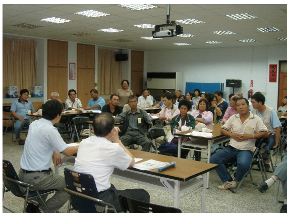
▲綜合座談會學員發問情形踴躍。

為營造台東縣地方社區優質生活環境，台東林區管理處大力推廣98年度社區植樹綠美化計畫，於97年10月3日假台東林區管理處3樓大禮堂與財團法人七星環境綠化基金會合辦「社區綠美化政策宣導研習班」，由處長張彬親自主持，課程內容包括現行造林政策、社區綠美化補助規範及環境綠美化規劃與植栽配置及種好植栽的簡要方法等。