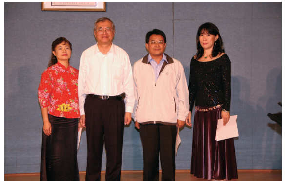
▲北區複賽個人組前3名。