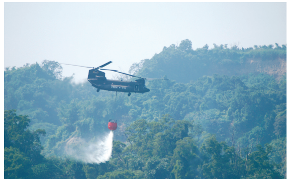
▲陸軍航空特戰指揮部CH-47SD型直升機演練救火情形。

雲林縣消防局、南投縣警察局、雲林縣警察局、南投縣衛生局、台大實驗林、森林暨自然保育警察隊南投分隊及林務局南投林區管理處等單位共同參與演練。演練地點位於雲林縣林內鄉之阿里山事業第61林班，演習方式以救災實兵綜合演練，劃分19項演練主題實施，現場觀眾能目視各種救火作業操作情形，在專人講解下，共同體驗最新式陸空聯合防救技術。