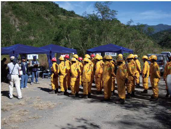
▲各組機動隊完成報到。

降低所轄森林火災頻度及面積，屏東林區管理處於97年11月7日假屏東縣枋寮鄉枋山地區，與屏東縣消防局第三大隊聯合舉辦「97年度森林火災聯合防救演練」。演練火場地點為屏東縣枋寮鄉潮州事業區第31林班境內，其演習程序及方式為「火災現場成立ICS指揮所」、「機動救火隊報到集合」、「各項滅火器具包括脈衝式滅火槍、高效能空壓機、細水霧幫浦系統、滅火劑之講解與操作」、「各站機動救火隊長至ICS指揮所接受任務指派」、「高效能空壓機加壓及同時鋪設大型水袋並與