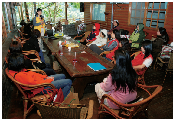
▲林業推廣業務經驗交流分享。

當日之林業推廣業務綜合座談會，由與會單位分別簡報97年度林業推廣業務推動情形及98年度工作方向；另安排參觀知本國家森林遊樂區，促進各林管處間有實地業務交流之機會，以及參訪曾參加台東林區管理處社區林業計畫之「龍田蝴蝶村」，讓推廣同仁實地瞭解林務人員與社區夥伴之互動關係。11月19日之業務交流時間，則由林務局、羅東林管處及台東林管處代表與談，以如何辦理推廣業務或活動為題各提出20分鐘之經驗分享，激發推廣同仁的創意火花。