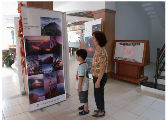
▲親子共同欣賞攝影作品。

時序邁入秋季，又是赤腹鷹、灰面鵟鷹過境的高峰，為了讓民眾更加親近、認識猛禽，進一步瞭解猛禽的生態，繼而傳達保育概念，屏東林區管理處97年10月9日於墾丁國家森林遊樂區的遊客中心辦理「97年度恆春半島猛禽生態展」，內容包括恆春半島常見猛禽生態標本展示、恆春半島猛禽攝影展、恆春半島猛禽介紹、猛禽的生態地位、猛禽的傳說故事、猛禽生態影片欣賞等，例假日並有專業解說員現場解說。此外，為了推廣國家步道活動，同時也展出了「國家自然步道系列推廣活動—越走越美麗」連作組攝影