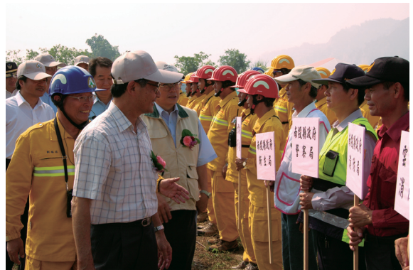
▲農業委員會主任委員視察演練現場。

本次演練，空中部分由內政部空中勤務總隊派遣UH-1H型直升機3架，陸軍航空特戰指揮部CH-47SD型直升機2架支援，地面部隊由內政部消防署特種搜救隊、南投縣消防局、