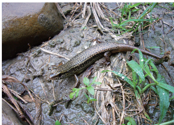
▲印度蜥蜴－斗六地區個體花紋與西部其它地區略有差異。

龍子 ( Eumeces elegans )。蛇類部分，則以梭德氏游蛇 ( Amphiesma sauteri sauteri )、雨傘節和花浪蛇 ( Amphiesma stolatum ) 的數量