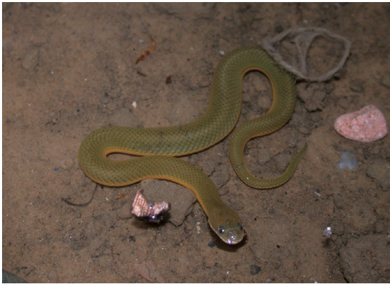
▲棲息在溼地環境的鉛色水蛇，在今日已相當難得一見。

草花蛇 ( Xenochrophis piscator ) 和幾乎瀕臨絕跡的鉛色水蛇，在斗六丘陵的濕地裡，意外地發現少量的野外族群，這是過去其它研究報告中所從未提及的新紀錄。而台灣滑蜥、環紋赤蛇、梭德氏游蛇和斯文豪氏游蛇等數量較稀少的種類，在調查範圍內也有穩定的族群存在，關於上述物種地理空間分布和個體生活史等習