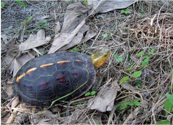
▲食蛇龜是一種在低海拔山區地區活動的陸龜，受到開發和非法獵捕的影響，野外的數量已大幅下降。