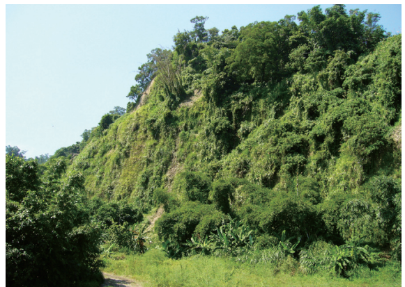
▲斗六丘陵地邊緣常形成陡峭的崩塌地形。

雲林縣位於台灣西南部平原地區，由於屯墾時間較早，縣境內大部分平原已成為農業生產區和都市聚落，受限於地形因素，東側山區丘陵開發不易，因此在某些地勢險惡，不易到達的地方，至今依然維持著相當原始的風貌，孕藏著豐富而罕為人知的自然資源。丘陵的範圍同時涵蓋林務局阿里山事業區第61~73林班地，東側以清水溪與南投縣竹山鎮相隔，形成天然的地理屏障，北側則有濁水溪與彰化二水鄉南北遙望。地質上屬於頭嵙山層，主要由砂岩、頁岩及礫岩所組成，膠結鬆散的結構，在丘陵邊緣處造成許多陡峭的崩塌地和侵蝕山溝。丘陵地區大部分為竹林和檳榔園，稜線和溪谷兩旁則有次生林分布，以大葉楠 ( Machilus japonica )、香楠 ( Machilus zuihoensis )、野桐 ( Mallotus japonicus ) 及白匏子 ( Mallotus paniculatus ) 等樹種為主，林下地表植被則以觀音座蓮 ( Angiopteris lygodiifolia )、鱗蓋鳳尾蕨 ( Pteris vittata )、中國穿鞘花 ( Amischotolype chinensis ) 和姑婆芋 ( Alocasia macrorrhiza ) 為主要優勢。私有地上多種植經濟作物，包括麻竹 ( Dentro-