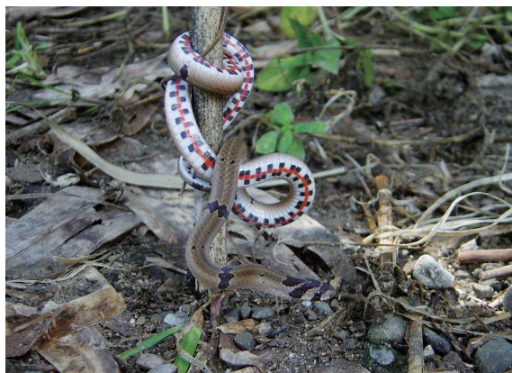
▲赤腹松柏根－數量不多的小型蛇類，相關生態資料的了解仍十分有限。

蛇類部分，按排序分別以7月、5月和8月的出現數量較多，1~2月則最罕見（圖1）。幾乎全年均可見活動的種類則有梭德氏游蛇和雨傘節等2種（≥9個月），花浪蛇和赤背松柏根（ Oligodon formosanus ）的出現季節則在