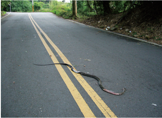
▲道路常成為動物在環境間移動時的障礙，遭到車輛輾斃的情形也經常發生－過山刀。

記錄到爬蟲類9科37種，其中目視和其它發現9科33種，路死則有6科20種，陷阱調查法記錄8科25種（表1）。調查區域中出現的物種包括有食蛇龜1種屬於珍貴稀有的二級保育類和錦蛇（ Elaphe taeniura ）、鉛色水蛇（ Enhydris plumbea ）、斯文豪氏游蛇（ Rhabdophis swinhonis ）、雨傘節（ Bungarus multicinctus multicinctus ）、眼鏡蛇（ Naja atra ）、環紋赤蛇（ Sinomicrurus maccllelandi ）與龜殼花（ Protobothrops mucrosquamatus ）等7種其它應予保育的三級保育類物種。