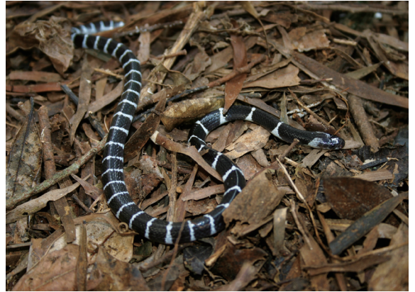
▲斗六丘陵數量相當普遍常見的爬蟲類物種－雨傘節。

目視調查的效果主要取決於調查人員本身的野外經驗和對於物種習性的熟悉程度，雖然經驗豐富的研究者在足夠的調查時間下，的確能夠發現到環境中大部分活動物種的出現情形，但有時候也容易因為本身的主觀因素，集中在少數物種或是忽略對於特定區域和環境類型的注意力，造成資料收集上的盲點。對於某些外觀相似的種類，例如正蜥科（ Lacertidae ）而言，即使是經驗豐富的研究者，想要只憑靠著目視觀察而區分出種間的不同差異，實際上也