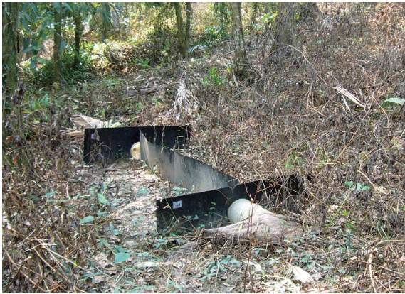
▲利用隔板改變動物行進方式的原理所設計的導板集井式陷阱。

連續作用的陷阱輔助調查人力上的不足，就扮演了相當重要的角色。早期利用陷阱捕捉爬蟲類的方式以掉落式陷阱 (Pitfall Trap) 最為常見，原理是將內壁光滑的容器如塑膠桶埋入土中，讓容器口與土面等高，等待動物行經掉落而被捕獲 (朱賢斌，1999)。但是由於掉落式陷阱在使用上僅能誘捕到少部分的物種，架設又容易受到環境條件的限制而成效不彰，因此一直未被廣泛應用。這個情形直至2003年由毛俊傑博士利用本地容易取得的材料，改良研發出新式的導板集井式陷阱 (Drift Fence Funnel Trap) 才突破了研究上的困境。利用阻隔板本身的阻擋效果，改變行進中動物的方向，引導向左右兩側單向開口式陷阱內移動，進而捕捉的設計原理，從此在爬蟲類調查方法的研究上，寫下了一個極重要的里程碑。它不但能夠有效攔截大部分地表上出現的爬蟲類，同時能滿足科學上定量、定性的標準化要求，在實際的野外應用上，亦已獲得相當卓著的成效 (毛俊傑和賴玉菁，2006；黃襄德等，2006；Norcal and Mao, 2006；曾翌碩和毛俊