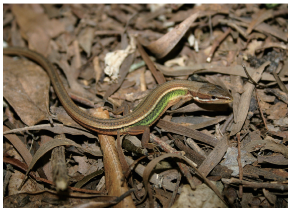
▲低海拔地區常見的台灣草蜥－在外觀上與蓬萊草蜥極為相似而不易分辨。