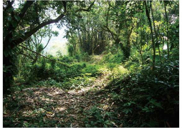
▲次生林下陰暗潮溼的地表，成為許多爬蟲類動物良好的棲息場所。

數量。在野生動物的資源調查工作中，爬蟲類個體由於本身具有活動隱密，行進無明顯路徑和出現地點不固定等特性，同時又涵蓋不同時段活動的日行性與夜行性物種，長久以來，該類群資料的收集被認為是一件相當費力的工作。雖然大部分外溫型的爬蟲類動物行動明顯受到溫度影響，普遍集中在溫度較高的季節出現，此一季節也被認為是最佳的調查進行時間。然而，地處亞熱帶的台灣，氣候變化與溫帶地區的情形不同，文獻中亦未提及任何爬蟲動物冬眠的情形，即使是在冬季，也可能是