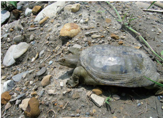
▲中華鰲的適應能力很強，靜水域埤塘和中下游河段均可發現活動蹤跡。

數量。在野生動物的資源調查工作中，爬蟲類個體由於本身具有活動隱密，行進無明顯路徑和出現地點不固定等特性，同時又涵蓋不同時段活動的日行性與夜行性物種，長久以來，該類群資料的收集被認為是一件相當費力的工作。雖然大部分外溫型的爬蟲類動物行動明顯受到溫度影響，普遍集中在溫度較高的季節出現，此一季節也被認為是最佳的調查進行時間。然而，地處亞熱帶的台灣，氣候變化與溫帶地區的情形不同，文獻中亦未提及任何爬蟲動物冬眠的情形，即使是在冬季，也可能是