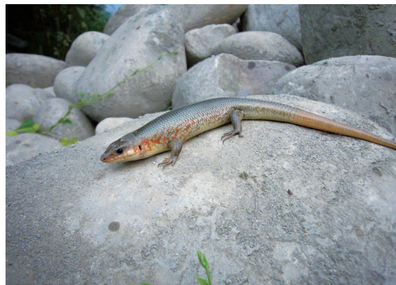
▲中國石龍子 (成體)，本種在西半部多為零星紀錄，在斗六丘陵地區主要出現在農墾地邊緣活動。

龍子 ( Eumeces elegans )。蛇類部分，則以梭德氏游蛇 ( Amphiesma sauteri sauteri )、雨傘節和花浪蛇 ( Amphiesma stolatum ) 的數量