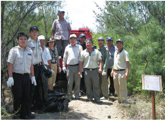
▲屏東林區管理處發動員工、擴大就業臨時工及替代役到海岸防風林地撿拾民眾丟棄的廢棄垃圾，共同為乾淨的山林努力。（攝影／屏東林區管理處 黃俊明）

嚴厲譴責蓄意傾倒廢棄物，破壞生態環境的行為，同時也感謝屏東縣恆春鎮公所清潔隊過去協助林務局為環境淨化來打拼，並衷心期盼未來能結合更多政府機關、地方團體、社區及民眾的結合，共同維護美麗的山林，讓青山綠水不再只是個口號。（屏東林區管理處 黃俊明）