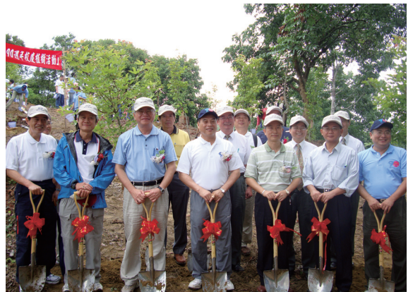
▲植樹活動後大家一起拍照留念。

樹木600株。本次植樹活動除了由林務局提供樹苗，中興大學提供植樹場地，玉山銀行也贊助後續的撫育經費，這種結合產、官、學三方的植樹合作模式，將讓台灣的環境品質提昇，締造更優質的健康生活。（嘉義林區管理處 黃淑芳）