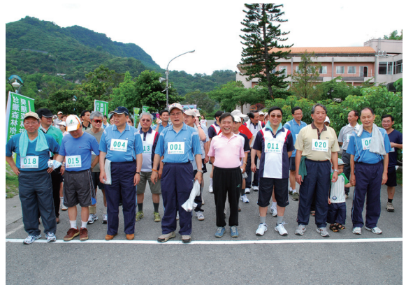
▲98年度森林護管人員越野體能競賽主管組開跑。

前開幕，由林務局局長顏仁德主持，他勉勵所屬各單位的森林護管人員，鍛練好身體，對工作及個人都有助益，與會貴賓有台東縣縣長鄭麗貞、立法委員黃健庭到場為參賽選手打氣，隨後團體組於8時50分鳴槍開跑，5分鐘後主管組也開始競技。林務局為促進業務及情誼交流，除了8個林管處所屬1個工作站之機動防火隊及ICS女性成員、農林航空測量所、森林暨自然保育警察隊組隊參加外，更邀請行政院農業委員會，以及會屬林業試驗所、特有生物研究保育中心同仁共襄盛舉，參賽單位計14個單位，總計150名越野賽好手