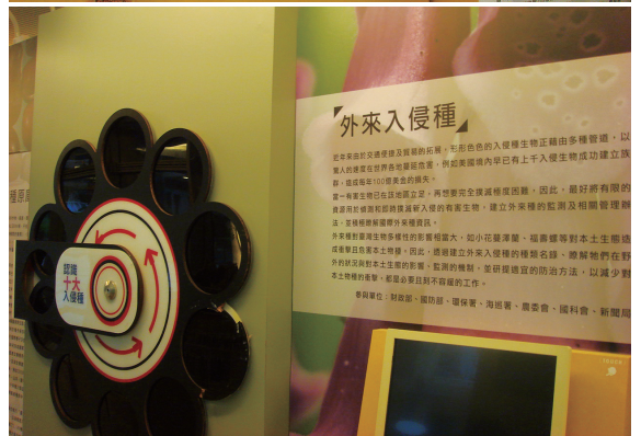
▲「啟動每一天 看顧每一刻—生物多樣性推動方案成果展」，在墾丁國家森林遊樂區遊客中心1樓展示。

安全；生物多樣性需要更多的行動—教育推廣、傳統智慧文化、社區林業與社區營造。希望透過這次的成果展，讓民眾更了解生物多樣性，也進一步了解政府為生物多樣性做了哪些事？生物多樣性對台灣人的生活產生什麼影響？這個生機盎然、豐富又深入淺出的展出將帶大家一窺究竟！（屏東林區管理處 楊中月）