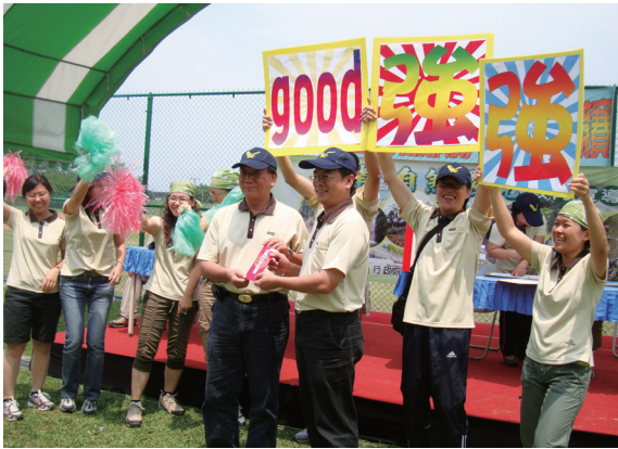
▲屏東林區管理處環境教育宣傳暨五一勞動節慶祝活動，特別設計精神總錦標獎項，由「強強good」隊獲得第1名。