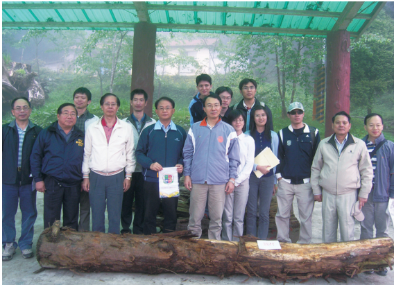
▲材種辨識及檢尺作業後合影。

員深入簡出、精闢講解材種辨識方法與不同材種檢尺要領及示範操作後，深獲參與的檢察官一致肯定。咸認此行林政業務戶外觀摩相當難得、受益良多，相信對於往後在偵辦林政案件上更能客觀衡酌，以達勿枉勿縱；同時此行亦建立兩單位未來在業務合作上更為契合。(嘉義林區管理處 莊獻寶)