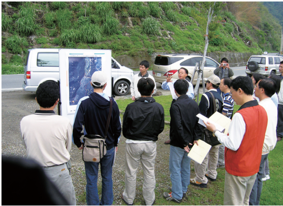
▲火災現場簡報說明。