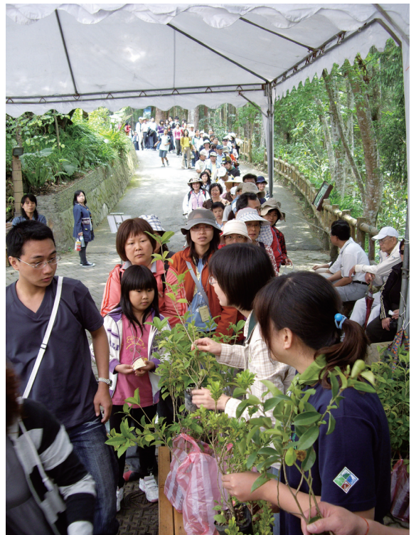
▲音樂會現場提供500株樹苗讓聆聽完音樂會的遊客免費帶回家。