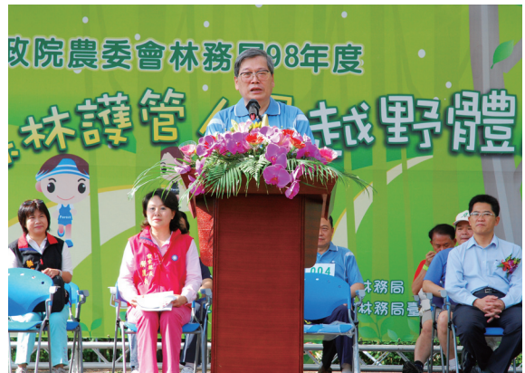
▲98年度森林護管人員越野體能競賽開幕典禮林務局局長顏仁德致詞。

由林務局主辦、台東林區管理處承辦的「98年度森林護管人員越野體能競賽」，98年4月25日上午8時在台東縣東遊季溫泉渡假村