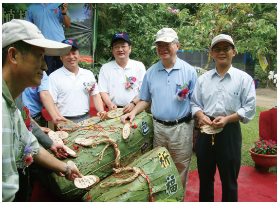
▲祈福包中－祈求國泰民安、風調雨順。

接著，由嘉義林區管理處植樹達人以生動有趣的方法教大家如何正確的種樹、照顧樹苗，讓民眾親手種植的樹木可以達百分百存活。當天並種下台灣檫、台灣欒樹等台灣原生