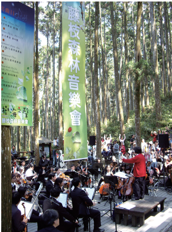
▲由名指揮家涂惠民帶領高雄縣交響樂團，每位遊客身心靈帶來煥然一新的感受，是別有一番風味的森林體驗。

由林務局屏東林區管理處及高雄縣政府共同辦理的「樹海之聲－2009藤枝森林音樂會」，於98年4月12日在藤枝國家森林遊樂區盛大舉行。在濤濤樹海中，由名指揮家涂惠民帶領高雄縣交響樂團，以「吉普賽風情交響曲」曲風帶來一系列的著名交響詩篇，如柴可夫斯基《天鵝湖組曲》、歌劇魅影組曲以及蓋西文《藍色狂想曲》等，更聘請國內知名小提琴演奏家黃維明博士擔當《流浪者之歌》、《泰依斯冥想曲》小提琴協奏等7首組曲演出，管弦樂音與森濤互相唱和，讓民眾沐浴在自然的芬多精中享受樂團帶來的旖旎樂章，為每位遊客身心靈帶來煥然一新的