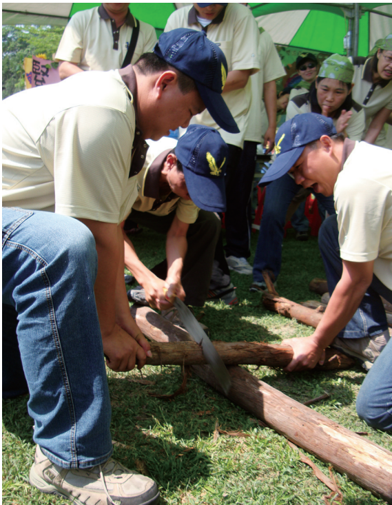
▲屏東林區管理處98年度擴大慶祝五一勞動節體能競賽—「開闢防火巷」之鋸木頭競賽。

教育宣傳暨五一勞動節慶祝活動，各業務單位包括工作站共計9個隊伍參與，有作業課同仁組成的轟炸雞隊、治山課組成的清溪隊、還有林政課同仁組成的強強滾隊等，一大早就見各